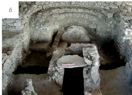
PLAN GENERAL AL BAZILICII DIN SECOLUL IV D. CHR. DE LA HALMYRIS

8. Domniile lui Iustin I (518-527) și Iustinian I (527-565) au însemnat perioade de avânt a așezării. Masivitatea construcțiilor pare să justifice transformarea definitivă a cetății de la Halmyris într-unul din cele 15 importante orașe ale provinciei Scythia , așa cum menționează Hierocles în Synecdemus . Pe de altă parte, așezarea de la Halmyris a primit rangul de episcopie, fiind înscrisă de Notitia Episcopatum între cele 15 episcopii ale provinciei Scythia .