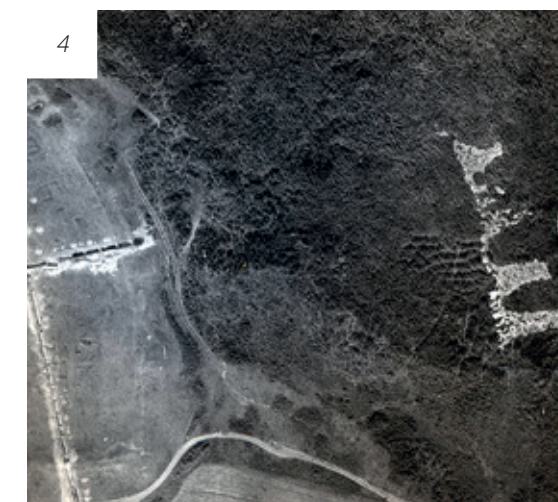
INSTALAȚIILE PORTUARE DE LA HALMYRIS ÎN SECOLELE II-IV D. CHR.