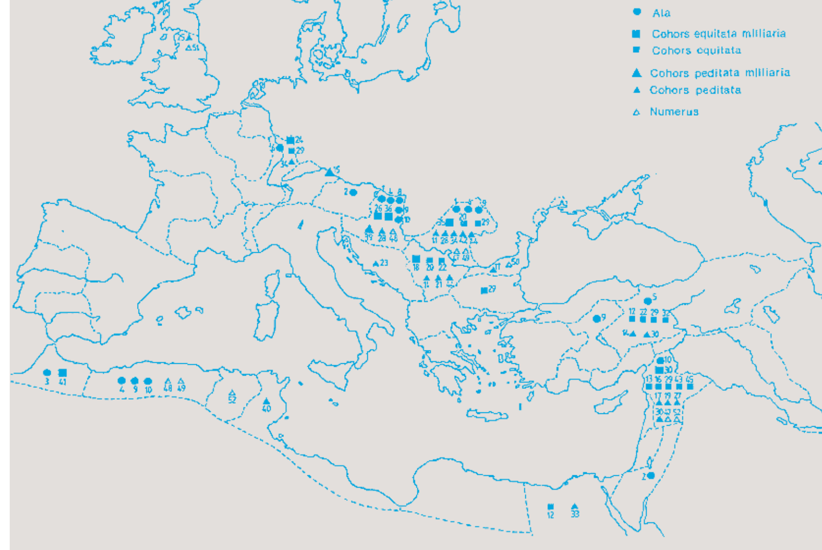
DISTRIBUIREA TRUPELOR DE SAGITTARII ÎN PERIOADA PRINCIPATULUI (ZANIER 1988, ABB. 1)

Considerăm că la baza dislocării unor trupe au stat marile conflicte care, de cele mai multe ori, au fost generate de dezechilibre diplomatice