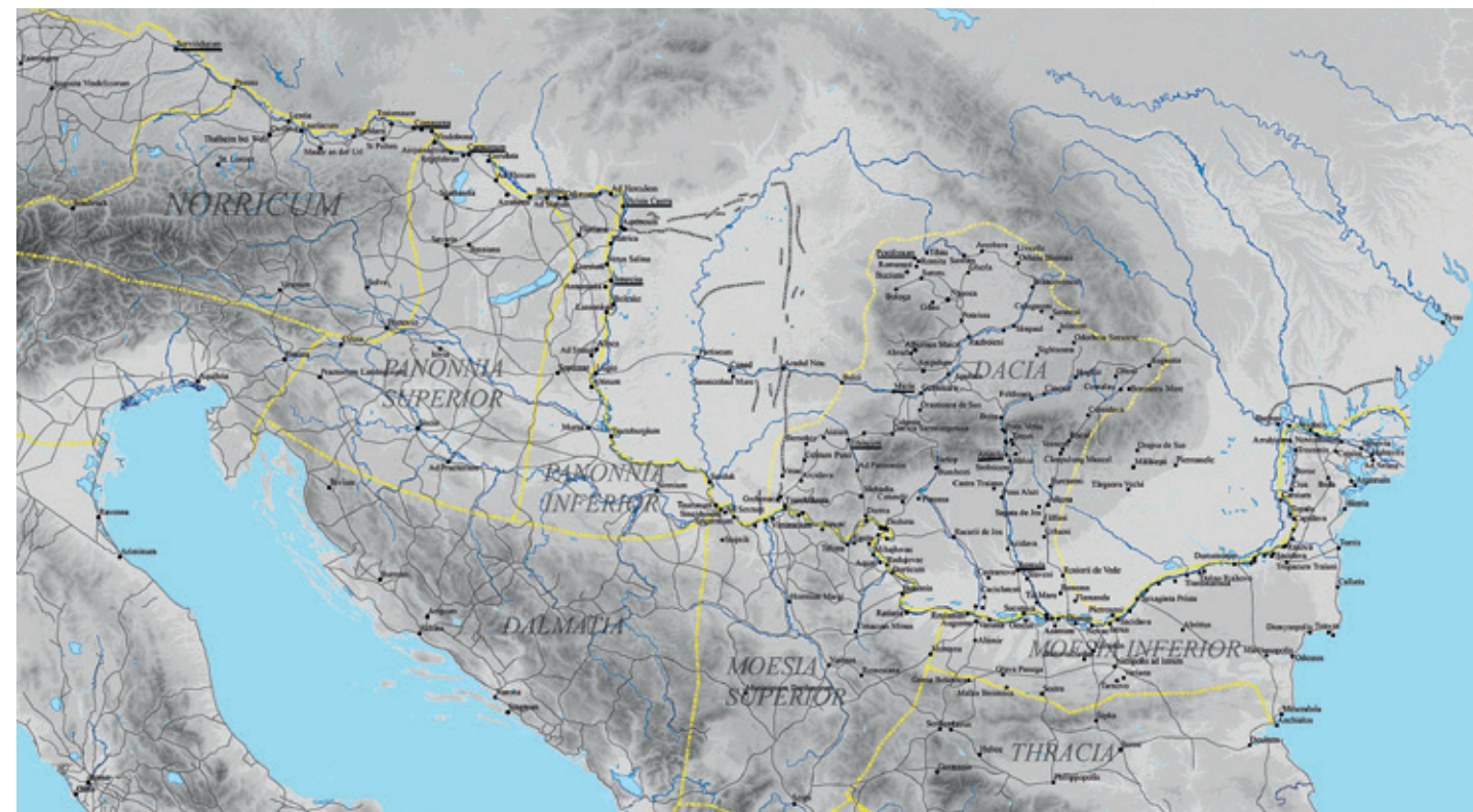
HARTA PROVINCIIILOR DUNĂRENE ÎN EPOCA PRINCIPATULUI

structurală a sistemului defensiv din Moesia, fapt care va marca începutul unei nou epoci pentru provinciile dunărene. Evenimentele din acești ani au demonstrat slăbiciunea sistemului defensiv roman, dar și pericolul reprezentat de creșterea puterii aliaților din nordul Dunării inferioare. Răspunsul Romei l-a constituit extinderea unui cordon de fortificații de-a lungul Dunării, din sudul Germaniei și până la gurile acesteia. A doua parte a epocii flaviene a fost caracterizată prin mutarea centrului strategic de gravitație în acest areal. Până în preajma campaniilor dacice, politica de stabilitate a zonei a avut ca fundament acordarea