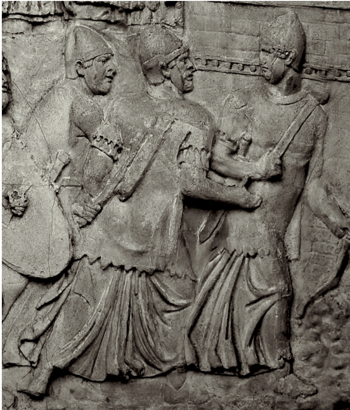
ARCAȘI SIRIENI – COLUMNA LUI TRAIAN SCENA 92 –MNIR

personală, procesiunile oficiate la care un soldat auxiliar participa în decursul unui an erau cuprinse într-o listă de festivaluri și ceremonii religioase, fapt exemplificat de Feriale Duranum – calendarul anului religios al cohors XX Palmyrenorum . Acesta cuprinde în linii generale o listă standard de ceremonii, nefiind un calendar specific unei anumite trupe. Individul nu se sustrage de la obligațiile publice, dar în plan personal, după cum am amintit, acesta putea opta pentru soluția cea mai apropiată de convingerile proprii. Chiar dacă soldații nu erau obligați să participe direct la procesiunile religioase, simpla prezență ca martor la aceste succesiuni de ceremonii trebuie să fi avut un anumit impact asupra