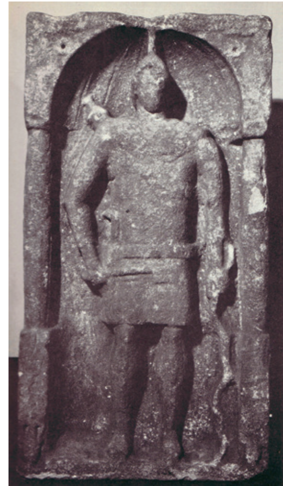
STELA UNUI ARCAȘ DIN COHORTS I HAMIORUM DE LA HOUSTEADS [DUPĂ WEBSTER 1985]

practic niciun tip de armă specifică arcașilor orientali care să nu fi fost descoperită în vreunul