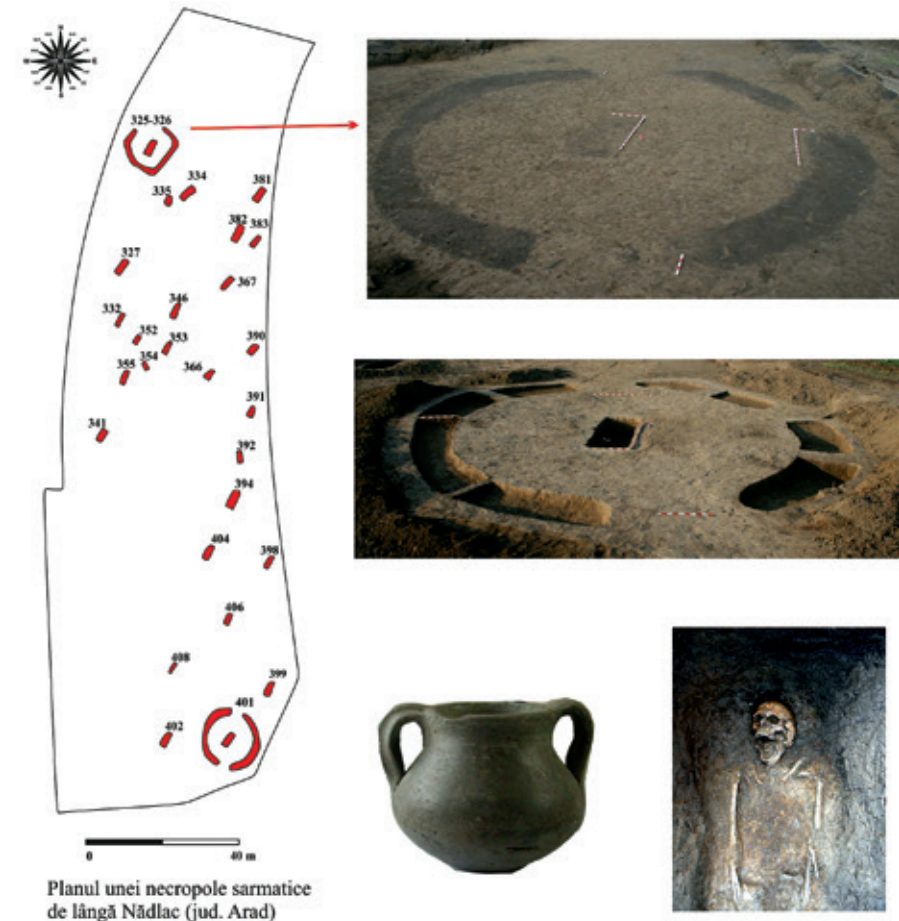
Planul unei necropole sarmatice de lângă Nădlac (jud. Arad)

Tibiscum și lumea ne-romană de dincolo de linia caștelor sunt un exemplu elocvent că limes -ul nu a reprezentat o barieră în circulația oamenilor și/sau a bunurilor. De asemenea, ca urmare a poziției acestor 'barbari' între trei provincii romane militarizate, ei au făcut parte, în mod inerent, din sistemul și din strategia imperială. Multitudinea de descoperiri romane, drumurile atestate în Barbaricum și piețele romane de pe limes sunt dovezi în acest sens. În același timp, vecinii sarmați au influențat la rândul lor dezvoltarea acestei zone de frontieră, selecția armatei, distribuția caștelor și au conferit frontierei vestice a Daciei un