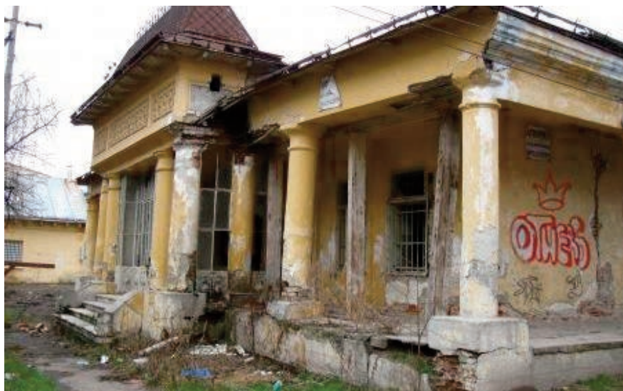
Una din imaginile jalnice ale clădirii ce ar fi trebuit să fie de mult Casa Memorială „Vasile Alecsandri”