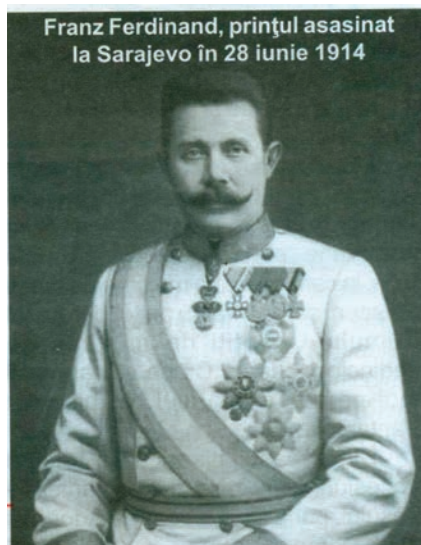
Franz Ferdinand, prințul asasinat la Sarajevo în 28 iunie 1914

care s-au pronunțat pentru un război preventiv împotriva Serbiei. Asasinatul de la Sarajevo a surprins și îngrijorat cercurile politice de la București și opinia publică românească. Regele Carol I i-a declarat, în ziua asasinatului, ministrului american din România că el poate aduce un război mondial. Cu toate că în cadrul Guvernului I.I.C. Brătianu, perspectiva războiului nu era