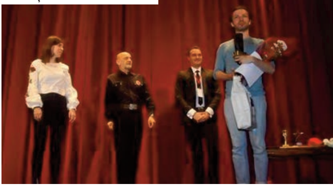
Secvență din Fest Monodrame

„Dragă Elena Sergheevna” este un spectacol reușit (are și un decor remarcabil, cu elemente și detalii expresive, imaginat de talentatul Răzvan Bordoș) și foarte actual. El va avea, cu siguranță, priză la public, care se va gândi, eventual, cât de neliniștitor poate fi faptul că, într-o societate coruptă, tot mai mulți tineri renunță la idealuri, la visuri frumoase, fiind gata de abjecte compromisuri, de înregimentare, și chiar de ticăloșie.