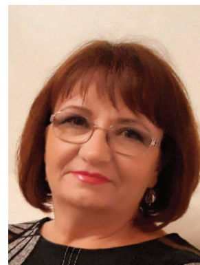
O să-i las pe stânci un vers

Văduvind cărări, de frunze, Prin păduri și munți și șes, Căutam în al meu mers, Atingerea lui pe buze.