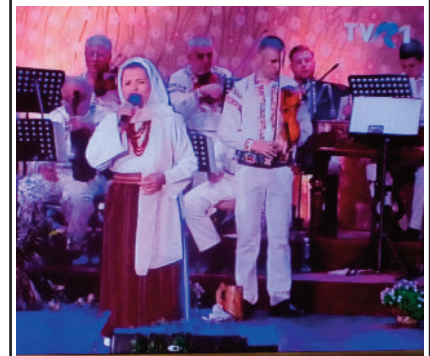
Artista Zinaida Bolboceanu