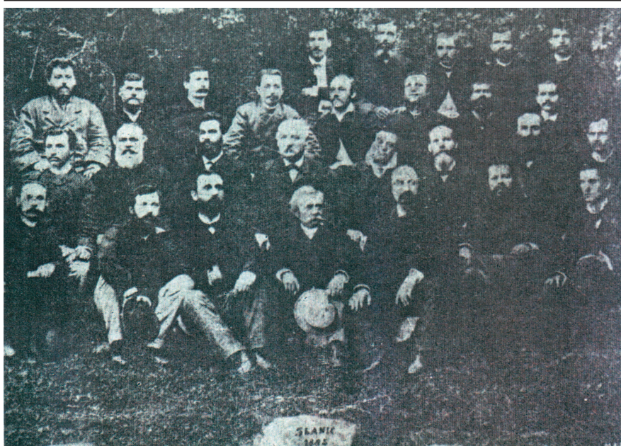
Ion Creangă alături de dascălimea aflată în stațiunea Slănic Moldova. De la stânga la dreapta, scriitorul – primul din rândul al doilea de sus (1885)

La Slănic, mișcat și îndemnat de peisajul naturii, Creangă s-a gândit că în această ambianță ar putea profita prietenul său și să dea frâu liber imaginației, spre a reda în creația proprie frumusețile naturii locale pe care cei doi o admirau. „Într-o dimineață, cum mergeam să începem cura la Izvorul 3, ne suirăm pe podețul de lemn peste pârâul Slănic, ca să privim la apa argintie, că de astă dată se umflase în urma unei ploi din ajun. Stând așa și contemplând valurile ușoare, ce se zbateau și năvăleau peste un zăgaz, ce era așezat înaintea podului, Creangă zise: „Te-am văzut că ai publicat multe poezii cu diferite subiecte. Dacă ești voinic fă niște versuri, pe podu ista și la priveliștea apei isteia așa de strălucitoare, și de mi-or plăcea îți plătesc deseară două pahare de lapte de capră.”