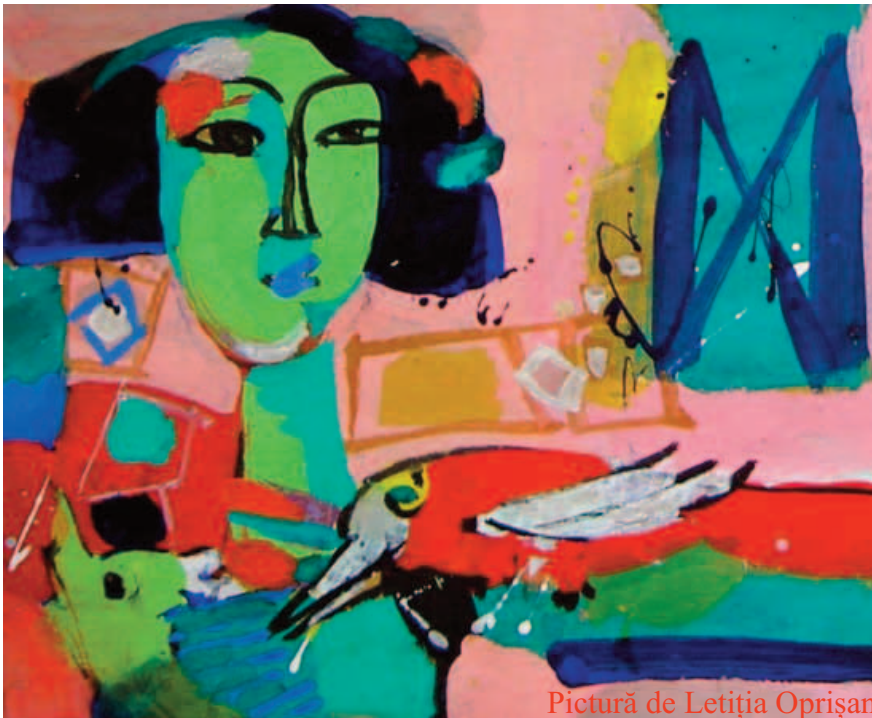
Pictură de Letiția Opreșan

Periodic al Ansamblului Folcloric „Busuiocul“ din Bacău • Anul V • Nr. 2 (24) • Martie-aprilie 2022