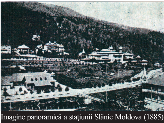
Imagine panoramică a stațiunii Sălcieștii Moldova (1885)

Nu știu dacă mulți diaconi vor mai fi având o burtă ca a lui Creangă, dar sunt sigur că dacă ar fi să se măsoare rangul și darul preoțesc, după puterea de înfălcare a stomacului, Creangă merită să fie cel puțin mitropolit.”