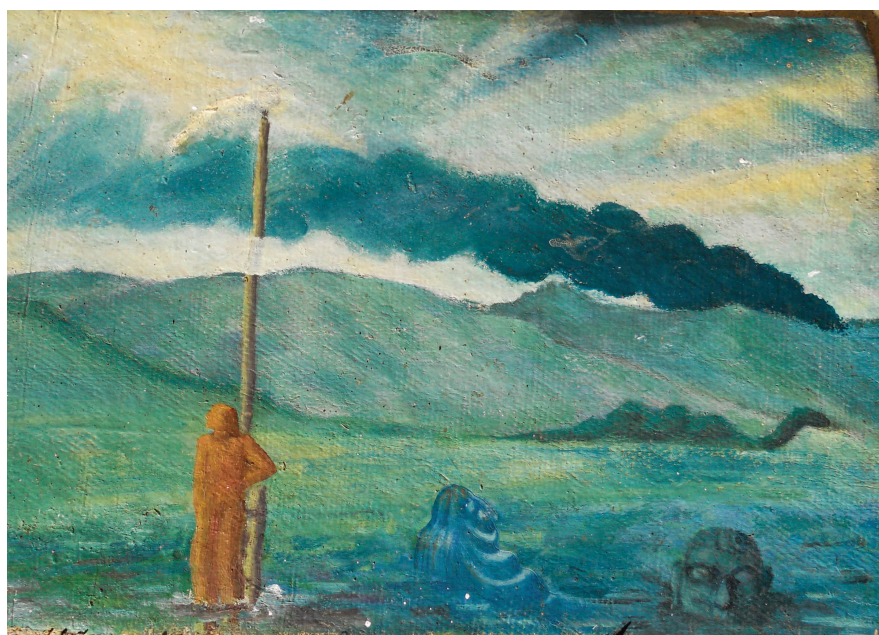
Infern , lucrare de Constantin RUSU-TITI