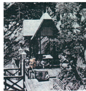
Imagine de epocă, cu unul din izvoarele de apă minerală de la Slănic, din anii când Creangă făcea tratament

- Burtă de diacon, dragul meu! Ei, ce vrei? N-am putut să-mi părăsesc obiceiul odată cu lepădarea potcapului.