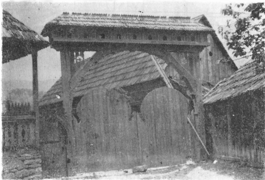
Fig. 2 — Poiana Uzului. Poartă țărănească românească