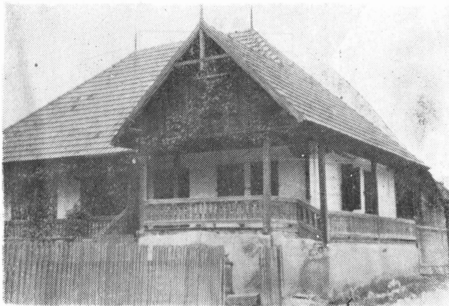
Fig. 1 — Poiana Uzului. Tip de casă românească