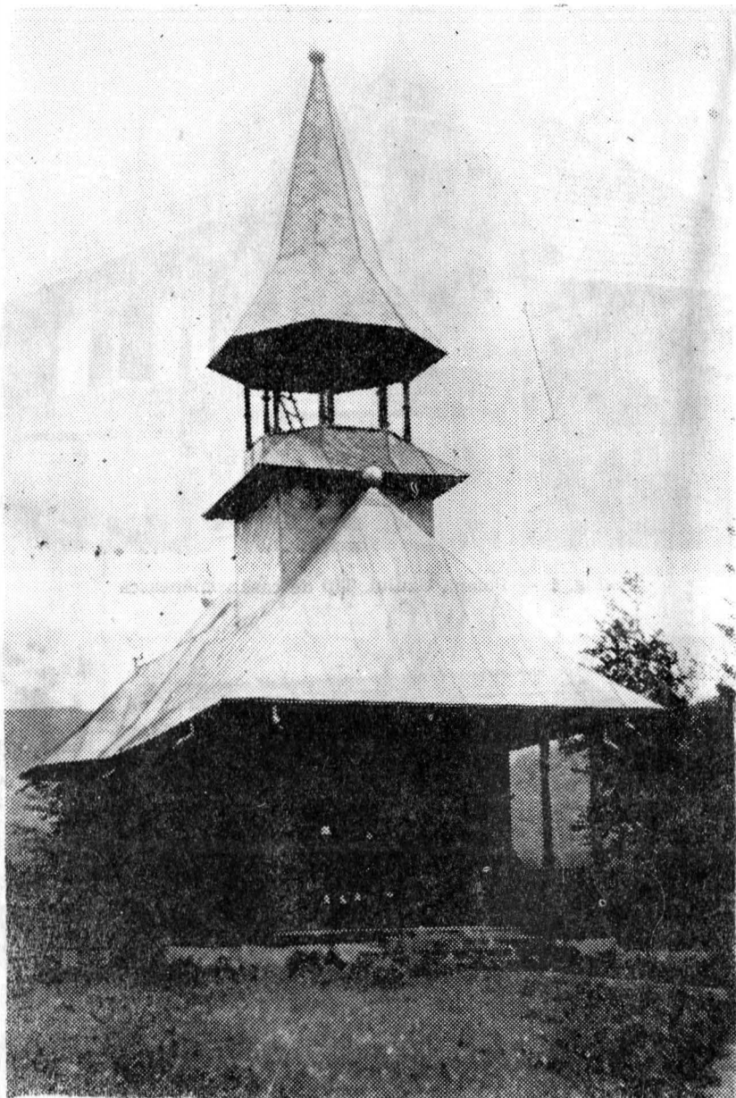
Fig. 3 — Poiana Uzului. Biserica satului