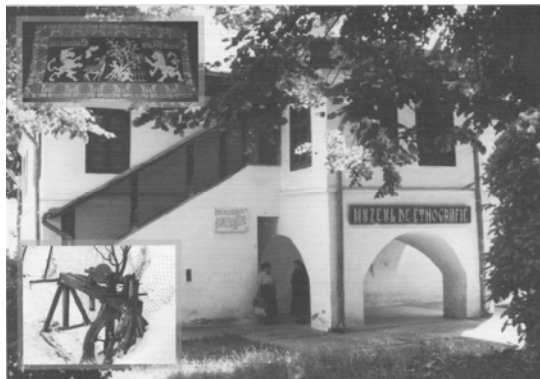
Casa „Manolachi Iorga” – „Saint-Georges”, Muzeul de etnografie (între anii 1989 – 2007)