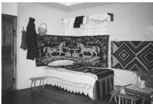
Imagine din interiorul Muzeului de Etnografie Botoșani (din perioada 1989 – 2007)