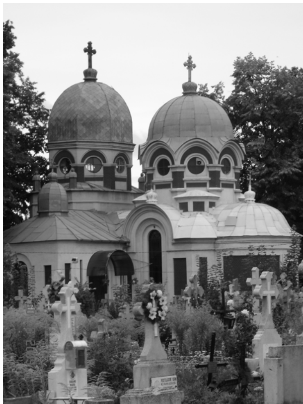
Biserica „Nașterea Maicii Domnului” (din cimitirul „Pacea” Botoșani, ridicată după proiectul ing. Alexandru (Alec) Saint-Georges