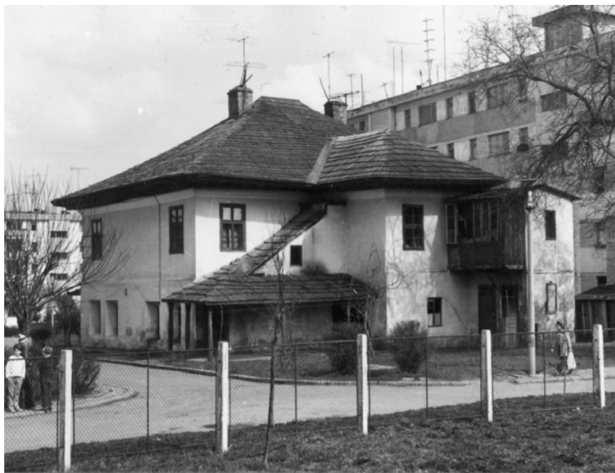
Casa „Manolachi Iorga” – „Saint-Georges (înainte de restaurare – an 1979; acoperită cu șindrilă)