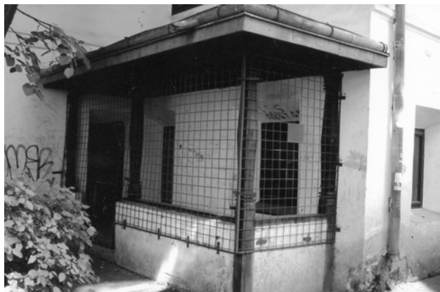
Casa „Manolachi Iorga” – „Saint-Georges”, în anul 2012