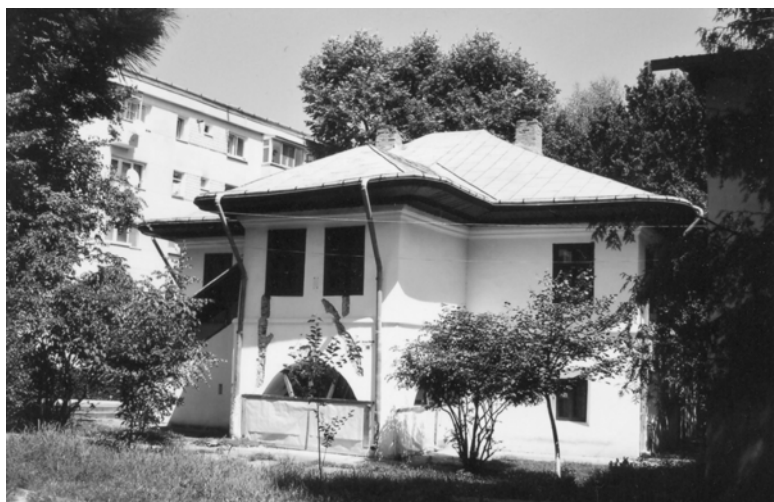
Casa „Manolachi Iorga” – „Saint-Georges” după desființarea expoziției etnografice în anul 2007