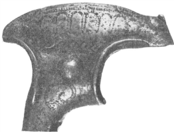
4. – Partea superioară a toporului de la Bălaia–Mă- răști cu detaliile de ornamentare ; circa 2/4 m. nat.