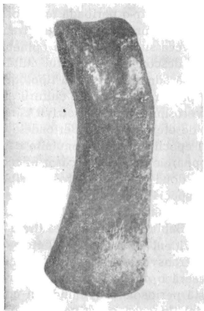
2. – Toporul descoperit la Osăbiți.

cunoscute și acceptate ca adevăruri absolute. Ne vom limita deci a scoate în evidență câteva observații care se desprind mai ales din cercetarea condițiilor de găsim în care au apărut topoarele menționate mai sus, cât și din unele trăsături tipologice. Astfel, ca o trăsătură comună a acestor trei topoare remarcăm caracterul rudimentar al finisării, după turnare, precum și calitatea inferioară a metalului din care au fost lucrate. Nu putem trece cu vederea nici faptul că, deși de dimensiuni mici greutatea lor variază între 300 și 600 grame.