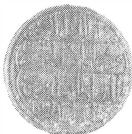
Fig. 1. Monede din tezaurul de la Mănăstirea Cașin