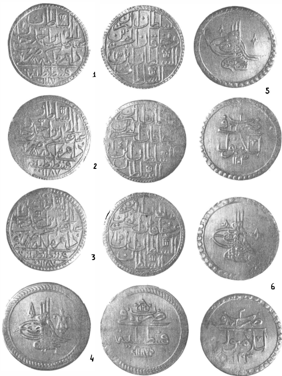
Fig. 3 — Monede din tezaurul de la Drăgești.