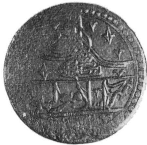
Fig. 5 — Monede din tezaurul de la Drăgești.