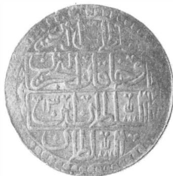
Fig. 6 — Monede din tezaurul de la Drăgești.