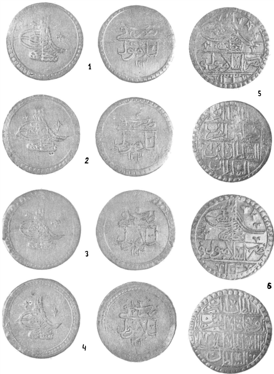
Fig. 4 — Monede din tezaurul de la Drăgești.