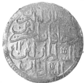
Fig. 2 — Monede din tezaurul de la Drăgești.