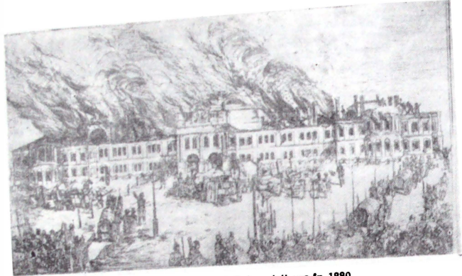
Fig. 2. — Iași, Palatul Ocîrmuirii ars în 1880. Fig. 2. — Jassy. Le Palais de Gouvernement incendié en 1880.