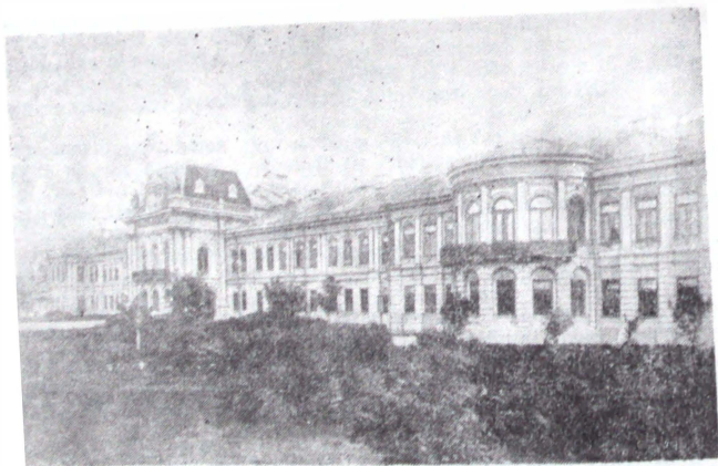
Fig. 3. — Iași, Palatul Ocîrmuirii la sfîrșitul secolului trecut. Fig. 3. — Jassy. Le Palais de Gouvernement à la fin du siècle passé.