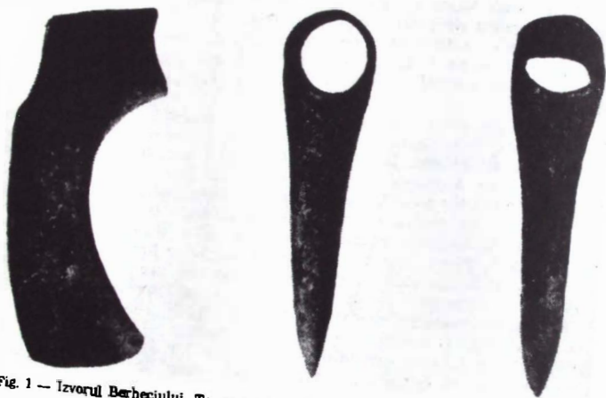
Fig. 1 — Izvorul Berheciului. Topor de aramă cu gaura de înmănușare transversală.

Al doilea topor este un celt de tip transilvănean, varianta răsăriteană. Are gura dreaptă, ovală în secțiune, cu bordura îngroșată și răsfrintă spre exterior. Talia este zveltă și tăișul arcuit. Toarta, ușor deformată, pornește din bordura găurii de înmănușare. Cele două fețe ale celtului sînt ornamentate cu triunghiuri ale căror laturi se unesc printr-o arcadă a fost rezervat un orificiu în formă de simbur de migdală, care servea la fixarea cozii. Fețele înguste sînt ornamentate cu două nervuri dispuse în unghi ascuțit. Celtul este acoperit pe întreaga suprafață de o patină de culoare verde închisă și prezintă pe alocuri defecte de turnare. Are următoarele dimensiuni: L = 11 \text{ cm} ; l \text{ tăiș} = 4,2 \text{ cm} ; diametrul găurii de înmănușare = 4,5 \times 4 \text{ cm} ; greutatea = 315 \text{ gr} . (fig. 3).