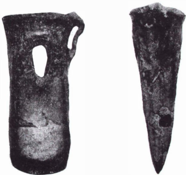
Fig. 3 — Celt din bronz. Izvorul Berheciului. (foto).