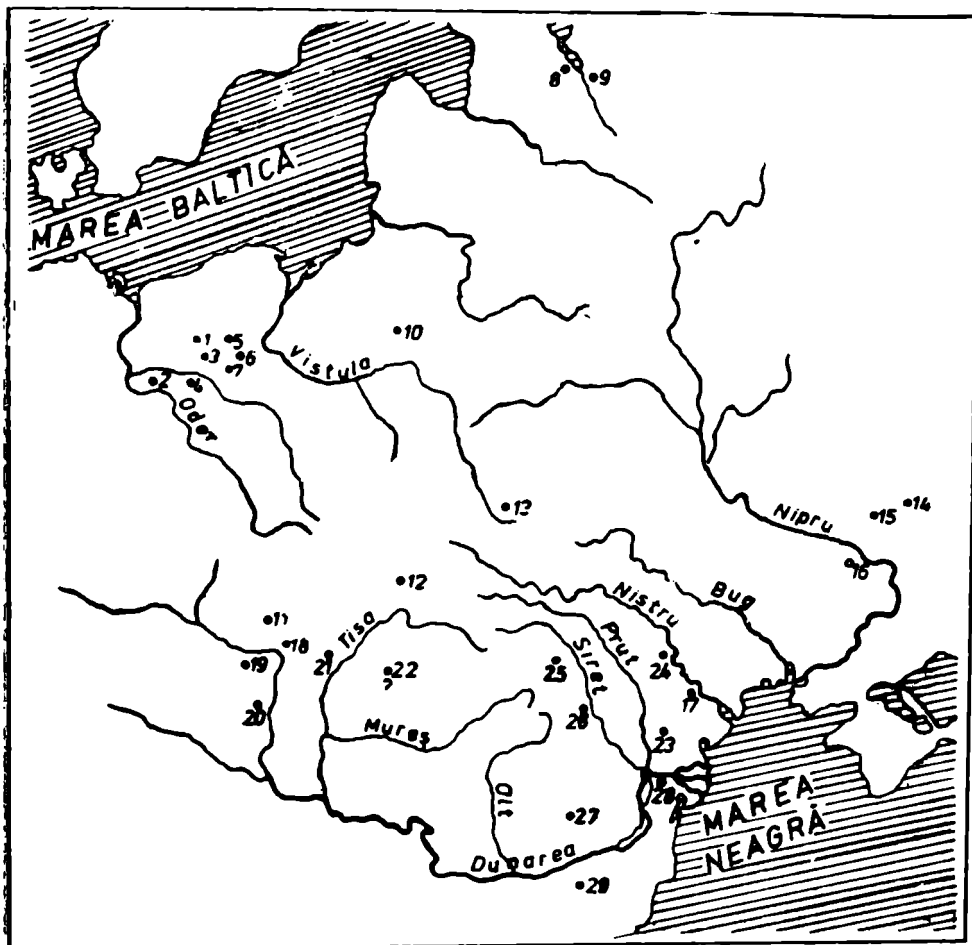
Fig. 3. — Harta localităților în care s-au descoperit cuțite cu volute : 1, Biskupin ; 2, Bonikovo ; 3, Bnin ; 4, Celadj Velka ; 5, Milici ; 6, Jukovițe ; 7, Gledzianowek ; 8, Gheorghi ; 9, Selto ; 10, Vasilika-Reviacika ; 11, Nitra ; 12, Hnojné ; 13, Plisniecko ; 14, Sukulink ; 15, Novotroițk ; 16, Kanevsk ; 17, Alcedar ; 18, Szob ; 19, Zillingtal ; 20, Kesztele ; 21, Alattyán ; 22, Șimleu Silvaniei ; 23, Brănești ; 24, Trebujeni ; 25, Lozna ; 26, Izvoare-Bahna ; 27, Bucov ; 28, Dinogetia ; 29, Madara. (1-9, 11-24, 29, după S. Šiška, W. Szymański, I. A. Rafalovici și R. S. Minasian ; 10, 25-28, date cule.se de I. Mitrea).