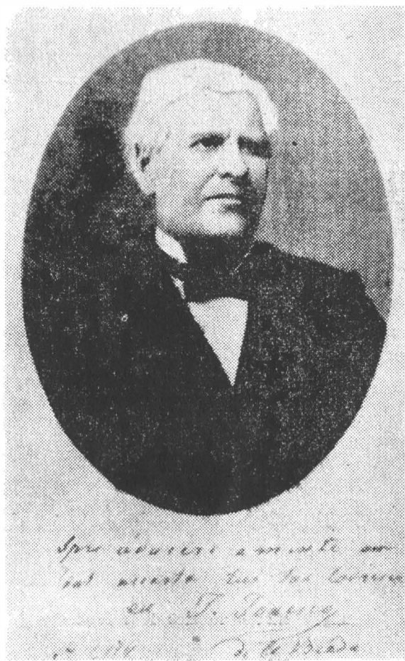
Fig. 1. Ion Ionescu de la Brad.