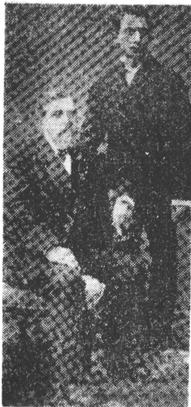
Fig. 3. Neculai Ionescu de la Brad și fiul său Eugen Ionescu.