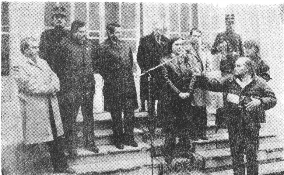
Fig. 5 Aspect de la festivitatea inaugurării Casei-Muzeu Vasile Alecsandri (15 noiembrie 1990)