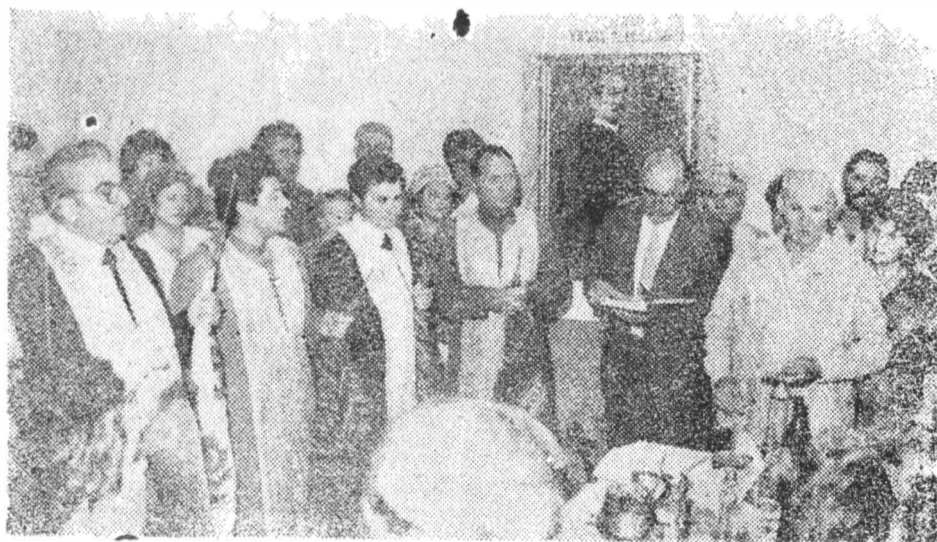
Fig. 2 Secvență de la serviciul religios închinat comemorării poetului și sfințirii Casei-Muzeu „Vasile Alecsandri“ (22 august 1990)