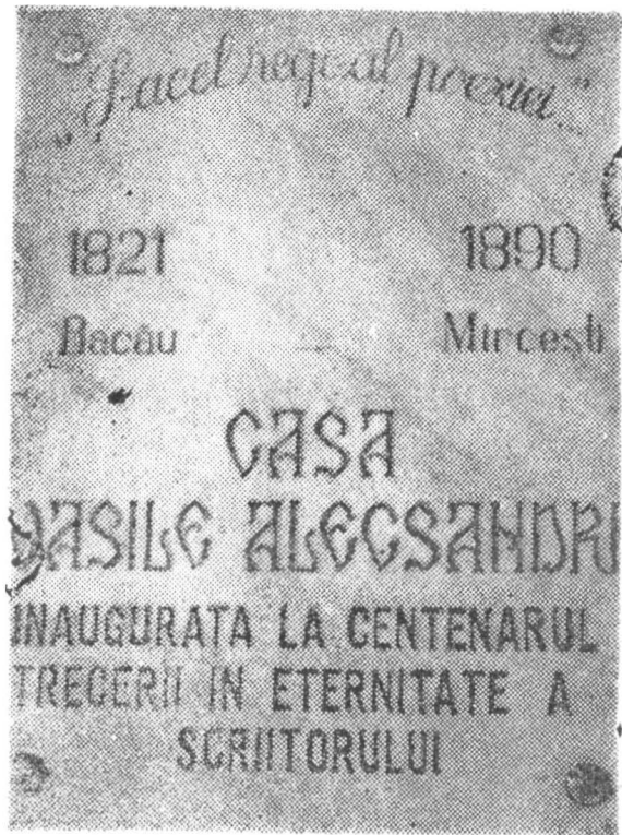
Fig. 3 Placa memorială așezată pe clădirea din strada George Apostu (fost Alexandru cel Bun) nr. 3, dezvelită în cadrul zilelor „Vasile Alexandru” (Bacău, 14-16 noiembrie 1990)