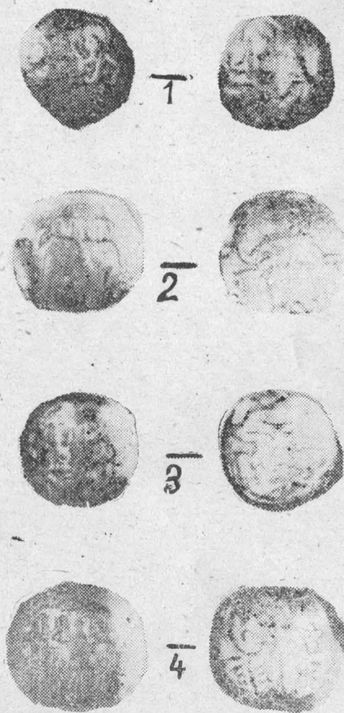
Fig. 1. Monede emisiuni ale Imperiului bizantin de la Niceea de Ioan al III-lea Ducas Vatatzes (1222—1254).