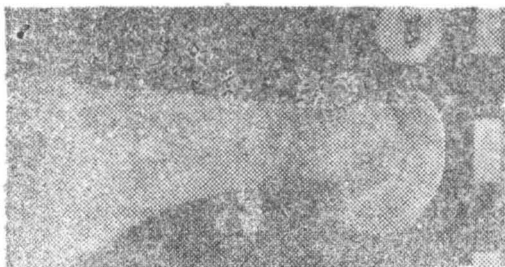
1/1. Bos taurus — metatars. 1/2. Sus scrofa domest. — fragment demandibulă. 1/3. Homo sapiens — metatars I. 1/1. Bos taurus — metatars. 1/2. Sus scrofa domest. — fragment de mandibule. 1/3. Homo sapiens — metatars I.