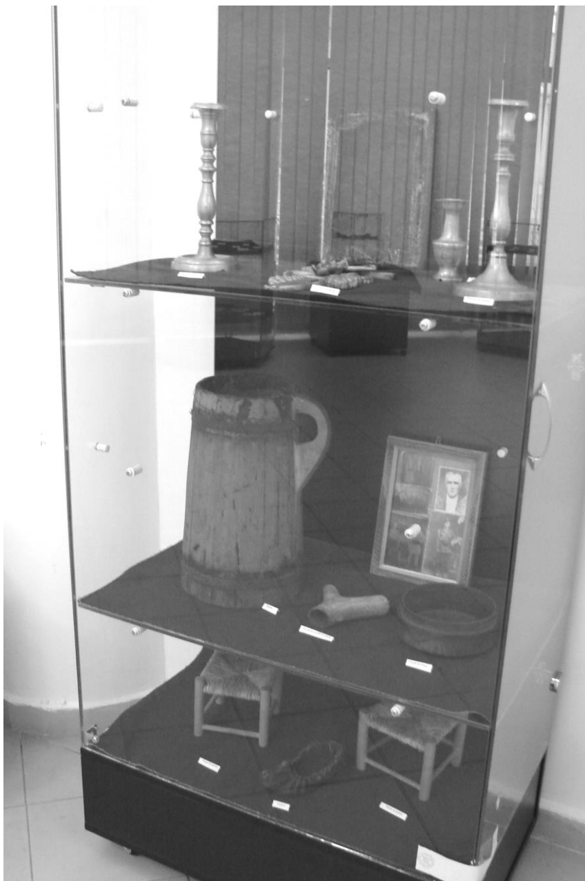
Imagine din expoziție