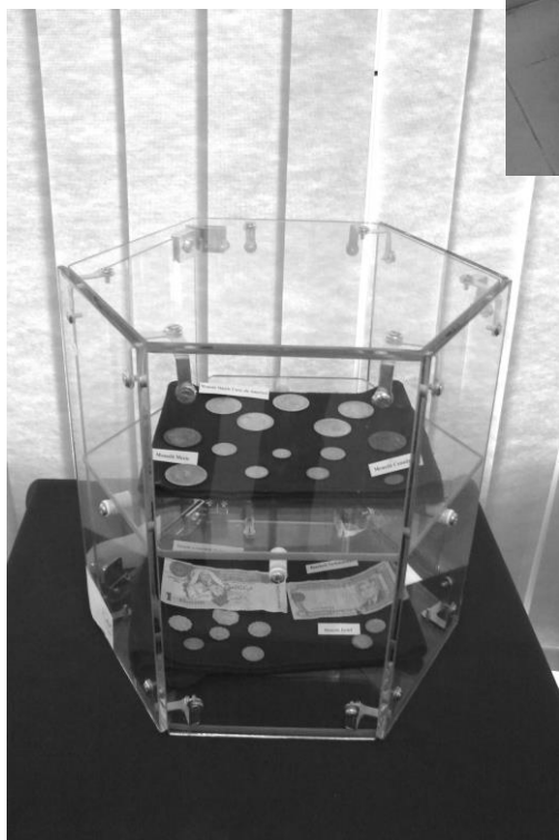
Imagini din expoziție