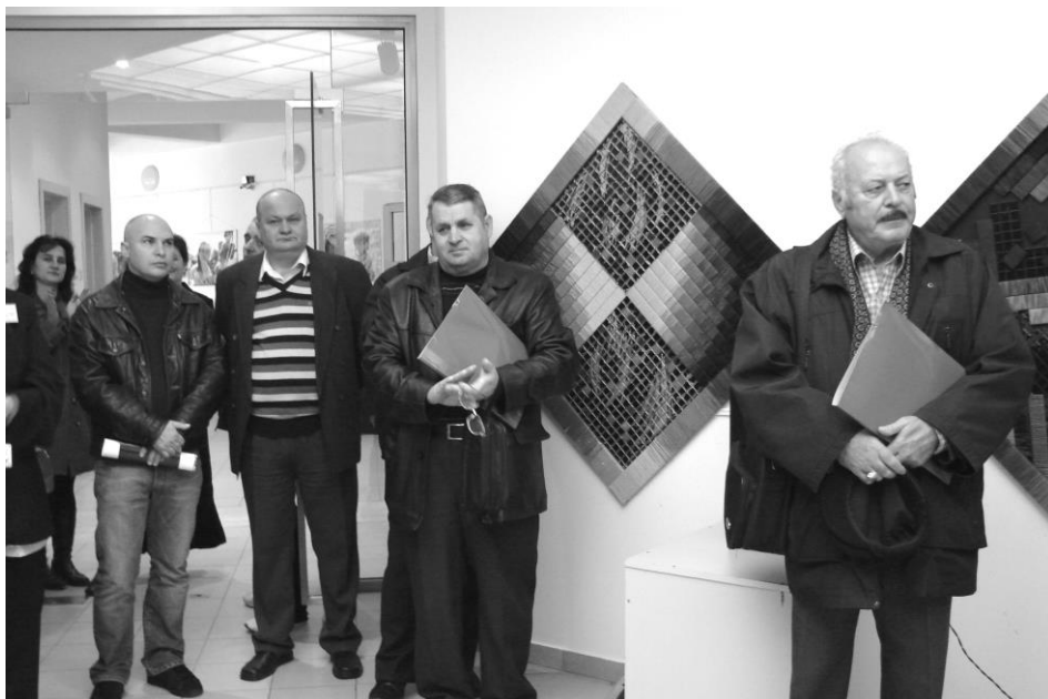
Imagine de la vernisajul expoziției (donatorul în mijloc)