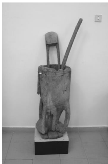
Imagini din expoziție