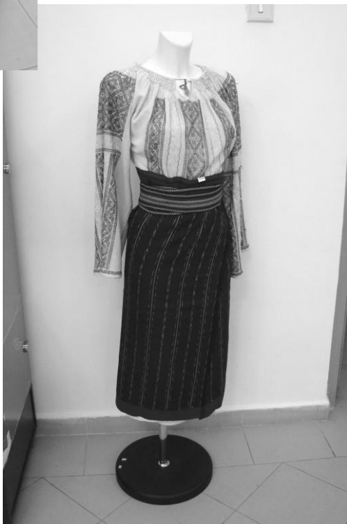
Imagini din expoziție