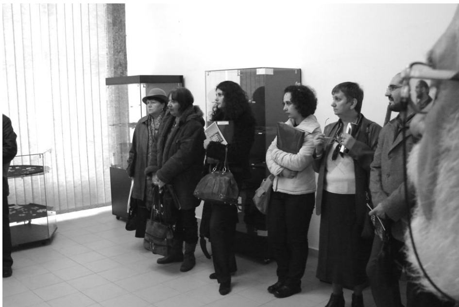
Imagine de la vernisajul expoziției (sus) și din expoziție (jos)