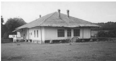
Casa Morțun din Dămieniști