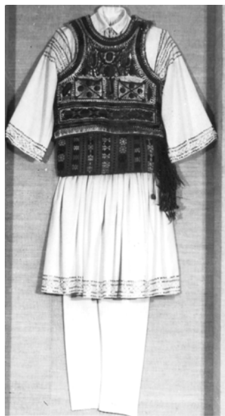
Costum de mire