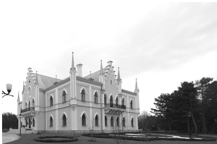
Imagine de ansamblu a Palatului „Al.I. Cuza”