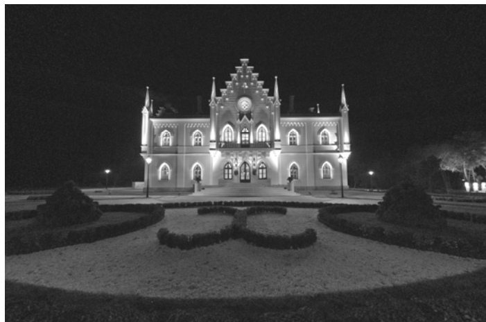
Palatul „Al.I. Cuza” luminat seara