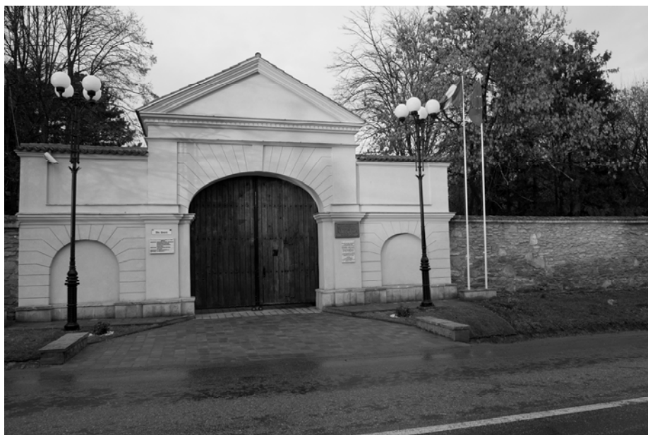
Poarta principală de intrare

Palatul de la Ruginoasa este un punct turistic important și foarte vizitat, nu numai prin ceea ce a însemnat cândva familia Cuza, cât și pentru ceea ce înseamnă astăzi pentru noi: un pios loc de pelerinaj, luminat de amintirea celui care a fost Alexandru Ioan Cuza, simbol viu al Unirii din 1859. Orice comunitate își croiește drumul raportându-se la trecut, cu repere sigure, cu valori incontestabile.