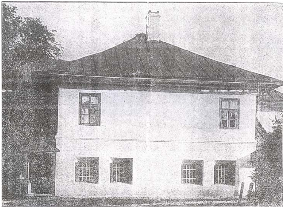
Casa „Manolachi „Iorga” – devenită „Saint-Georges” pe la sfârșitul sec. al XIX-lea (foto din Neamul românesc literar (aflată la 200 m de Biserica „Cuvioasa Parascheva”)