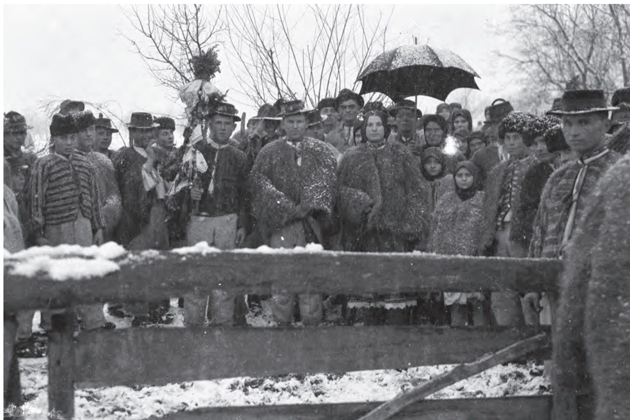
Grup de răcșeni în port de iarnă, cu steagul de nuntă, 1937.