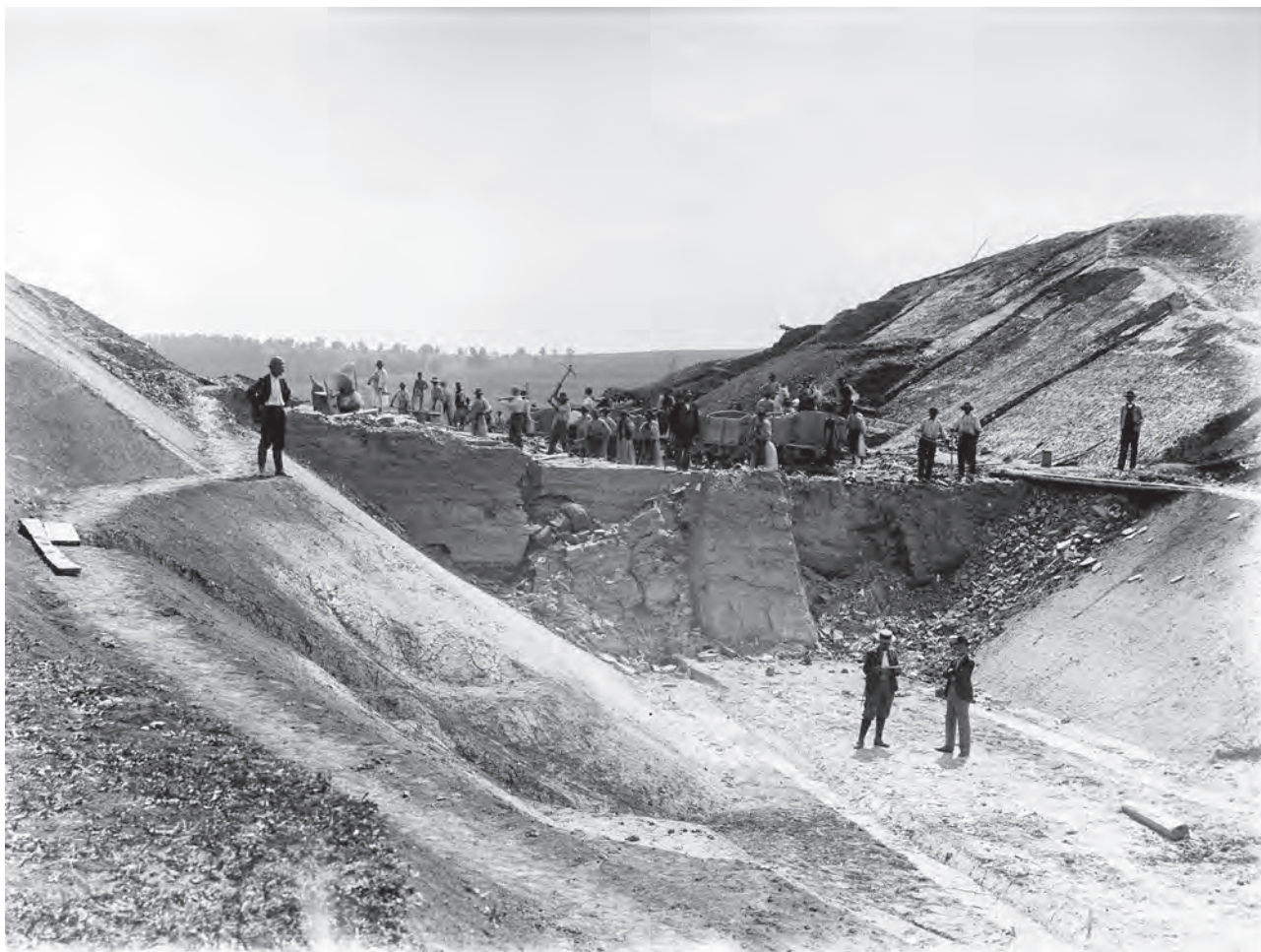
Tăietura adâncă de 10,5 m, situată la cumpăna apelor dintre Apold și Brădeni (MIS).