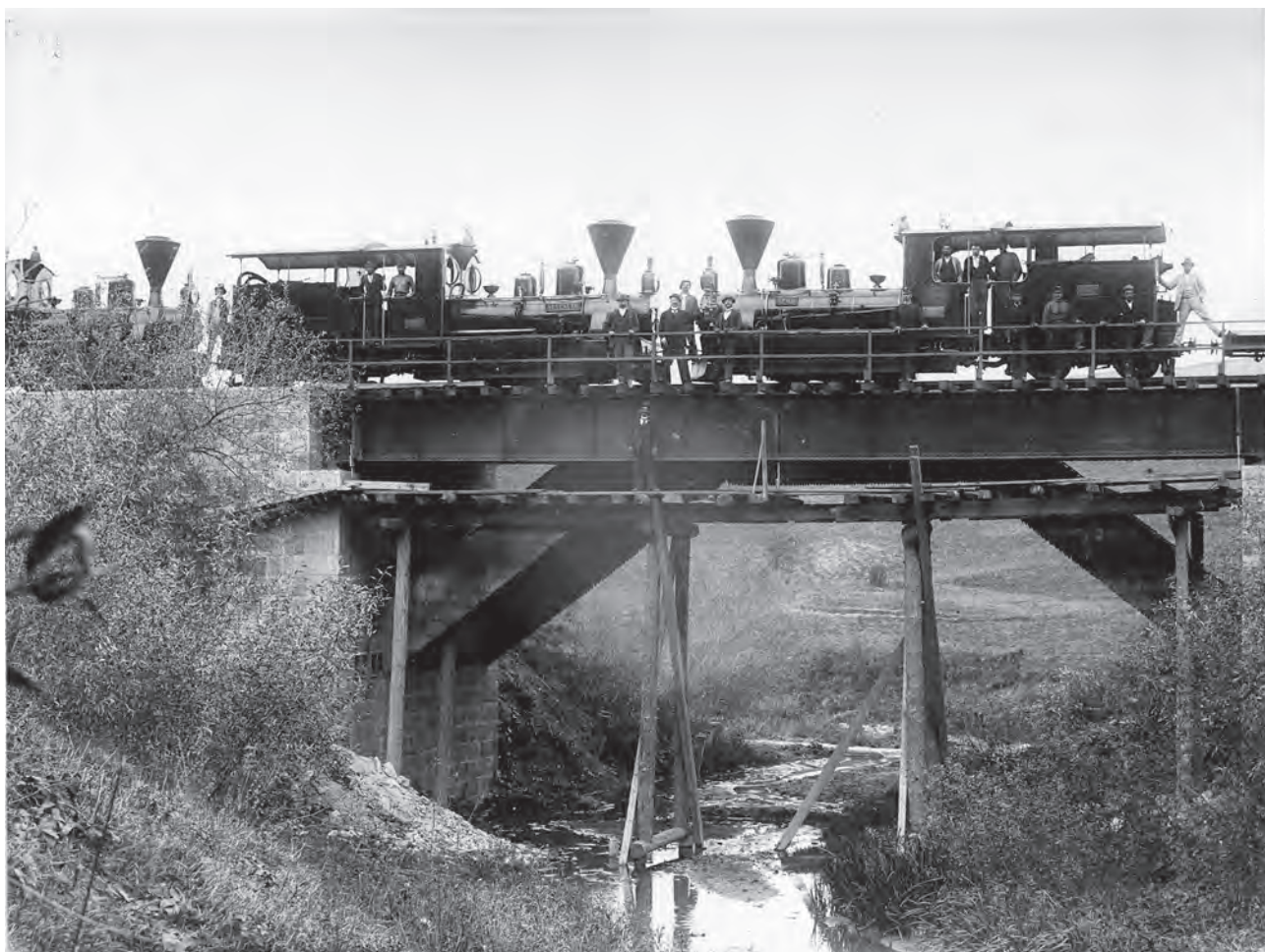
Proba de rezistență a celui de al doilea pod din fier, construit peste Valea Șaeșului, 21 octombrie 1896 (MIS).