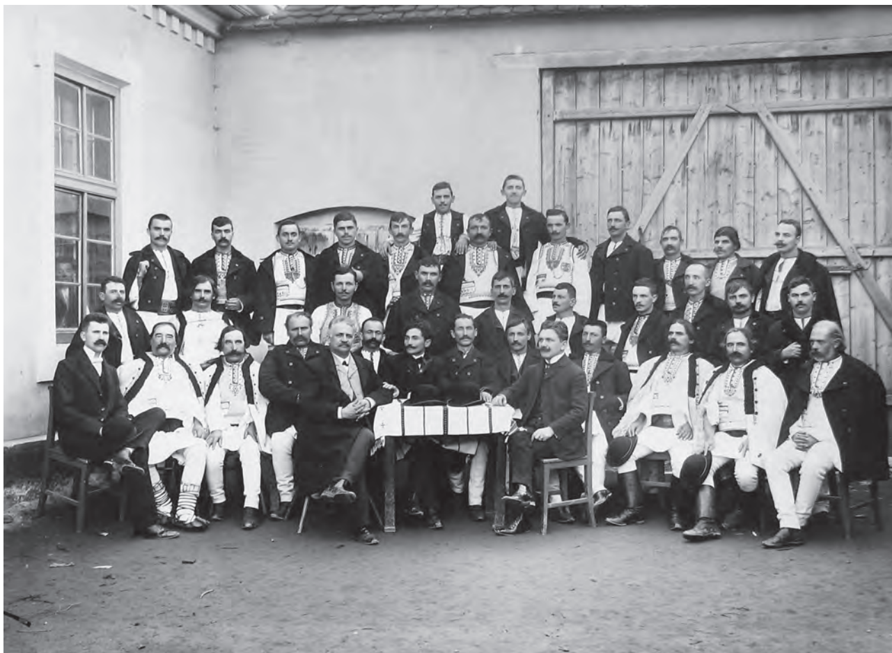
Bărbați români din Poiana Sibiului.