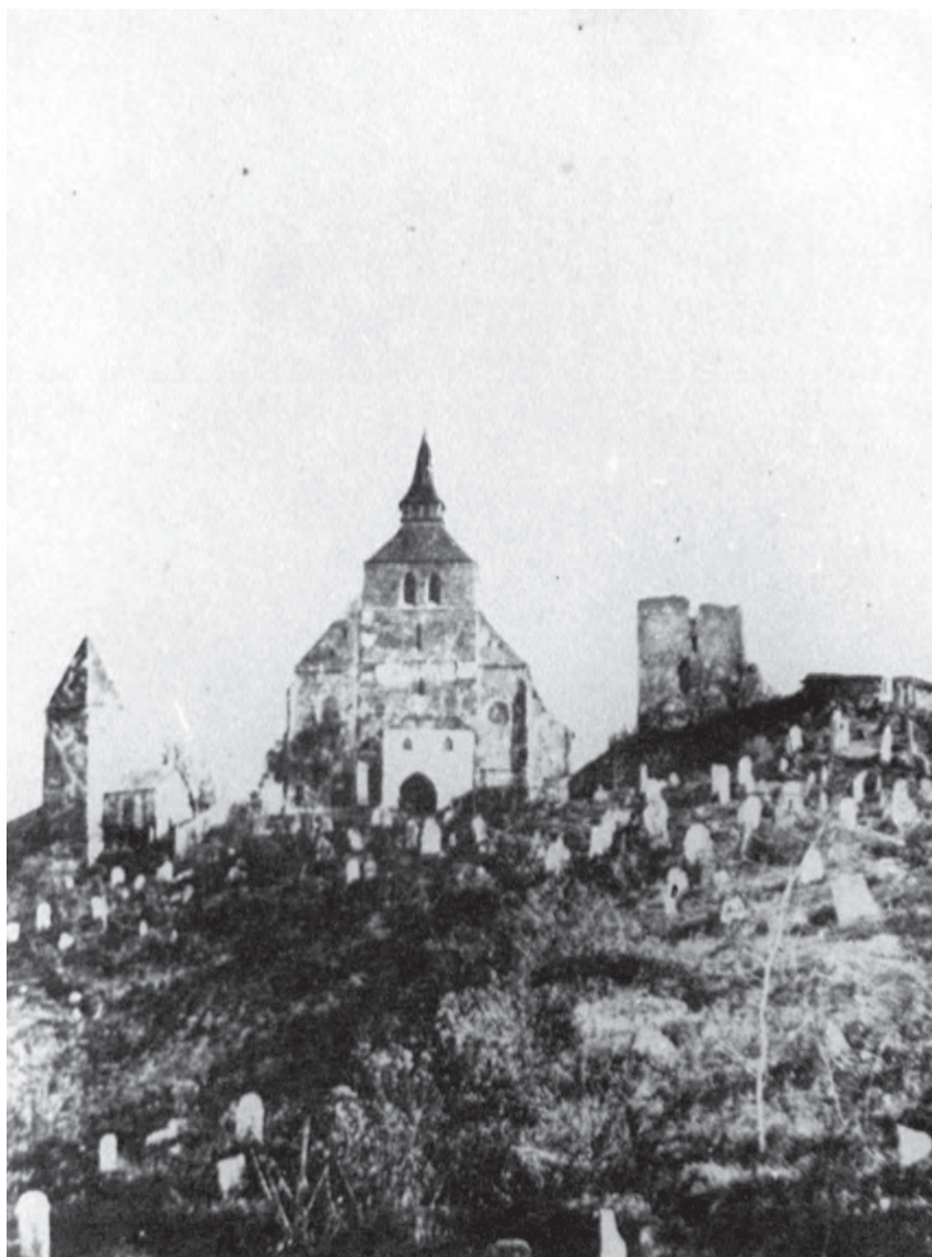
Sighișoara, cca. 1860 (MIS).