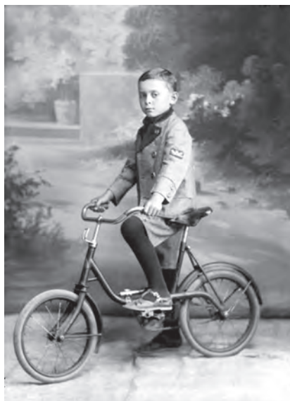
Portrete de copii. Prelucrări digitale după clișee pe sticlă (MJIAMM)