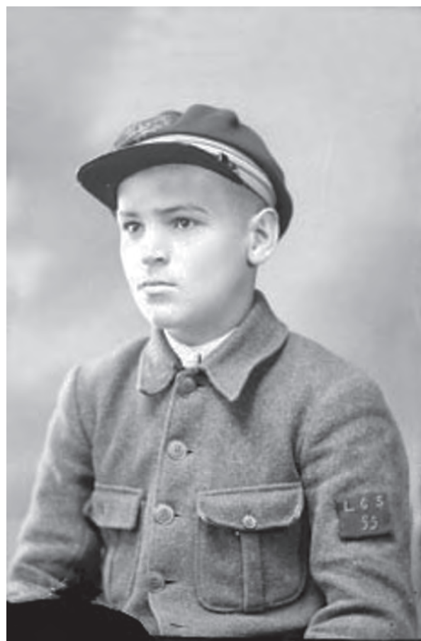
Elevi ai Liceului Gheorghe Șincai din Baia Mare. Prelucrări digitale după clișee pe sticlă (MJIAMM)