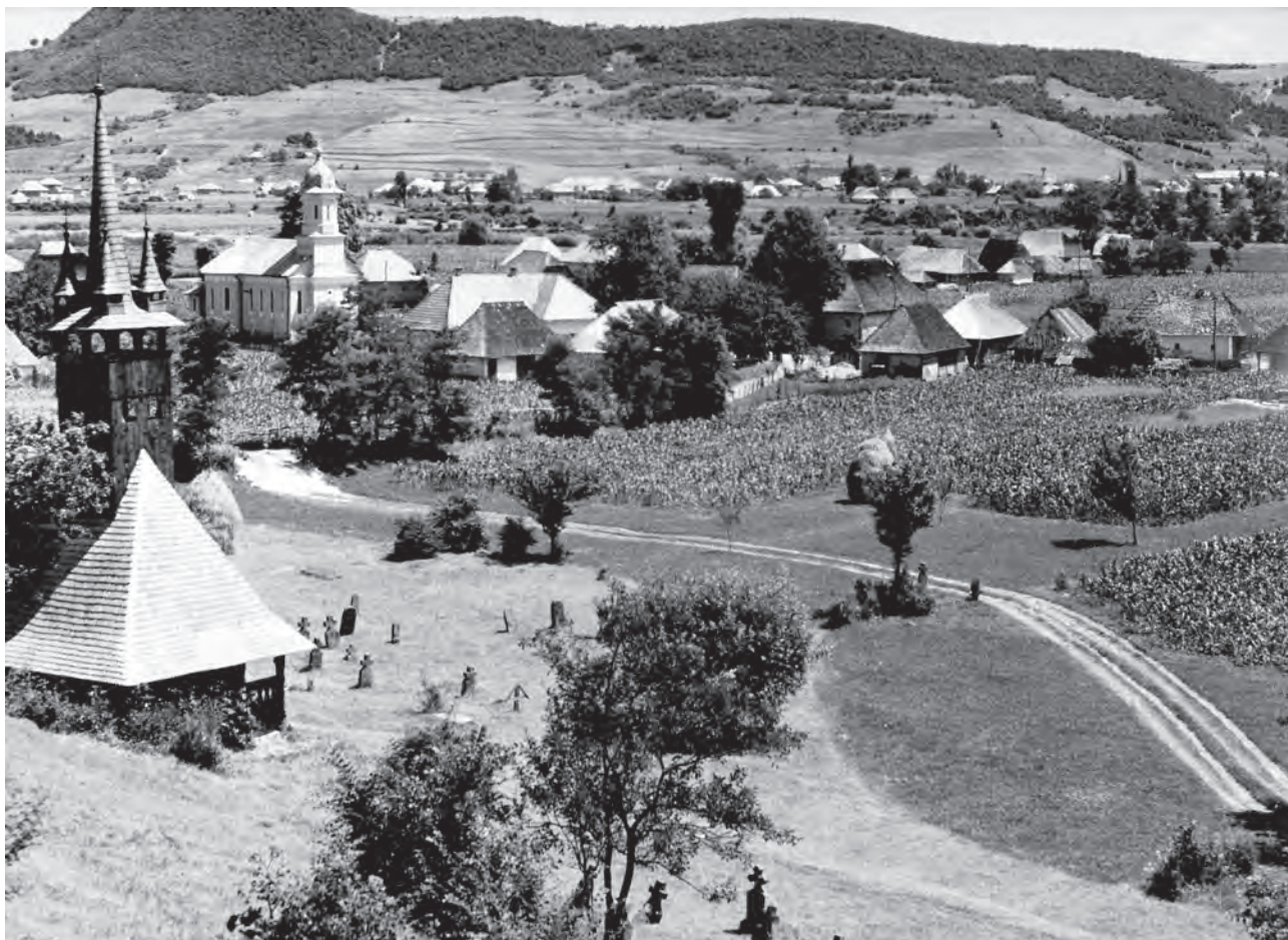
Peisaj din Răzoare, Țara Lăpușului.