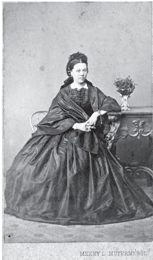
Portret de femeie (MoO)