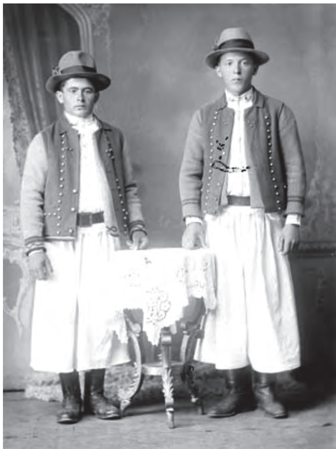
Tineri îmbrăcați în costume populare. Prelucrare digitală după un clișeu pe sticlă (MJIAMM)