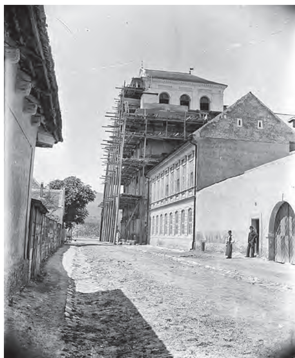
Alba Iulia, Biblioteca Batthyaneum. Fotografie realizată în 1912, în timpul lucrărilor de restaurare (MNUAI)