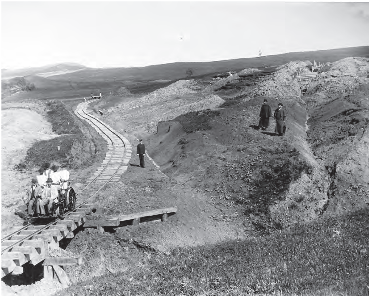
Alunecarea de teren din spatele zonei Zwiebelgraben de pe Dealul Apoldului (MIS).