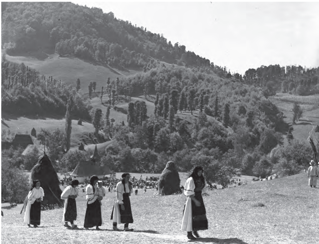
Pelerini plecând de la Mănăstirea Strâmbu. Fotografie realizată la 14 septembrie 1943; fotograf I. G. Andron (MJSM).