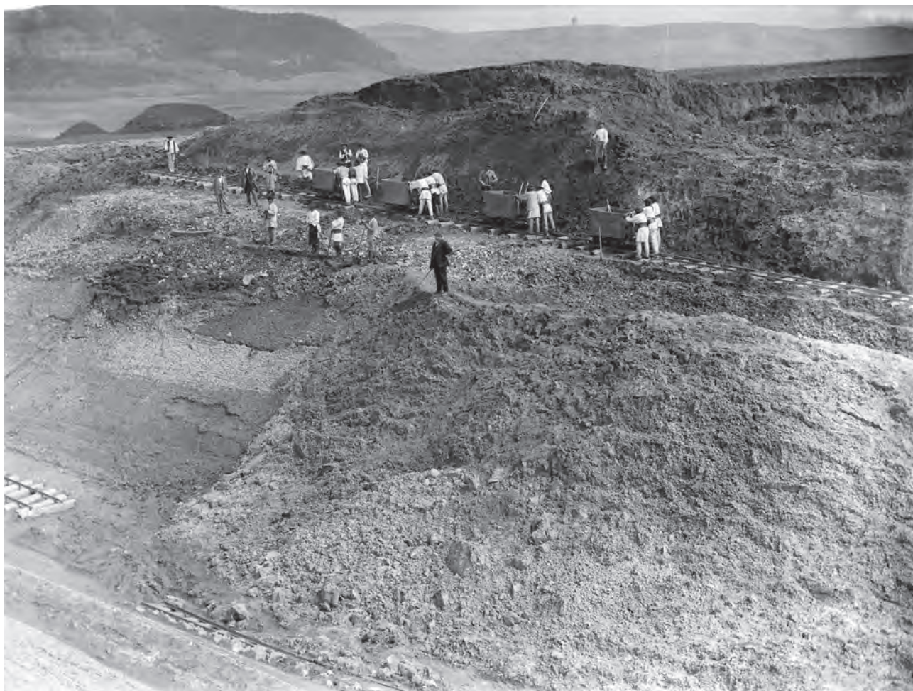
Alunecările de teren de pe marea pantă de la cumpăna apelor, văzute dinspre vest (MIS).