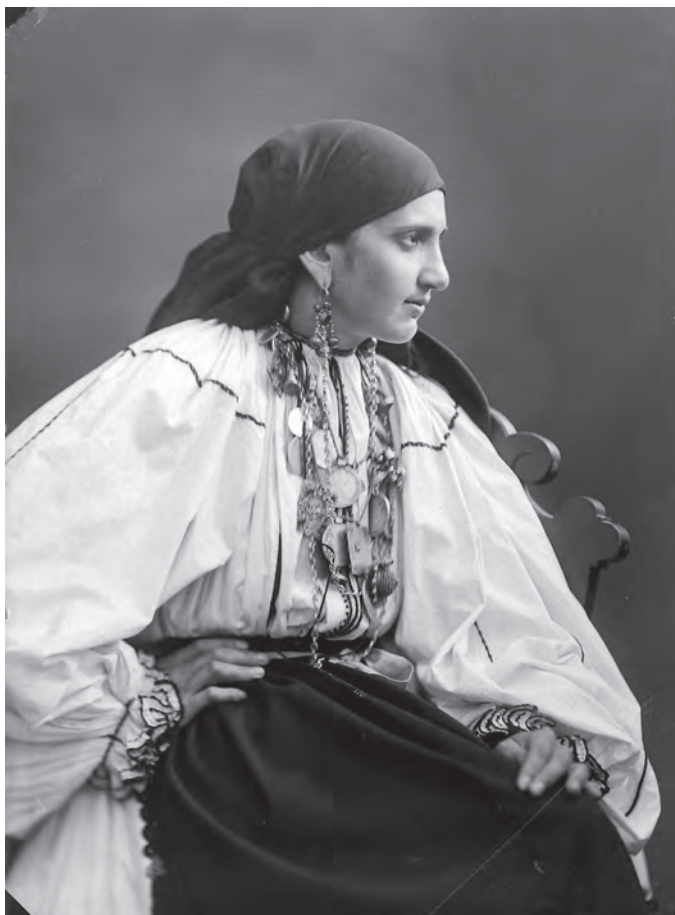
Portret de femeie îmbrăcată în costum popular.