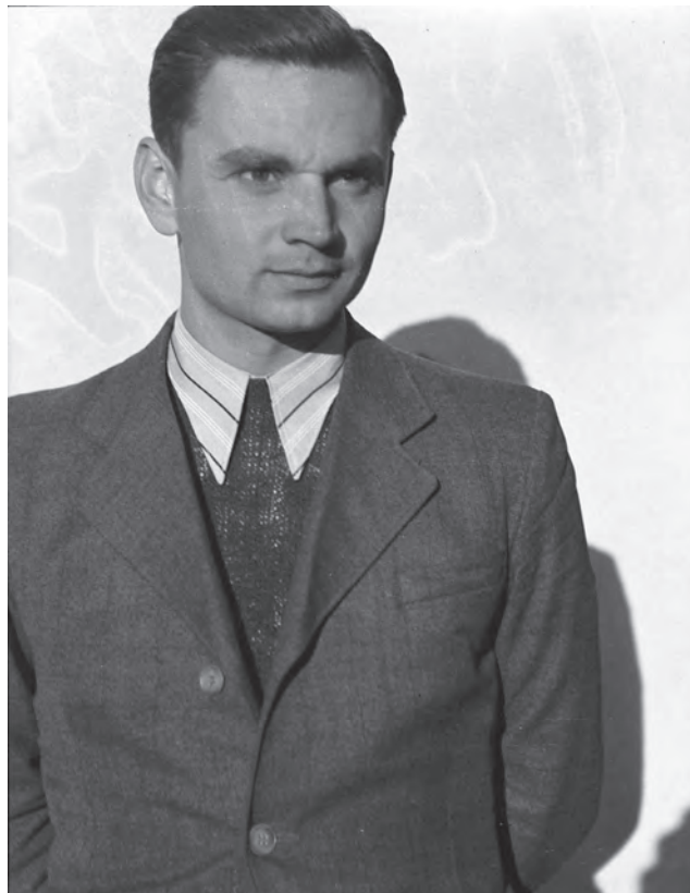
Ioniță G. Andron (1917–1989) (MJSM)