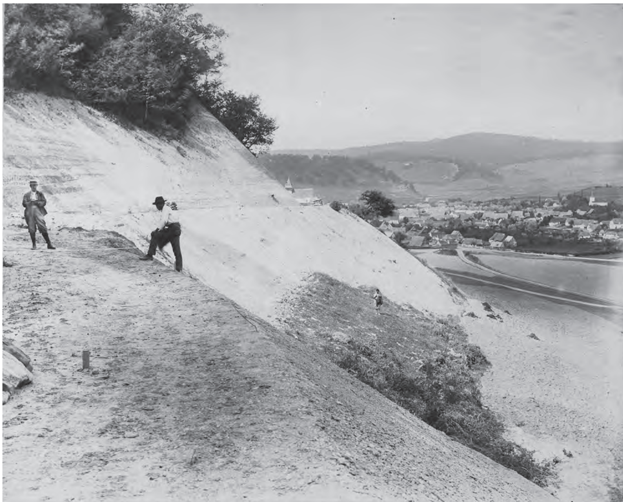
Rambleul căii ferate cu înălțimea de 14,5 m, situat în spatele satului Apold (MIS).