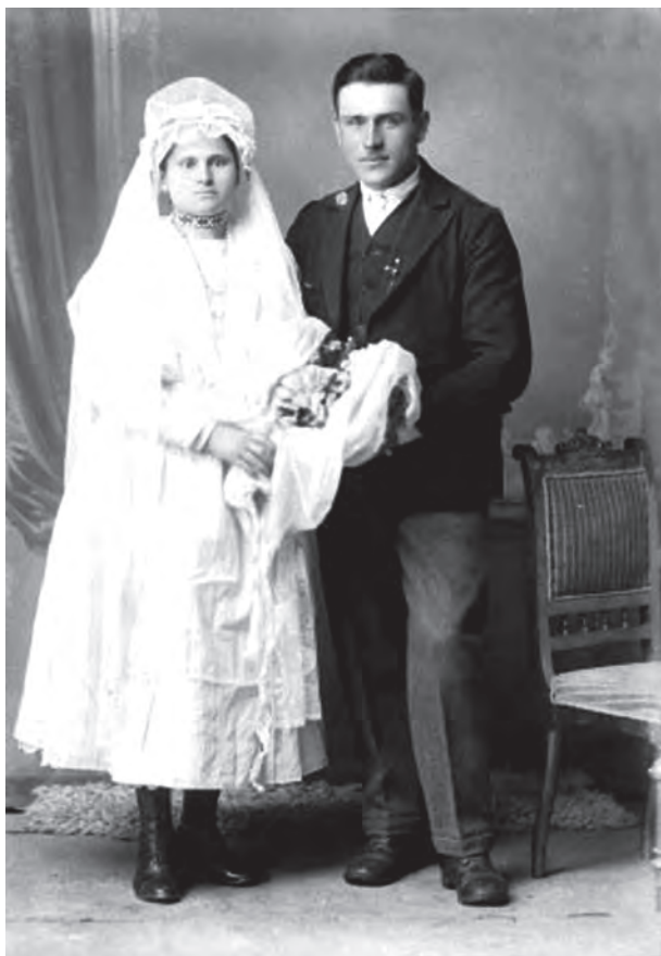
Portret de cununie. Prelucrare digitală după un clișeu pe sticlă (MJIAMM)