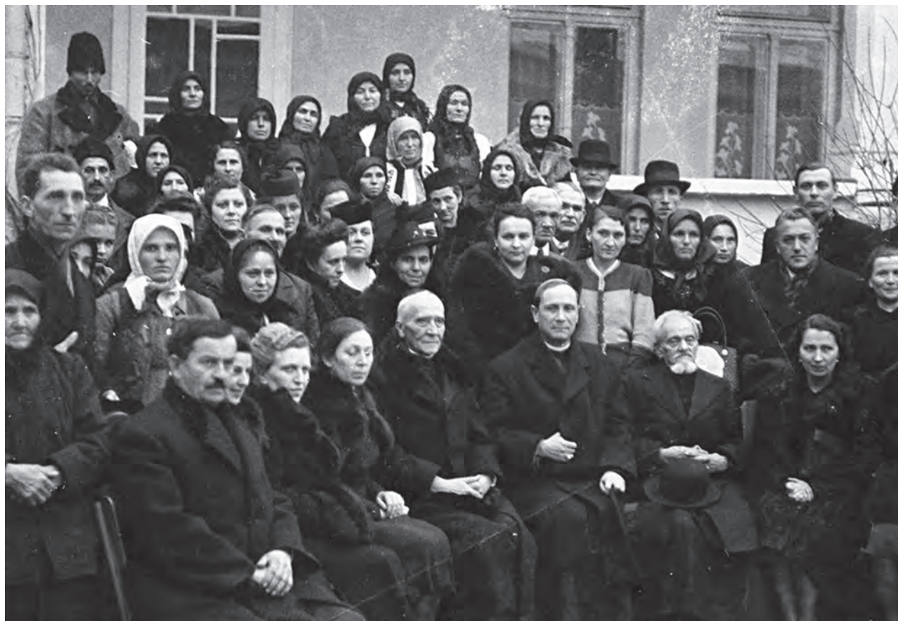
Iuliu Hossu , episcop greco-catolic de Gherla, în mijlocul unui grup de preoți și credincioși; fotograf I. G. Andron (MJSM).