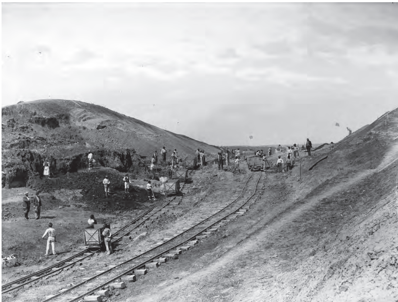
Tăietura în adâncime de 10,5 m de la cumpăna apelor dintre Apold și Brădeni (MIS).