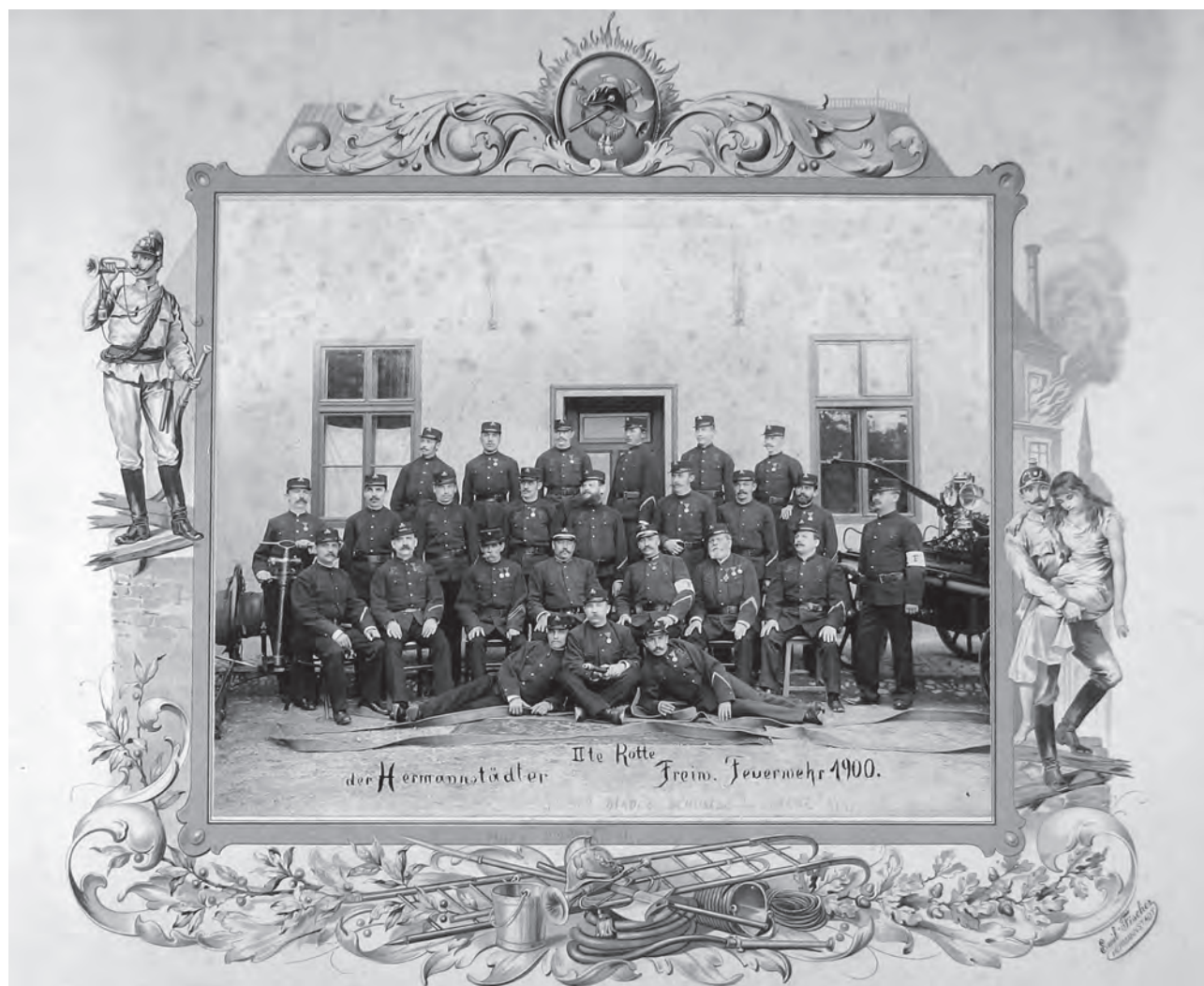
Membri ai Corpului de Pompieri Voluntari din Sibiu (fotografie realizată în 1900).