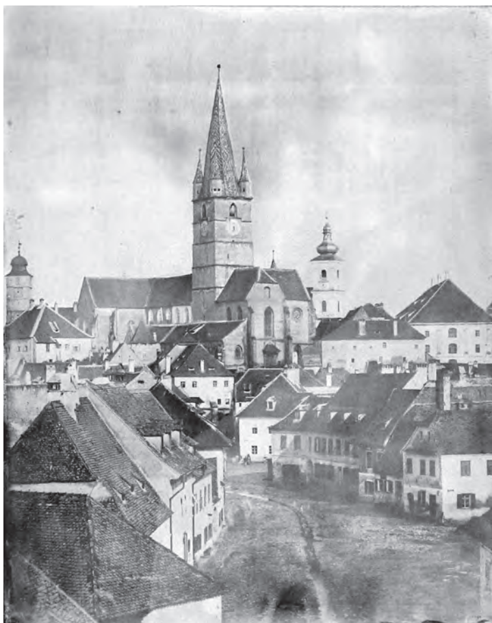
Sibiu, azi Strada Turnului. În plan secundar apare Biserica Evanghelică.