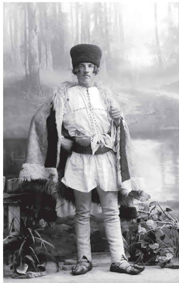
Portret de bărbat îmbrăcat în costum popular.