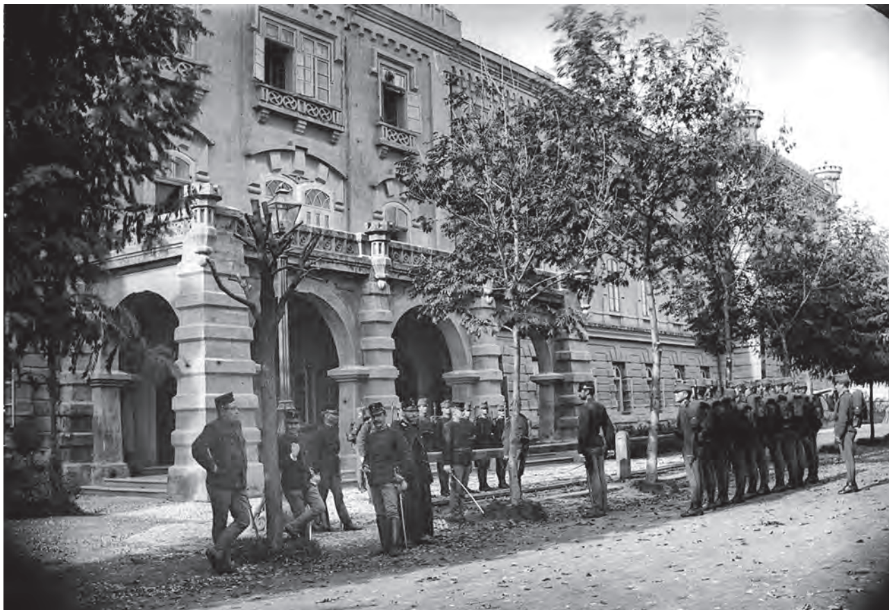
Schimb de gardă în fața clădirii Babilon. Fotografie realizată la sfârșitul secolului al XIX-lea