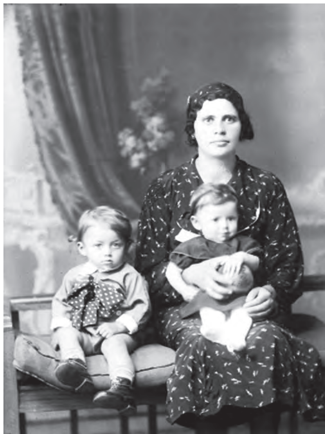
Mamă și copii. Prelucrare digitală după un clișeu pe sticlă (MJIAMM)