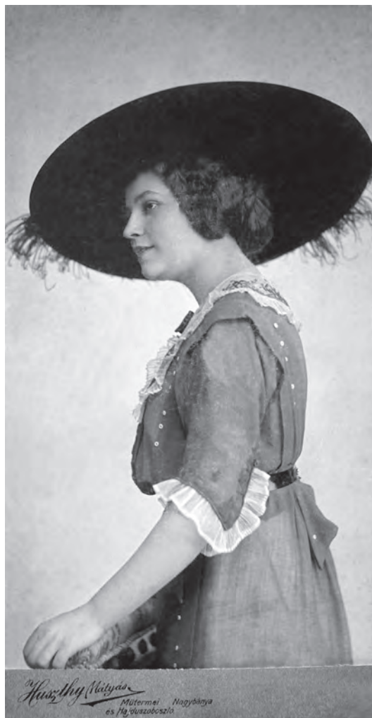
Portret de femeie îmbrăcată în costum orășenesc (MJIAMM)