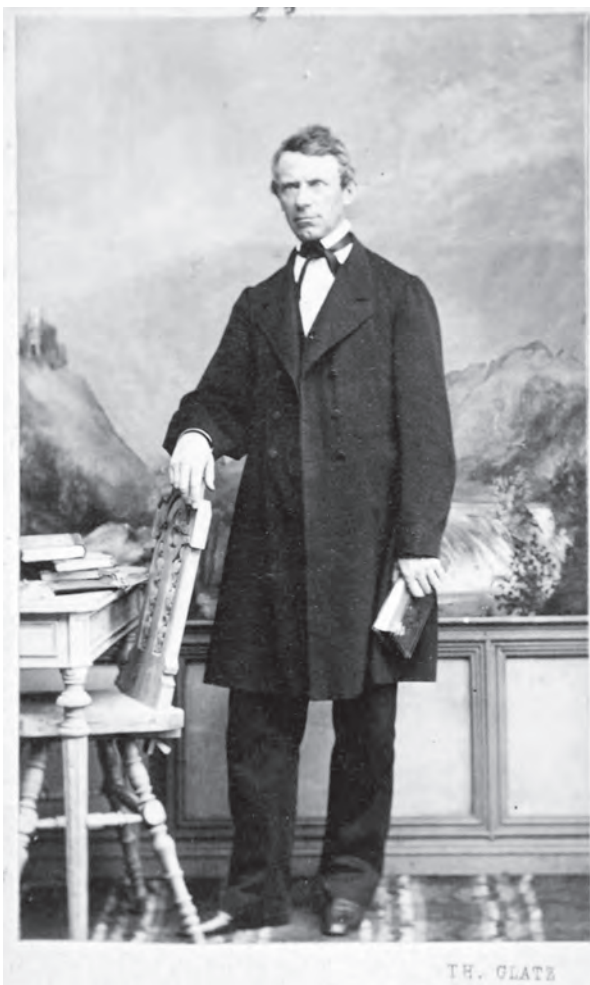
Portret de bărbat îmbrăcat în costum orășenesc.