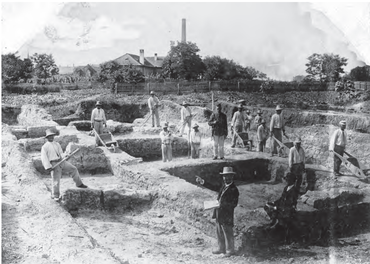
Săpături arheologice în Alba Iulia (în plan central: Cserni Adalbert). Fotografie realizată în 1903 (MNUAI).