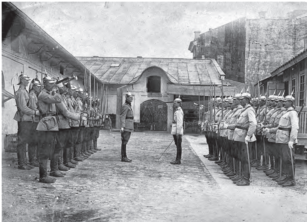
Schimb de gardă în interiorul garnizoanei. Fotografie realizată la sfârșitul secolului al XIX-lea