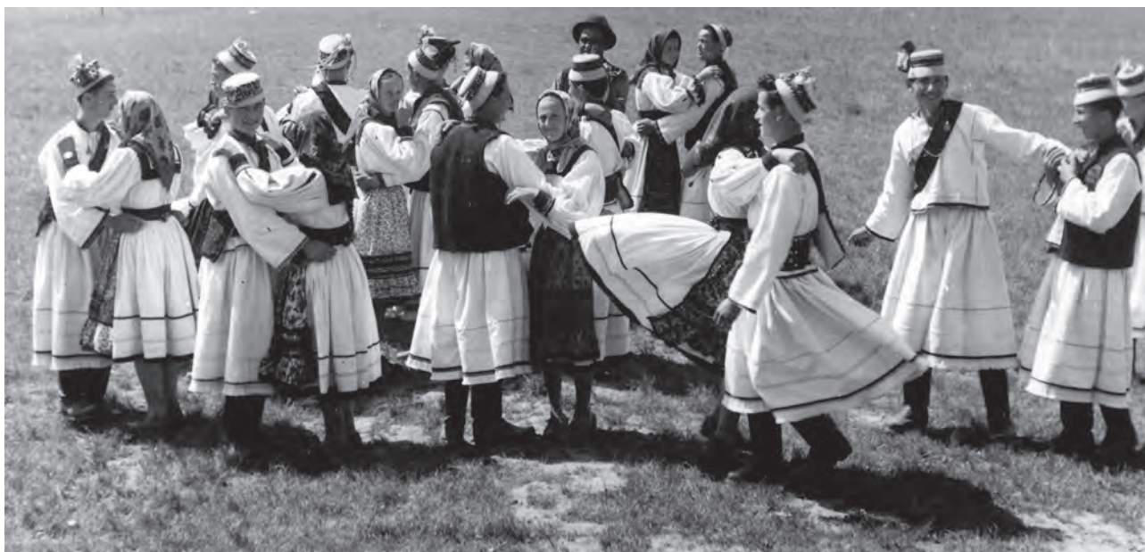
Dans tradițional în Negrești Oaș, 1964; fotograf I. Pop (MJSM).