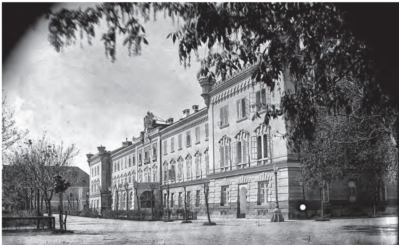
Alba Iulia, Clădirea Babilon - astăzi sediul Muzeului Național al Unirii (MNUAI)