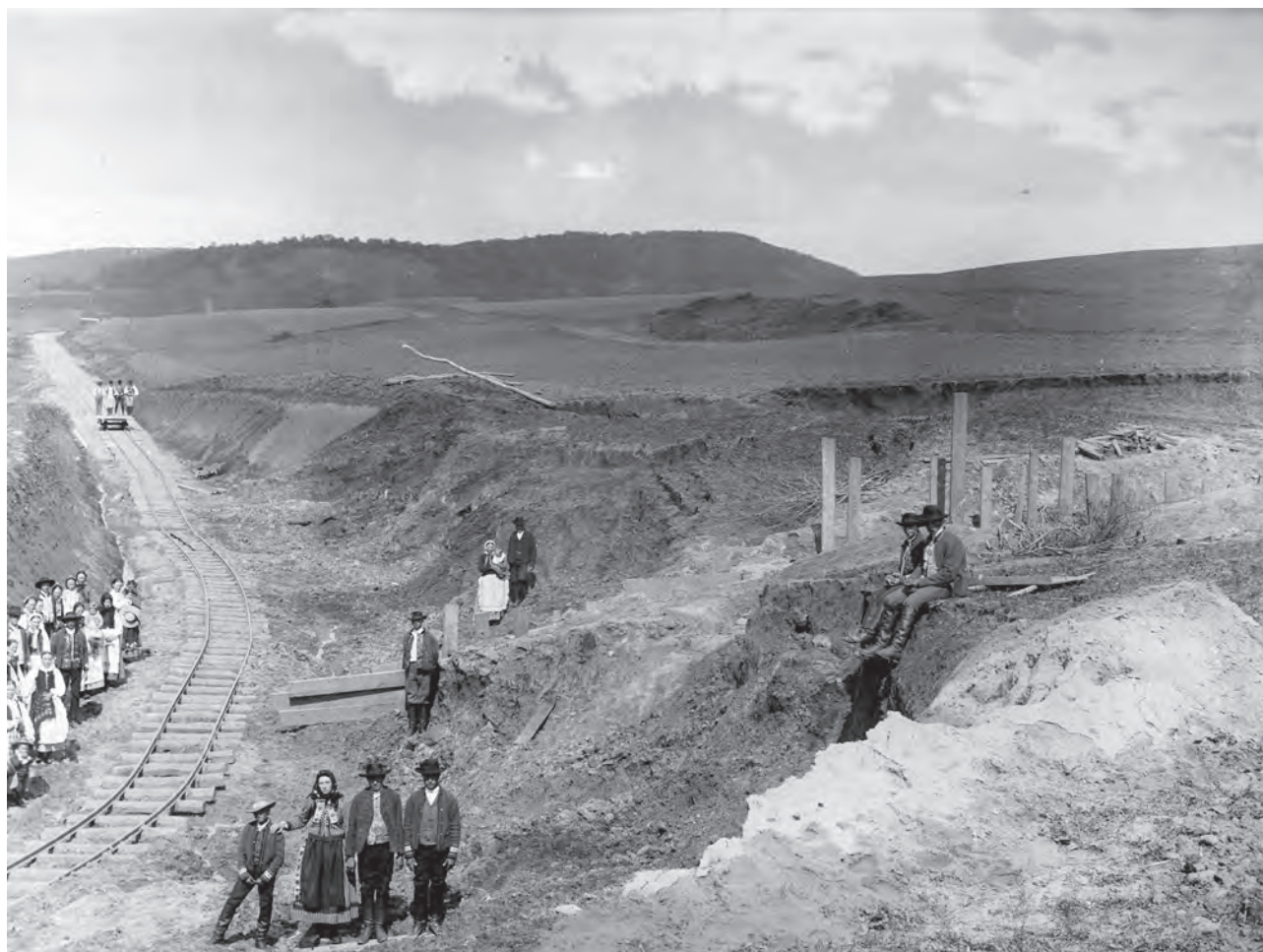
Alunecarea de teren din spatele Himberggraben (MIS).