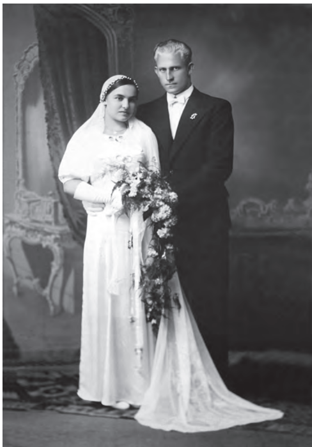
Portret de cununie. Fotografie realizată în 1935