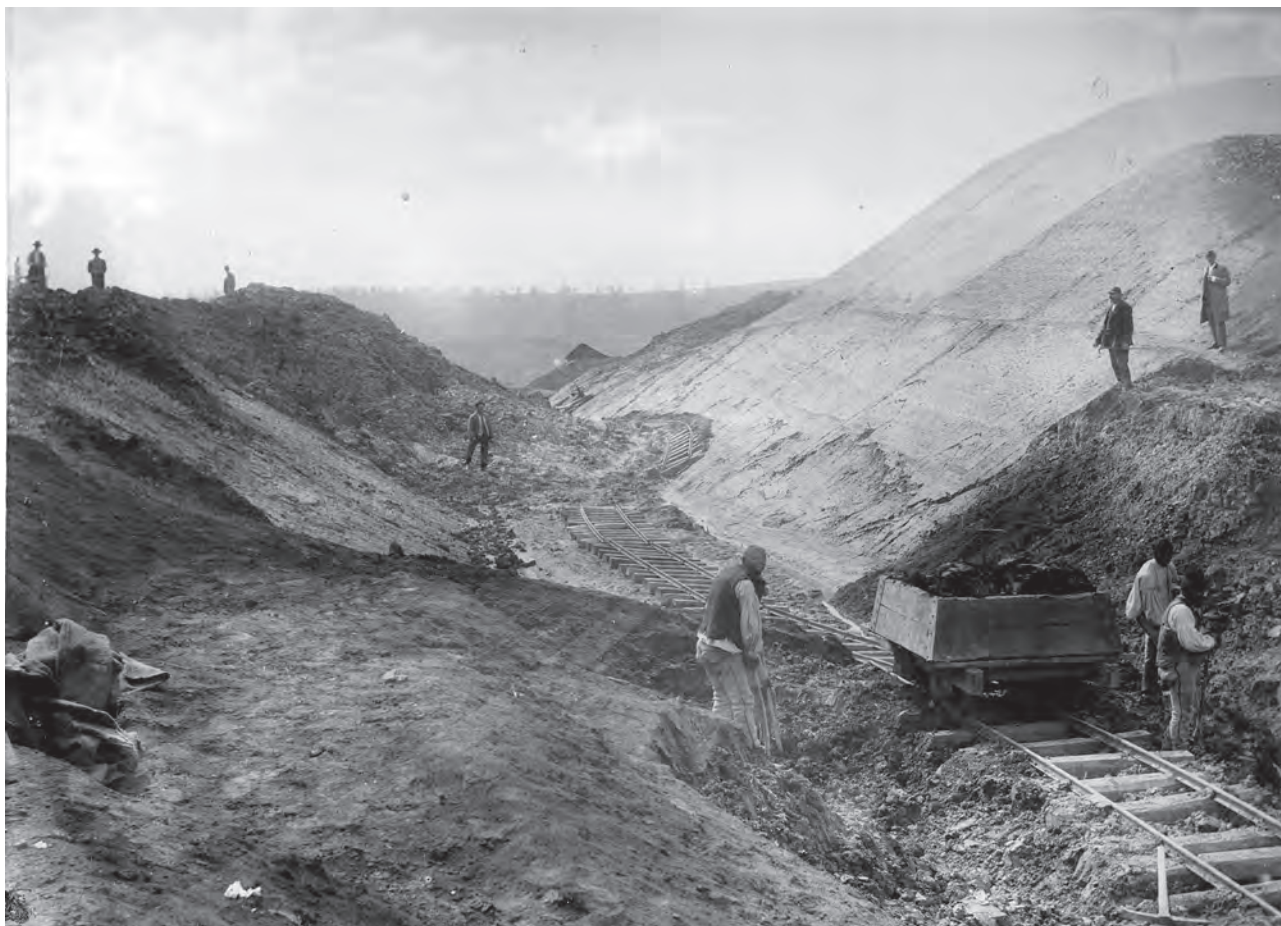
Alunecările de teren din marea tăietură de la cumpăna apelor, văzute dinspre est (MIS).