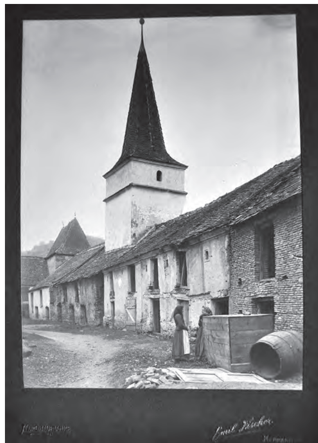
Moșna, Biserica Evanghelică.