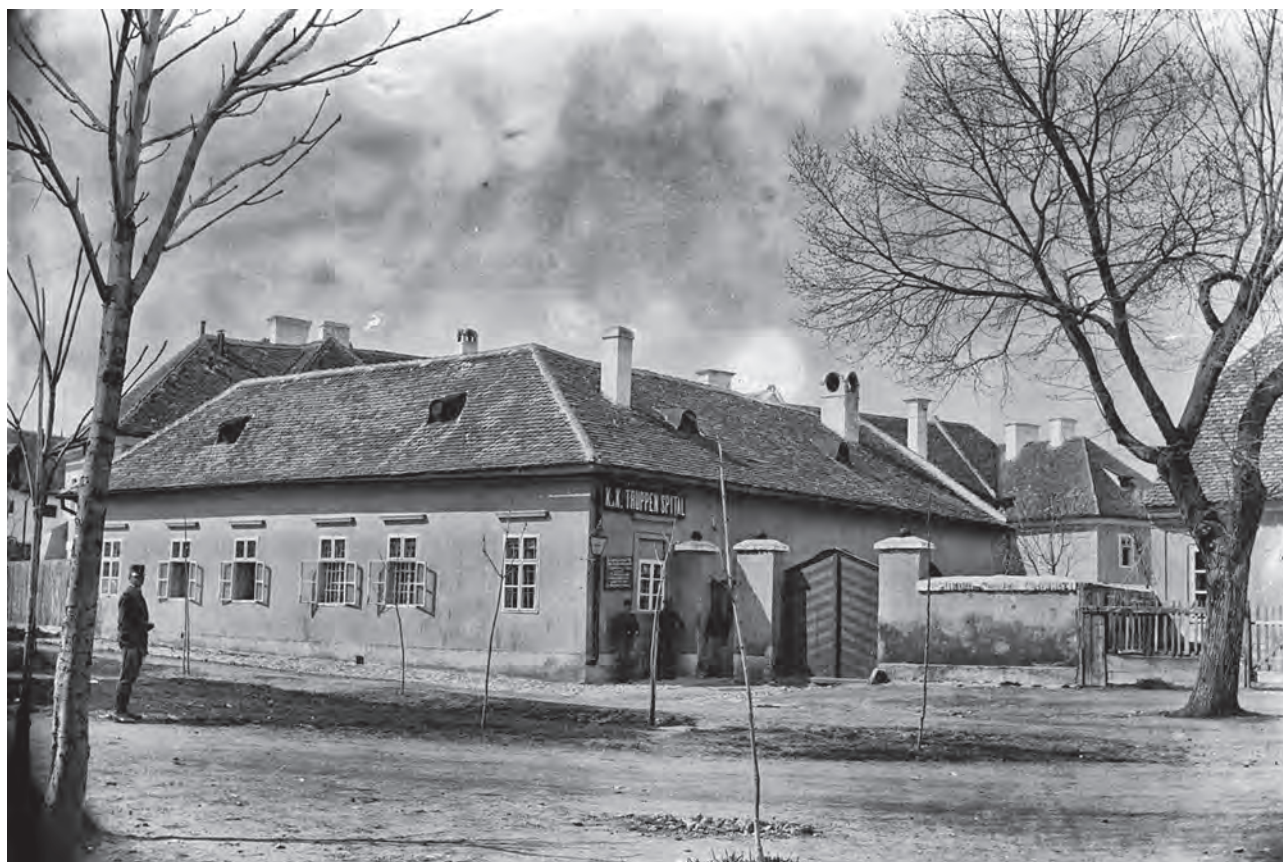
Alba Iulia. Spitalul Militar. Fotografie realizată în 1900 (MNUAI)