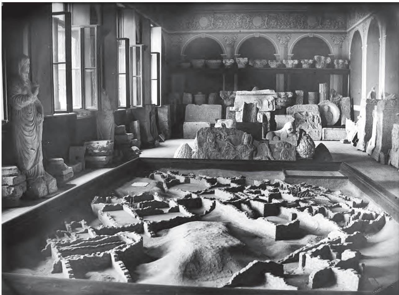
Sală din vechiul muzeu al oraşului Alba Iulia (MNUAI)