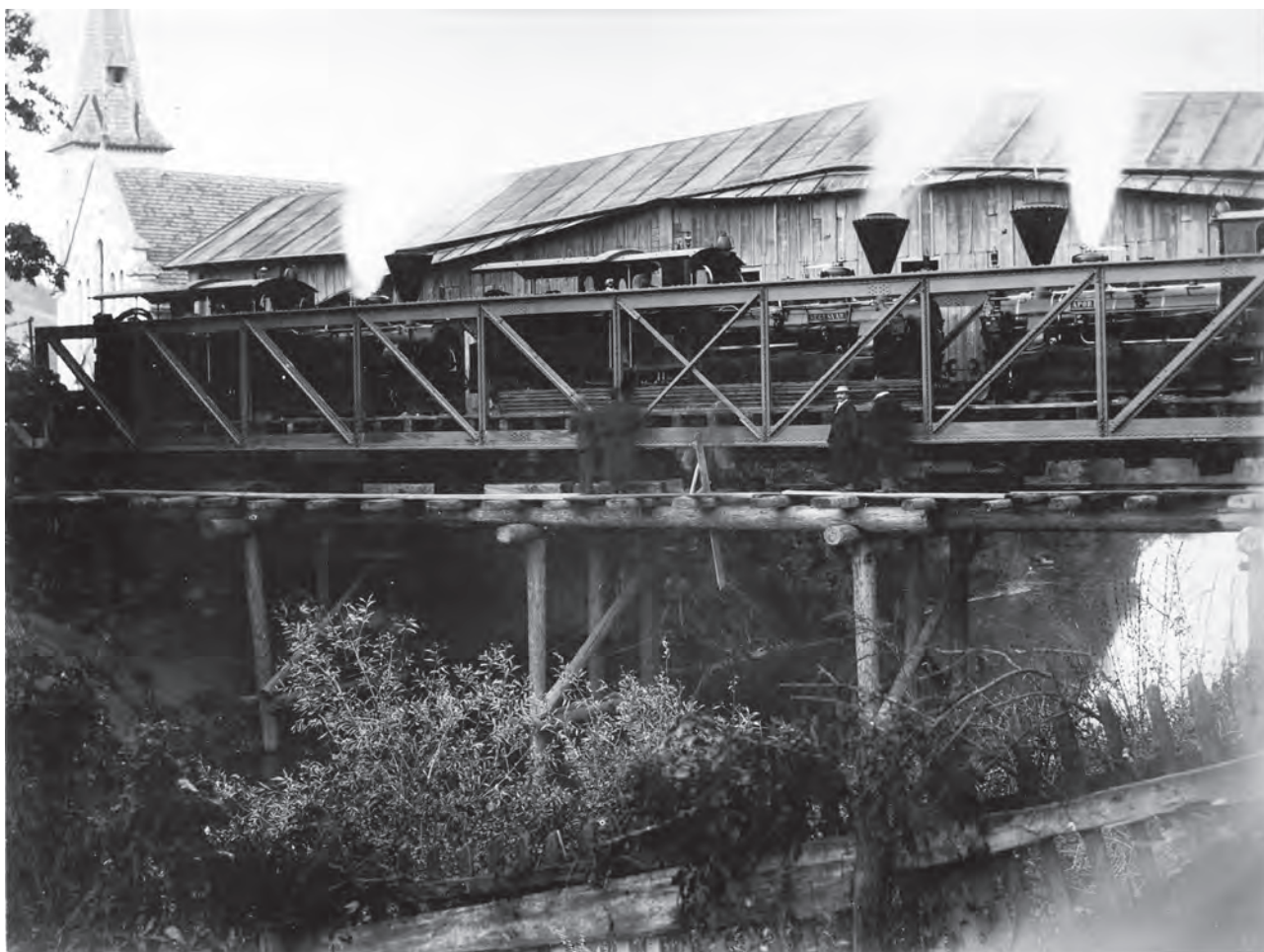
Proba de rezistență a podului din fier peste râul Târnava Mare, 20 octombrie 1896 (MIS).