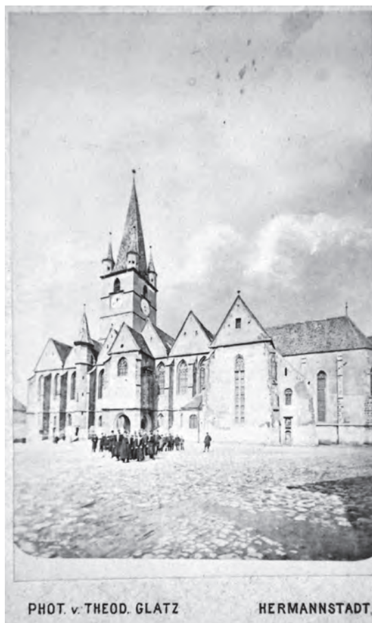
Sibiu, Biserica Evanghelică din Piața Huet. Fotograf: Th. Glatz (MNB – GD).