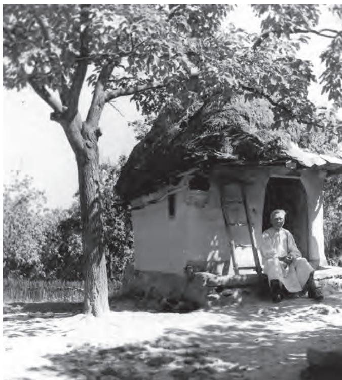
Casă monocelulară din Călinești Oaș, 1965.