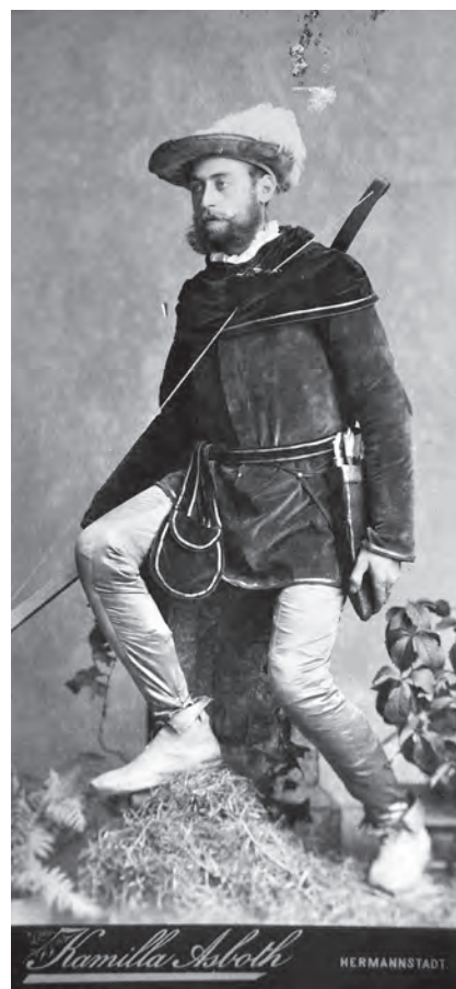
Artiști de la Teatrul German din Sibiu.