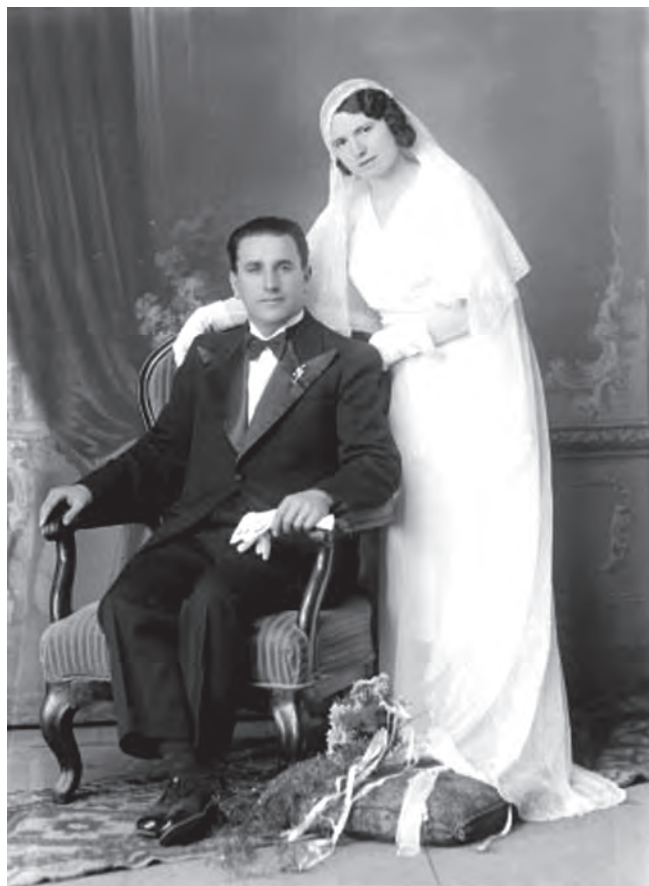
Portret de cununie. Prelucrare digitală după un clișeu pe sticlă