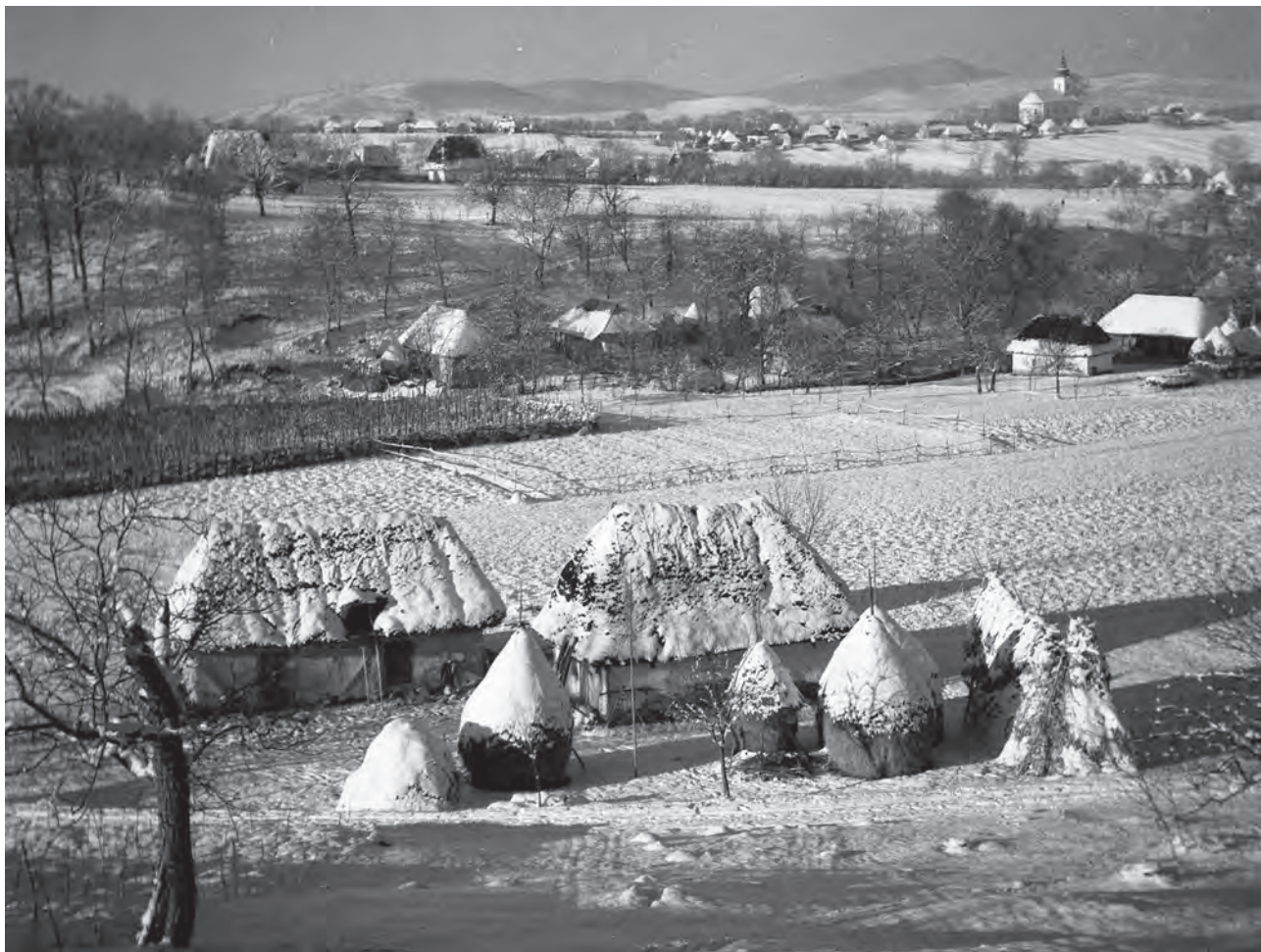
Priveliște de iarnă la Racșa, Țara Oașului, ianuarie 1945.