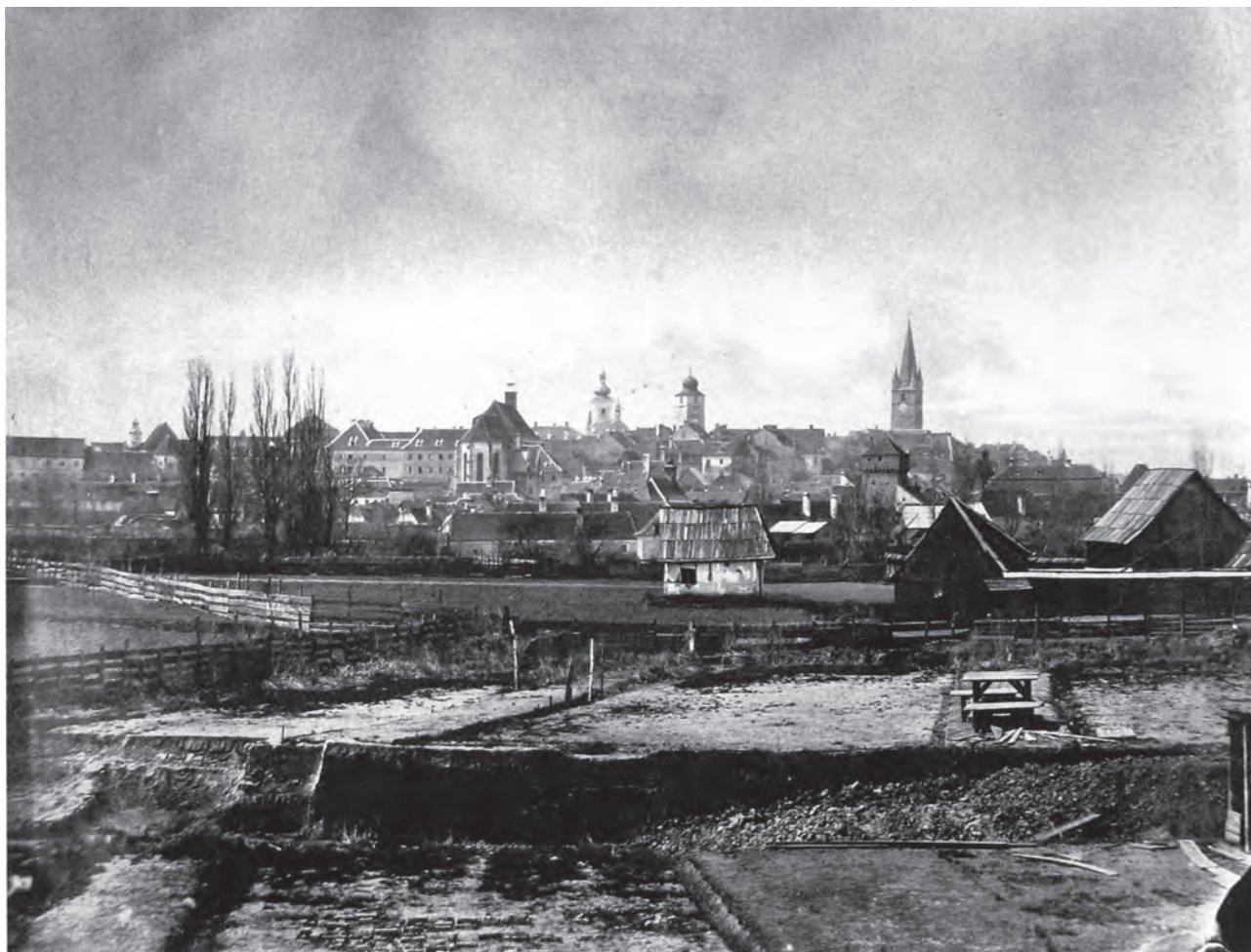
Sibiul de pe partea dreaptă a Cibiniului. În imagine apar Poarta Turnului, Poarta Sării și Poarta Ocnei, astăzi demolate.