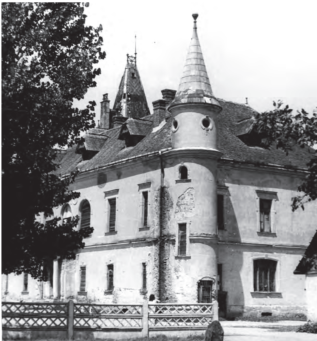
Castelul Teleki din Pribilești; fotograf I. Pop (MJSM).