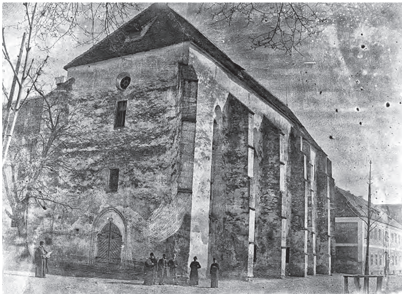
Alba Iulia, Biserica iezuiților (MNUAI)