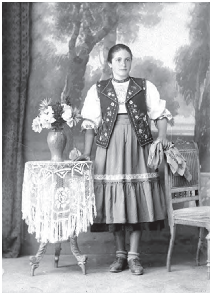
Portret de femeie îmbrăcată în costum popular. Prelucrare digitală după un clișeu pe sticlă (MJIAMM)