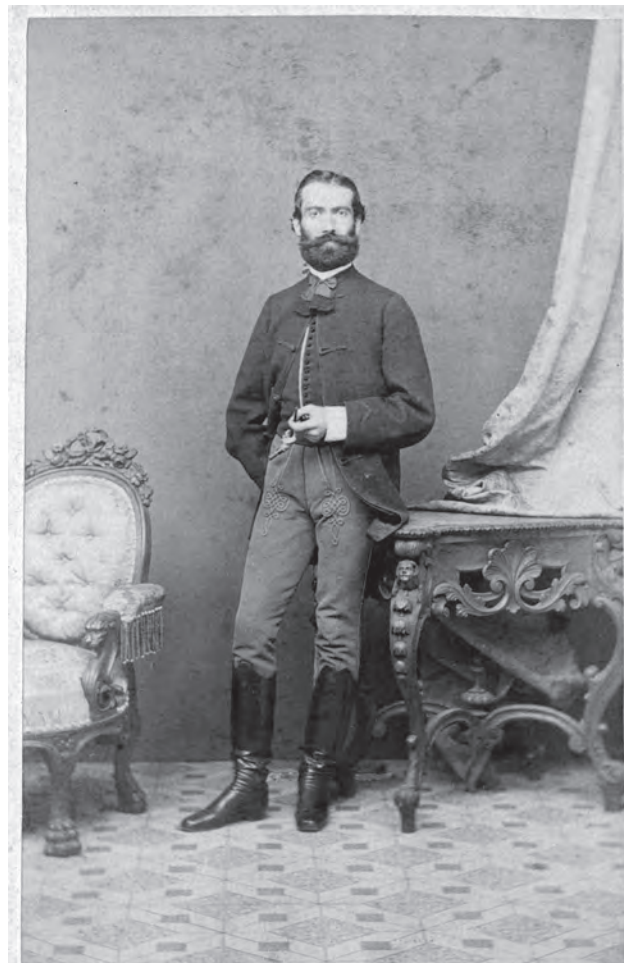
MEZEY L. MÜTERMÉBŐL.