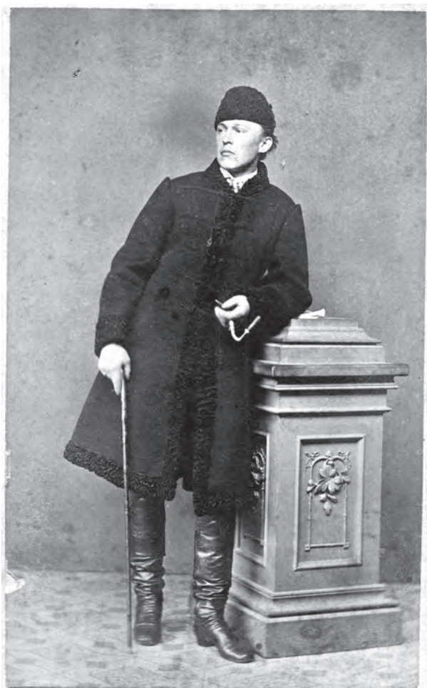
MEZEY L. MÜTERMÉBŐL.