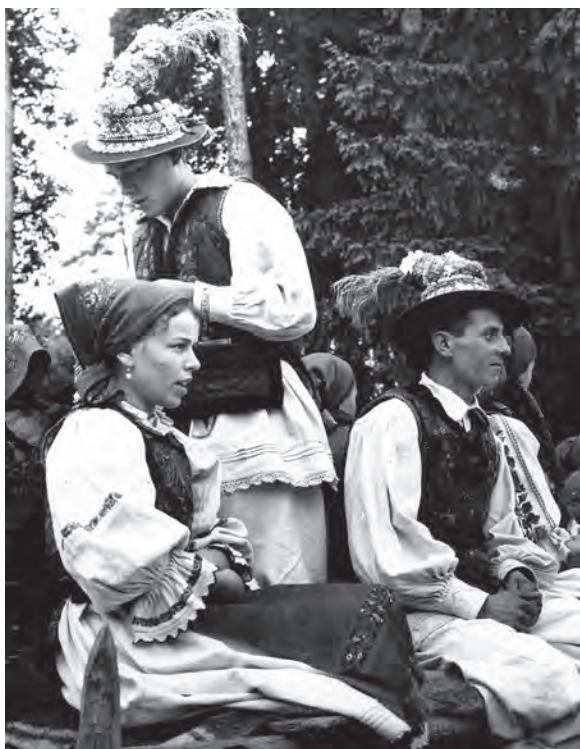
Port popular din Țara Lăpușului; fotograf I. Pop (MJSM).