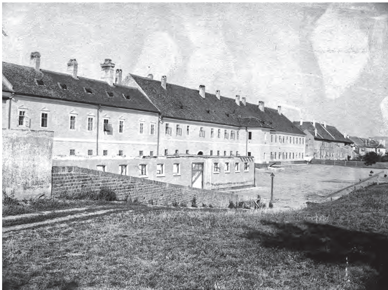
Alba Iulia. Fațada din spate a Palatului Principilor, sediul garnizoanei armatei austro-ungare (MNUAI)