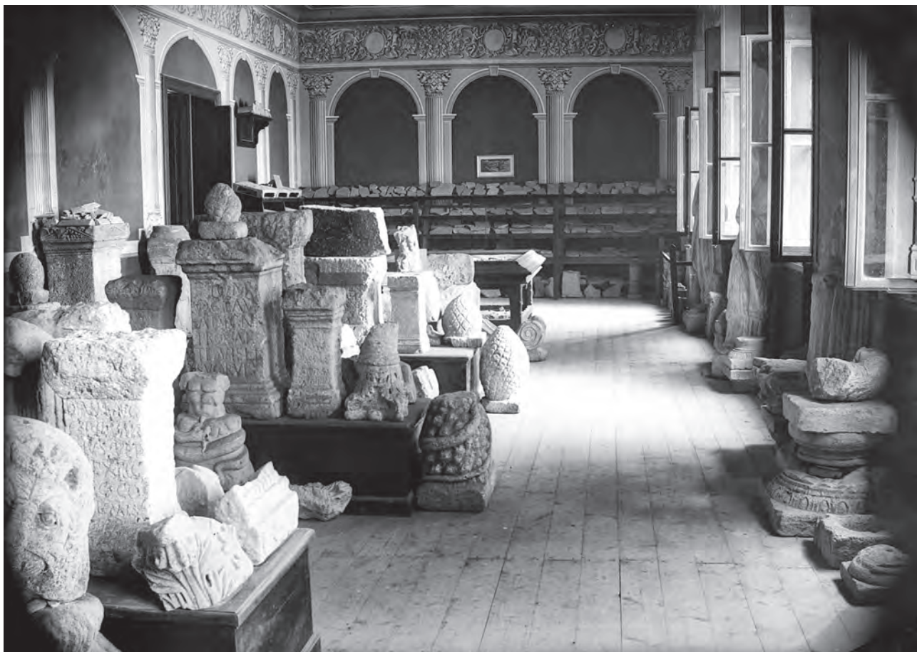
Sală din vechiul muzeu al oraşului Alba Iulia (MNUAI)