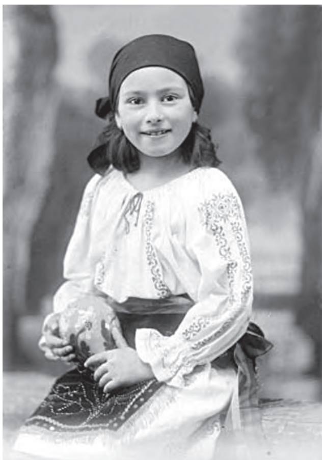
Portret de fetiță îmbrăcată în costum popular. Prelucrare digitală după un clișeu pe sticlă (MJIAMM)