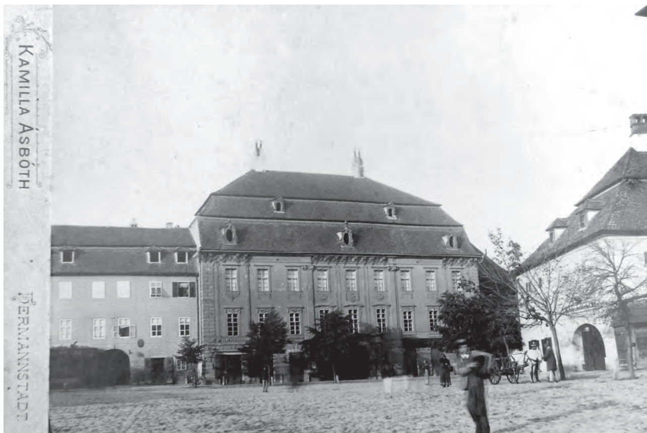
Sibiu, Muzeul Brukenthal din Piața Mare.