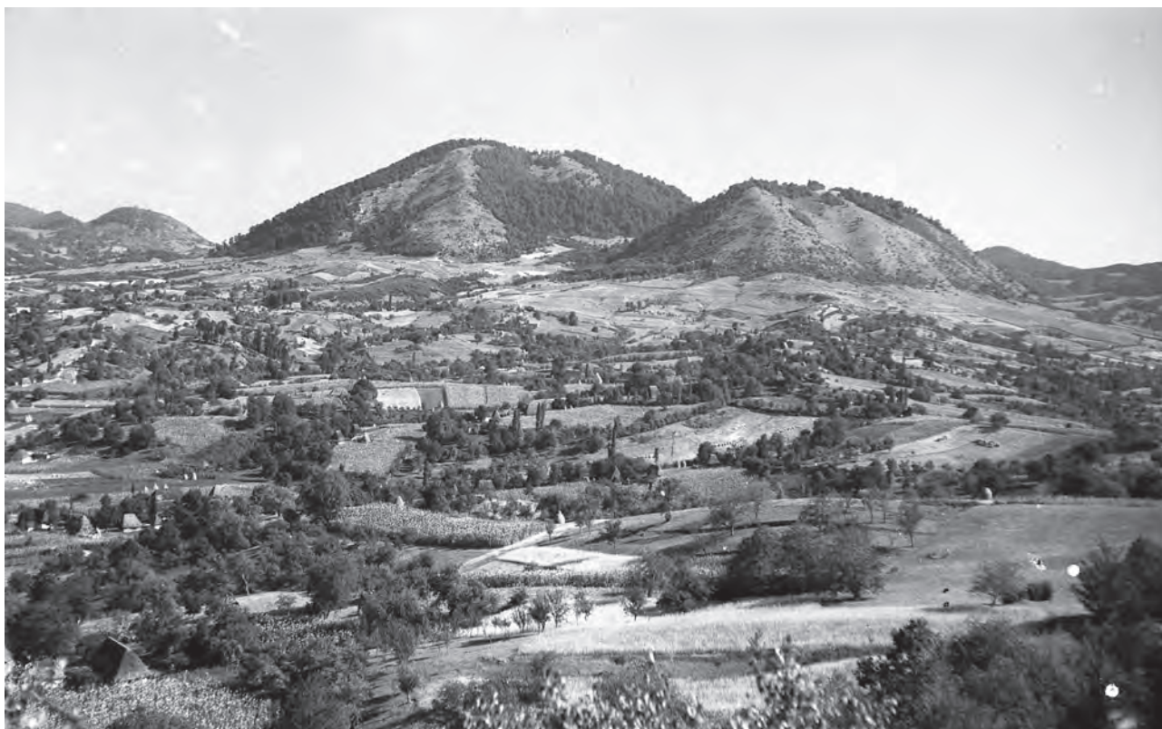
Vedere panoramică a satului Cămârzana, Țara Oașului, august 1942; fotograf Ioniță G. Andron (MJSM).