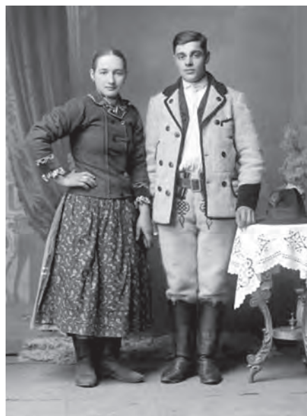
Portrete de cuplu. Prelucrări digitale după clișee pe sticlă (MJIAMM)