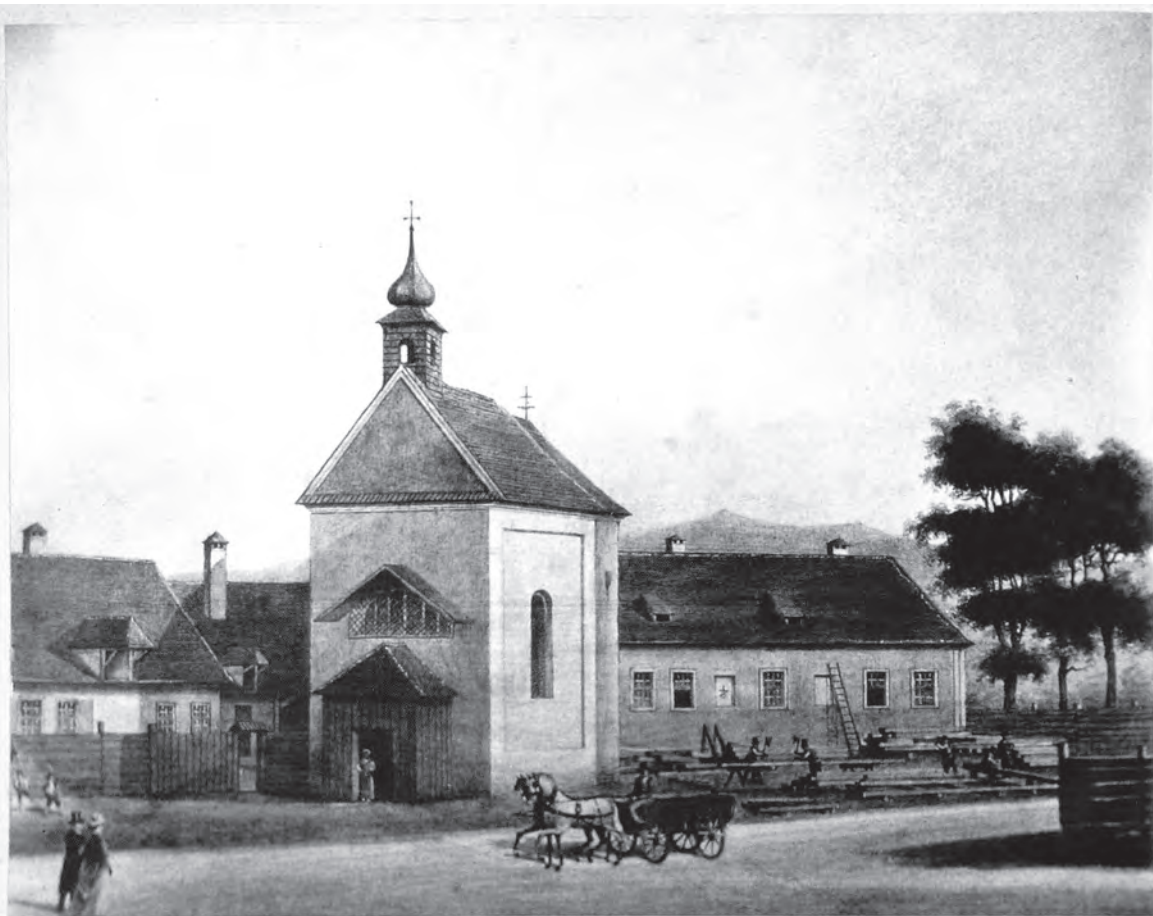
Sibiu, Capela Crucii. Lăcașul de cult a fost construit în secolul al XVIII-lea în scopul adăpostirii crucifixului lui Petrus Landregen, provenit din vechea biserică dominicană a Sibiului.