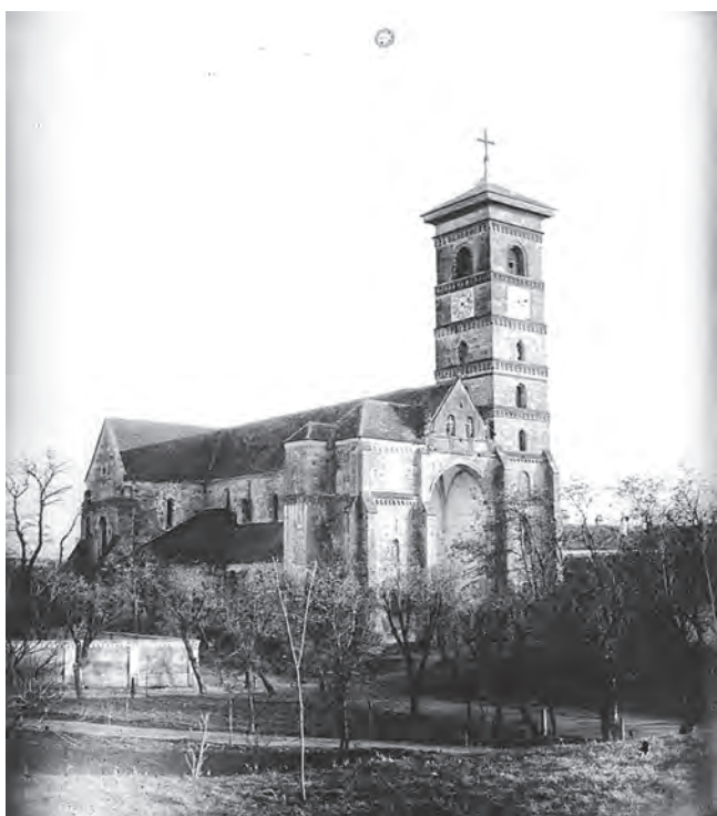
Alba Iulia, Catedrala Romano-Catolică (MNUAI)