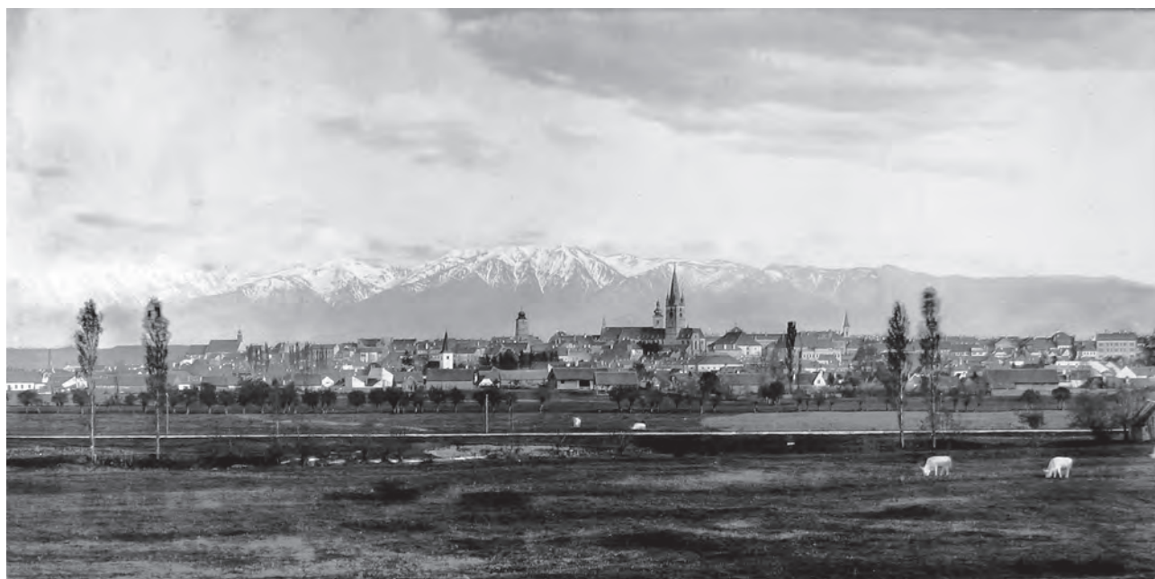
Sibiu, vedere generală.