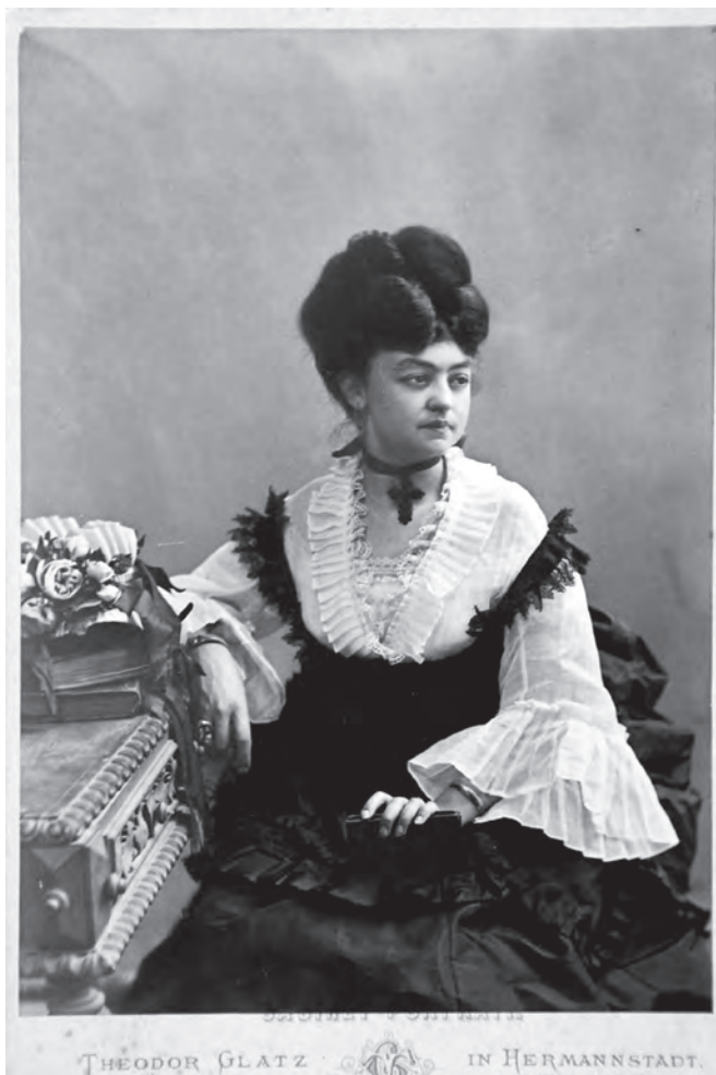
Portret de femeie îmbrăcată în costum orășenesc.