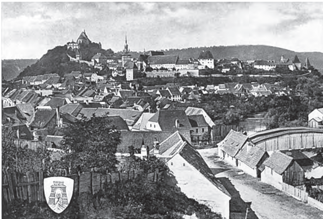
Sighișoara, vedere panoramică. Fotografie realizată în anii 1874-1875.