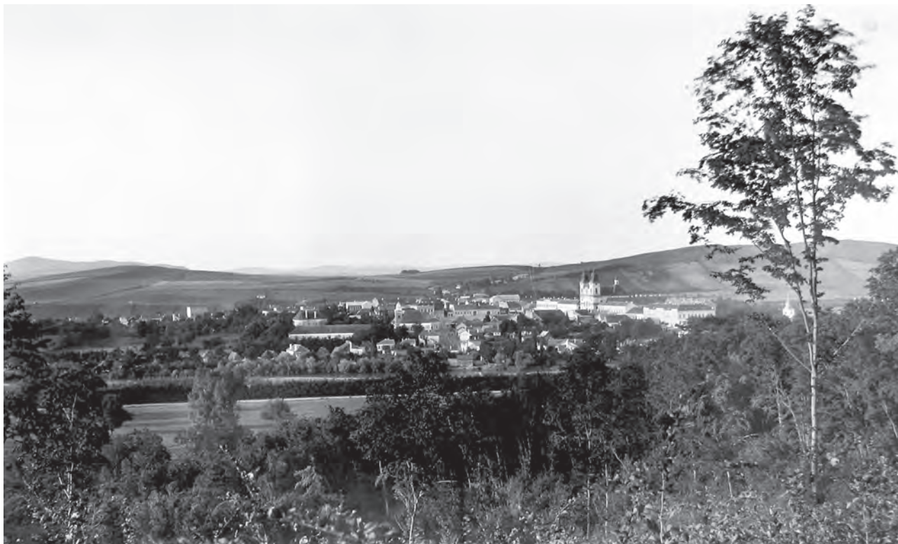
Blaj, vedere generală. Fotografia a fost donată Muzeului Asociației ASTRA în anul 1905.