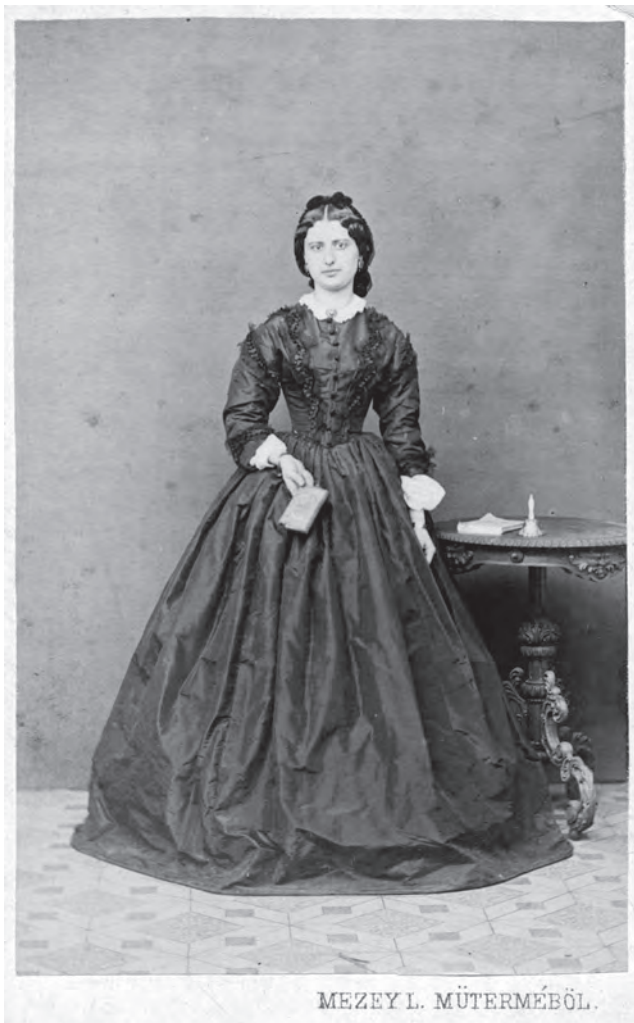
Portret de femeie (MoO)