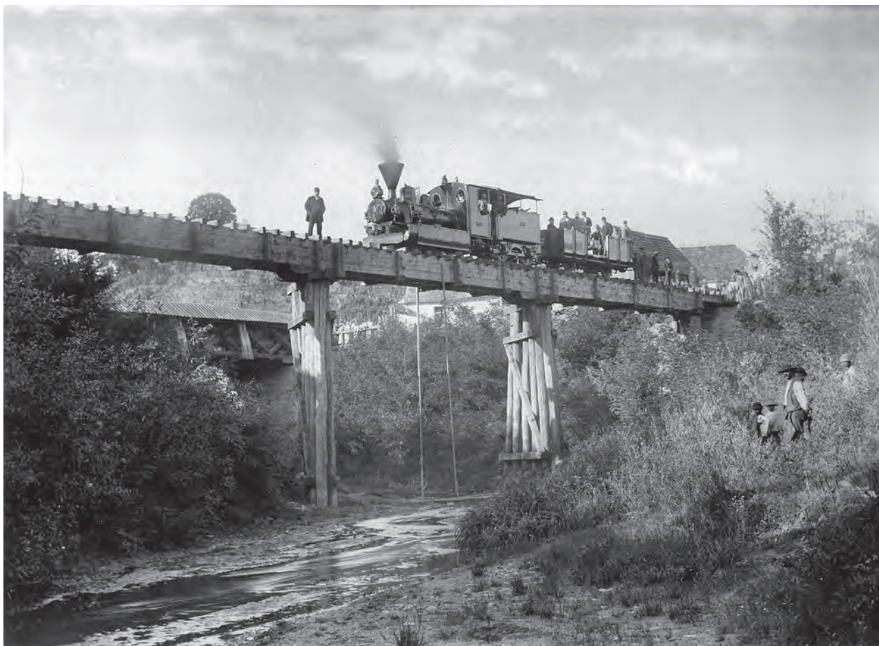
Prima locomotivă pe primul pod construit peste Valea Șaeșului, 7 octombrie 1896 (MIS).