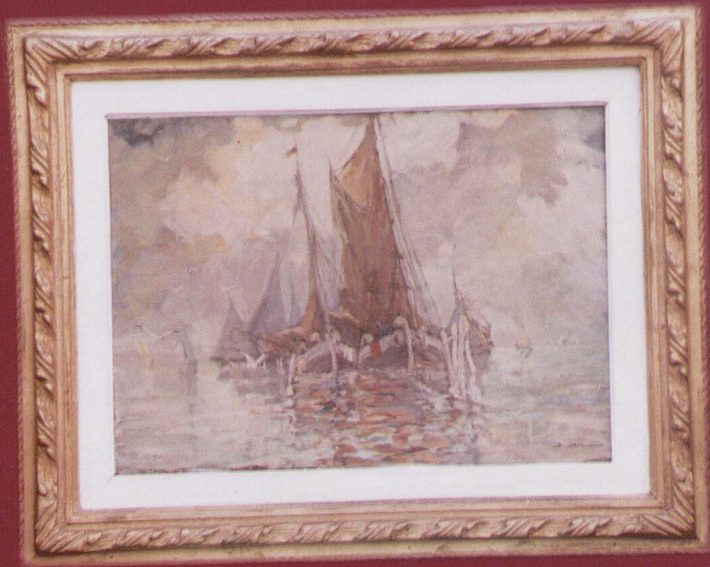
Bărci de pescari la Lido