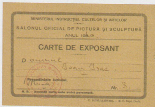
Carnetul de expozant la Salonul Oficial

Casa pictorului Ioan Isac, din str. Turin (Enescu), nr. 5, devenită muzeu, despre care citim în Universul din 24 iunie 1943: "Expoziția permanentă de pictură a d-lui profesor este pentru amatorii de artă și frumos un prilej de înălțare sufletească, iar pentru vizitatorii Timișoarei-ocazia de a lua contact cu opera unui pictor de real talent."