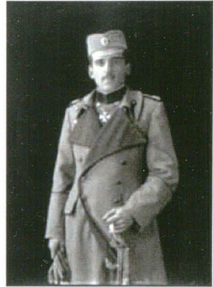
Vandyk 20058m 5 aprilie 1916

În toate aceste imagini, Regele Alexandru poate fi văzut purtând ochelarii săi de firmă, pe care îi comandase la Londra, douăsprezece perechi odată, și care îl făceau să pară mai mult ca un bancher american decât ca un Rege din Balcani - aceasta fiind părerea generală despre el.