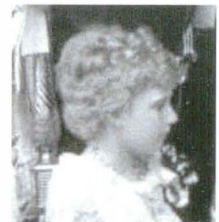
Prințesa Victoria Eugénie de Battenberg vitoarea Regină "Ena" a Spaniei (1887-1969)