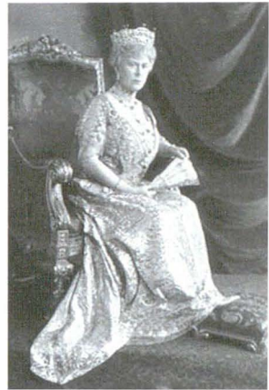
31 mai 1923

Scandalul iscat de aventura fiului lor mai mare cu Wallace Simpson și care a dus la abdicarea acestuia în 1936, a făcut-o pe regina Maria să exclame: “Într-adevăr! Ai zice că te afli în România!”, făcând aluzie la escapadele lui Carol al II-lea.