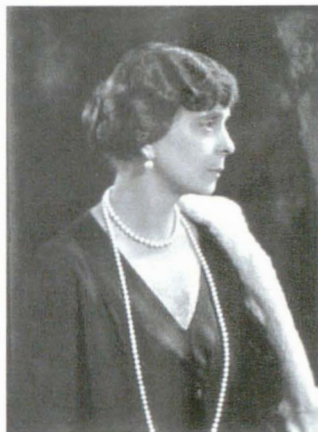
Lafayette 8430 16 octombrie 1924

“Mатуșа Elena” i-a dat niște sfaturi regale aceleiași nepoate în timpul Războiului Civil din Grecia, când pe Regina Frederica au năpădit-o emoțiile. “Oamenii ca noi nu plâng în public, niciodată”.