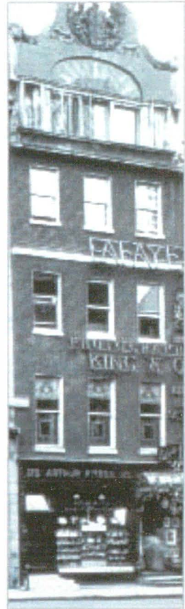
Studioul Lafayette Bond street, circa 1902

Certificatul Regal, reînnoit de regii Edward al VII-lea și George al V-lea i-au conferit un prestigiu enorm. Clasa conferită de titlul de “Fotograf