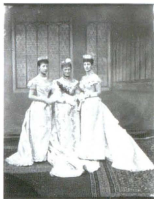
Lafayette 00418 Nedatlat [1893]

Această imagine arată uriașa cantitate de bijuterii purtate în ocazii publice de către familiile regale: Regina Alexandra poartă o tiară cu ciucuri din diamant kokoschnic, colier scurt tivit cu perle; colier de diamante, ghirlandă de diamante și broșă de diamante și perle.