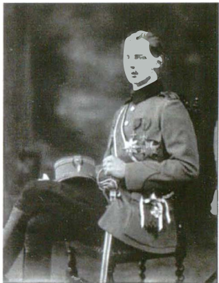
Bassano 59832-3b 12 mai 1922