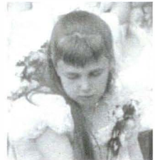
Prințesa Beatrice de Edinburgh Viitoarea Infanta Alfonso, Ducesa de Galliera (1884-1966)