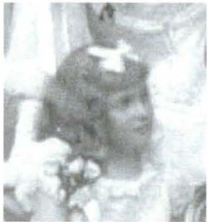
Prințesa Alice de Battenberg vitoarea Prințesă Andrew a Greciei (1885-1969)

Adoua fiică a Regelui Edward al VII-lea și a Reginei Alexandra