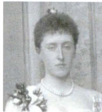
Prințesa Helena Victoria (de Schleswig-Holstein) (1870-1948) Nepoată a Reginei Victoria

A treia fiică a Regelui Edward al VII-lea și a Reginei Alexandra