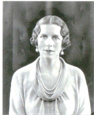
Bassano 78919-1B 22 noiembrie 1934