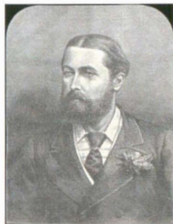
Harper's Weekly 14 februarie 1874

Întrucât căsătoria lui Alfred cu Marea Ducesă Maria, precum și propria sănătate se deterioraseră, cei doi petreceau tot mai mult timp despărțiți. Ducele a murit după o scurtă suferință, de cancer în gât, în iulie 1900, precedat de fiul său, iar Regina Victoria era încă în viață la acea dată. “O, Dumnezeuule, bietul, dragul meu Affie s-a dus și el!” se lamenta mama acestuia. “...cel de-al treilea copil al meu... ce greu este la optzeci și unu de ani!”