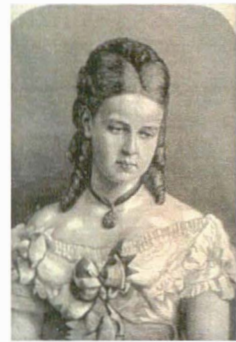
Harper's Weekly 14 februarie 1874

După Revoluția Rusă și dizolvarea ducatelor germane, Ducesa a trăit într-un mic hotel din Elveția, destul de modest, întrucât își pierduse toata averea din Rusia. O invenție mult repetată, scornită inițial de Martha Bibescu, spunea ca Ducesa a murit pe loc din cauza șocului pricinuit de o scrisoare adresată “Doamnei Coburg”.