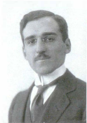
Vandyk 99130 5 aprilie 1916