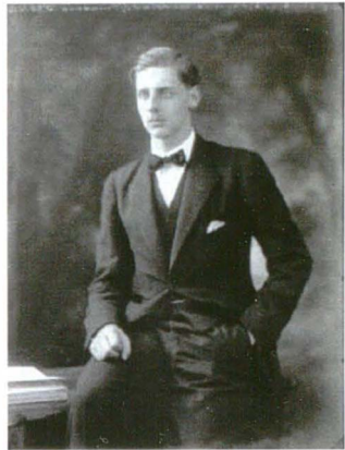
Bassano 59832-3b 12 mai 1922

Când fratele său Carol a murit în Portugalia în 1953, Nicolae a participat la funeralii pentru ca mai târziu să noteze: "L-am urât pe Carol mai mult decât pe oricine altcineva în viața mea...dar era Regele meu".