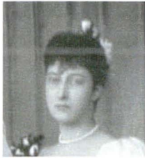
Prințesa Maud de Wales vitoare regină a Norvegiei (1869-1938)

A treia fiică a Regelui Edward al VII-lea și a Reginei Alexandra