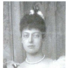
Prințesa Victoria (de Wales) (1868-1935)

Adoua fiică a Regelui Edward al VII-lea și a Reginei Alexandra