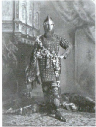
Lafayette 1365 3 iulie 1897

După moartea lui Alfred, unele surse relatează că tatăl acestuia nu a mai petrecut nici o noapte sub același acoperiș cu Marea Ducesă Maria.