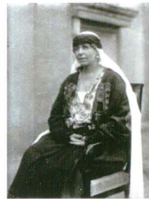
47876D Datat: 9 mai 1924

În timpul vizitelor de curtoazie făcute în țările Europei Occidentale Regina Maria și Regele Ferdinand au fost oaspeții Regelui George și ai