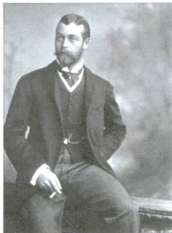
Nedatată [1891]

În timpul șederii sale la Palatul Buckingham, patruzeci de ani după prima lor întâlnire, Regina văduvă Maria a putut scrie în jurnalul ei: “George mi-a purtat mereu o afecțiune specială. Îl stimulez, vitalitatea mea de nezdrcinat îi face sângele să circule mai repede prin vene și May (regina Mary) simte asta...”