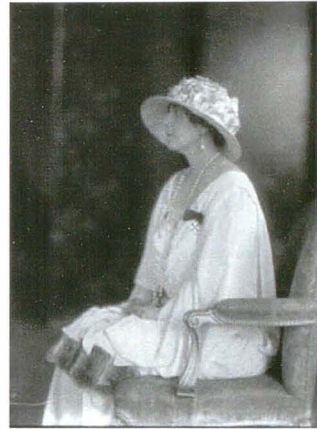
13 mai 1924

În această serie de imagini Regina Maria poartă insigna Celui mai Venerabil Ordin al Sfântului Ioan din Ierusalim. Zona ochilor a fost foarte retușată.