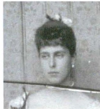
Prințesa Victoria Melita de Edinburgh Viitoarea Marea Ducesă Kiril a Rusiei (1876-1936)