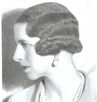
Bassano 78919-3B Detaliu 22 noiembrie 1934

sensibilizeze în legătură cu viitorul României. În ciuda poziției sale precare, Regina Elena și-a folosit influența pentru a salva viețile a zeci de mii de evrei ce urmau să fie deportați și exterminați de guvernul pro-nazist.