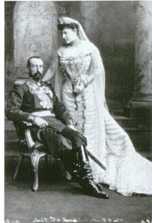
Lafayette 3368a 11 August 1902