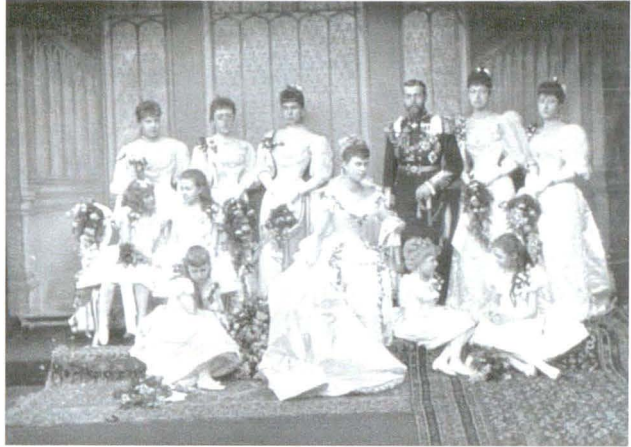
Lafayette 00417 Nedatat [6 iulie 1893]

Se mai șoptea că din toate cele cinci domnișoare de onoare mai vârstnice nici una n-ar fi refuzat mâna prințului George.