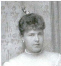
Prințesa Alexandra de Edinburgh Viitoarea Prințesă Ernest Hohenlohe-Langenburg (1878-1942)