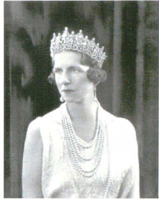
Bassano 78919-6B 22 noiembrie 1934

În timpul celui de-al Doilea Război Mondial a fost trimisă de două ori să îl întâlnească pe Hitler și să-l