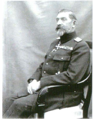
Vandyk 47877G 13 mai 1924

O imagine similară, posibil din aceeași sesiune, a fost publicată în ziarul “The Times” în timpul vizitei de stat în Marea Britanie, alături de un articol care îi prezenta laudativ pe Rege și Regină drept aliați credincioși: “Conduita nobilă a regelui și a reginei de-a lungul mării crize prin care a trecut România în timpul Războiului Mondial va rămânea pe veci în memoria poporului român”.