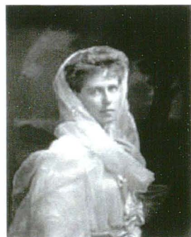
nedatat [1902]

Maria era fiica cea mare a lui Alfred, Duce de Edinburgh, al doilea fiu al Reginei Victoria (și care a devenit ulterior Duce de Saxa-Coburg și Gotha), și a Marii Ducese Maria a Rusiei, unica fiică a Tarului Alexandru al II-lea.