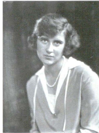
Lafayette 8435 16 octombrie 1924