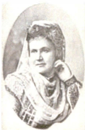
Carmen Sylva Carte de vizita de B. Athen, Bucuresti Nedat [Imagine din colecție particulară]