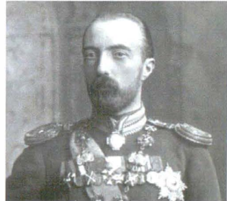
Lafayette 3369b 11 August 1902