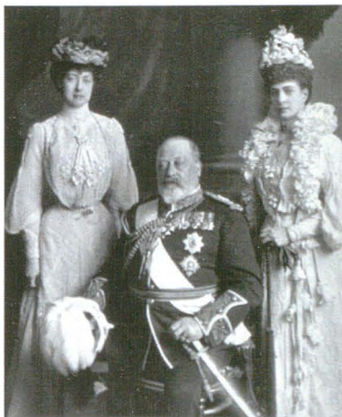
Lafayette 00424 Nedatat