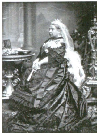
0008 Nedatat [1887]

Când Maria și Ferdinand au vizitat-o pe Regină câțiva ani mai târziu, împreună cu primii lor doi copii, Maria i-a mărturisit acesteia că născuse cu ajutorul nou-descoperitului cloroform. “Foarte bine, draga mea... eu a trebuit să aduc pe lume opt copii fără ajutorul lui prețios!” a fost răspunsul Reginei.