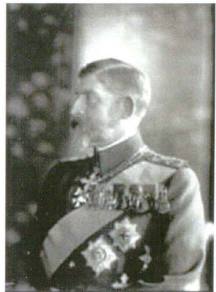
Vandyk 41918B 13 mai 1924