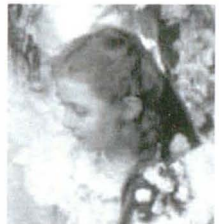
Prințesa Patricia de Connaught vitoarea Lady Patricia Ramsay (1888 -1974)