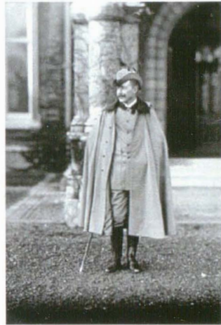
Lafayette 3678 11 noiembrie 1902

Fotograful James Lafayette a scris într-o broșură publicitară că cel mai dificil de fotografiat personaj din toată cariera sa a fost Kaiser-ul, iar fotografiile rezultate au fost cele mai nereușite: “Nu vă vine să credeți, dar Kaiser-ul detestă să fie fotografiat. L-am vânat zile întregi până să îl aduc în fața aparatului și dacă n-ar fi fost Ducele de Connaught, nu l-aș fi prins niciodată”.