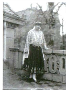
Vandyk 47876H Datat: 13 mai