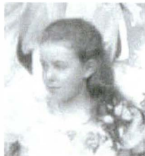
Prințesa Margaret de Connaught vitoarea Prințesă Moștenitoare a Suediei (1882-1920) Nepoată a Reginei Victoria

Mamă a Prințului Philip, Duce de Edinburgh