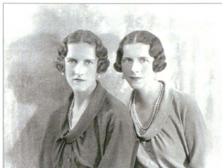
22 noiembrie 1934 Prințesa Irina (stânga) Regina Elena (dreapta)

dubioasă de a fi monarhii statului croat marionetă și Ducele a izbutit să fugă în zona ocupată de armatele aliate, lăsând-o în urmă pe soția sa însărcinată, ulterior arestată de SS și trimisă în Austria unde avea ”domiciliul forțat diplomatic”. Când Regina Elena nu mai primise vești de la sora sa se temuse de ce era mai rău, mai ales că auzise despre Prințesa Mafalda, fiica Regelui Victor Emanuel și soția landgrafului de Hesse că aceasta murise în lagărul de concentrare Buchenwald. Prințesa Irina a scăpat cu viață numai datorită faptului că gărzile germane s-au retras înainte de a îndeplini ordinele de la Berlin, potrivit cărora refugiații diplomatici trebuiau executați.