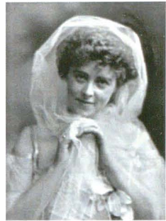
Princess Daisy of Pless 11 octombrie 1901 Lafayette, 2827H

Oricum, o imagine din aceste sesiuni fotografice, dar mult mai rezervată, a fost publicată sub formă de carte poștală de un oarecare Grimm din Gotha.