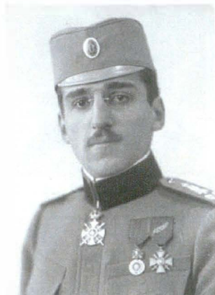
Vandyk 20111H 5 aprilie 1916

Banderola de gât de Comandant al Ordinului Sârbesc Karagheorghe Medalia Militară Crucea de război