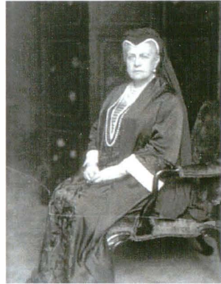
5 septembrie 1922

Regele George și Regina Olga au avut opt copii, cel de-al patrulea fiu al lor, Andrew, urmând să fie tatăl Prințului Philip, Duce de Edinburgh.