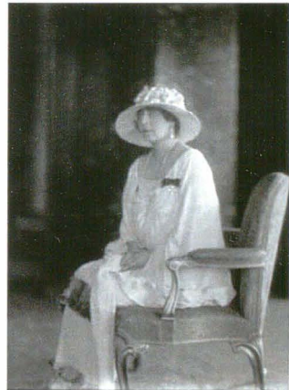
Vandyk 47917b 13 mai 1924