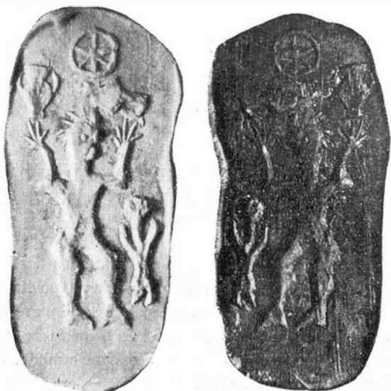
Fig. 2 a—b

parois, le relief de la scène figurée sur le cachet découvert quelques années auparavant dans la même station. La scène des parois du vase