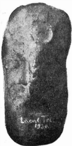
Fig. 2 c

a été obtenue à l'aide du même cachet. Le vase a été premièrement empreint et ensuite on a continué le travail du tour, tel que nous l'observons aux indices demeurés sur le vase et sur la scène des parois du vase (fig. 3—4). Les fragments de céramique qui portent l'empreinte du cachet sont épaisses, de couleur noirâtre-brunie. La cassure a la teinte brique-rosée. Les traces du tour, sont visibles aussi bien à l'intérieur qu'à l'extérieur du vase où elles apparaissent sous l'aspect de traits excessivement minces, parallèles au bord du vase. À la partie externe, ces traits ne se distinguent pas à l'endroit où probablement on a dû appliquer les anses du vase; elles sont masquées par une couche en argile appliquée et aplatie à la main (côté droit de la reproduction sur la figure 3—4). Par son aspect, la céramique qui porte cette figuration, montre les caractères d'une catégorie céramique locale, de l'âge tardif du fer.