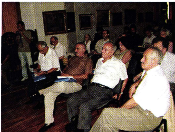
Aspect de la sesiunea de comunicări din 28-29 iulie 2006, Muzeul Județean Buzău