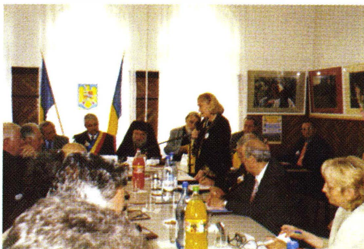
Aspect de la manifestările din 2 – 3 septembrie 2006, Săliștea Sibiului