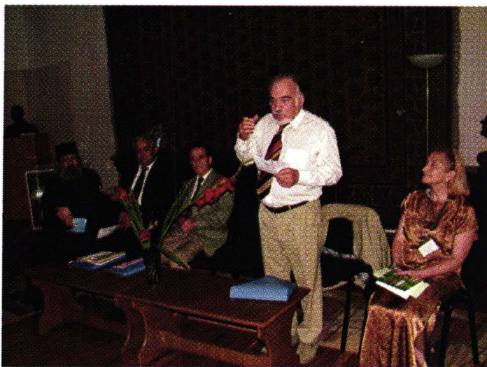
Aspect de la sesiunea de comunicări din 28-29 iulie 2006, Muzeul Județean Buzău