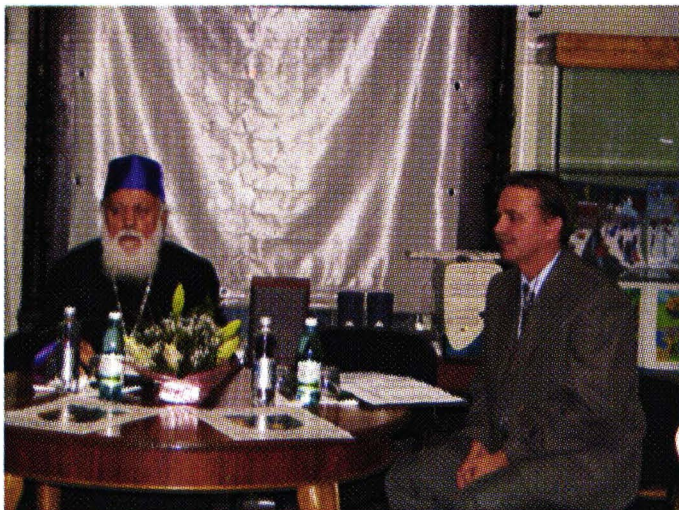
Aspect de la manifestarea din 13-14 iunie 2006, Biblioteca Județeană „Vasile Voiculescu” Buzău