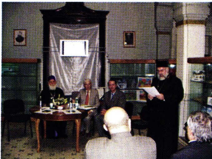
Aspect de la manifestarea din 13-14 iunie 2006, Biblioteca Județeană „Vasile Voiculescu” Buzău