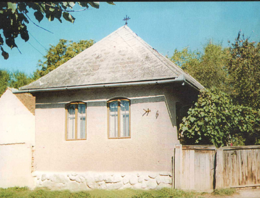
Casa natală a scriitorului Romulus Ciofleac din comuna Araci, jud. Covasna

„Trecutul este o planetă din galaxia existenței noastre la care niciodată nu ne vom întoarce, dar care mereu ne transmite niste semnale, provocându-ne astfel nostalgia... Pulbera uitării a viscolit peste potecile odinioară bătătorite. Am devenit arheologii istoriei imediate. Redescoperirea lui Romulus Ciofleac tine de aceste investigații.”