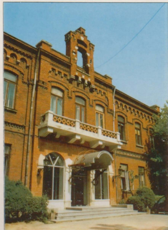
Sediul firmei. Calea Rahovei 196. Bucuresti

GRUPUL "ROMTRANS" - S.A. BUCURESTI ESTE PREZENT ÎN STRĂINĂȚATE prin 13 societăți mixte și sectoare în AUSTRIA, GERMANIA, ITALIA, BENELUX, IRAN, REPUBLICA MOLDOVA, SLOVACIA, RUSIA, UNGARIA și IUGOSLAVIA, precum și printr-o largă rețea de firme corespondente, specializate în transporturi și expediții internaționale de marfuri.