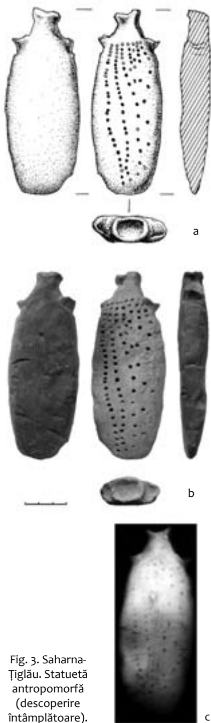
Fig. 3. Saharna-Țiglău. Statuetă antropomorfă (descoperire întâmplătoare).

antropomorfă (fig. 3). Piesa a fost confecționată dintr-o pastă de lut relativ bine preparată, având în calitate de adaos cioburi mărunte. Arderea este incompletă și neuniformă. Statueta poartă pe o parte urme de la ardere reducătoare, culoarea fiind neagră, iar pe cealaltă – cărămizie cu pete cenușii. Suprafața este netezită ușor. Prin forma sa, statueta are un aspect stilizat antropomorf, ea având corpul oval alungit, plat în secțiune cu partea de sus alungită în formă tronconică. Capul statuetei este reprezentat printr-o proeminență conică, ovală în plan, cu o cavitate în interior. La baza „gâtului” prin aceeași tehnică de alveolare sunt trase din corp, prin modelare, brațele schematice ale statuetei. Baza figurinei se subțiază spre partea inferioară. De la nivelul brațelor pleacă în jos trei șiruri oblice văluroase, aproape paralele, compuse din cerculețe imprimate cu ajutorul unui bețișor, restul spațiului fiind umplut haotic cu cerculețe imprimate. Dimensiuni: H-13,2 cm, L-8 cm, Gr-2 cm.