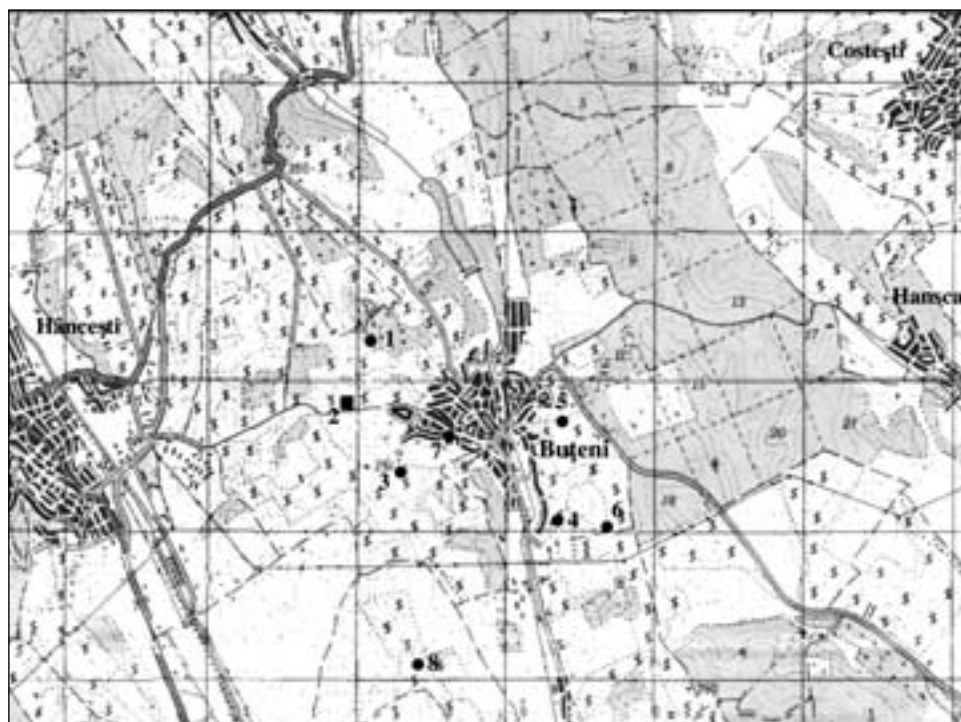
Fig. 1. Descoperiri arheologice în apropierea s. Buțeni (r-nul Hâncești).

în mod deosebit fragmentele de amfore grecești și de ceramică de lux. În ruptura malului și astăzi se observă anumite complexe, gropi menajere, gropi de gunoi sau gropi de la construcțiile de tip bordei adâncite în sol. Spre direcția de sud-sud-est, la aproximativ 1,2 km, platoul se învecinează cu o depresiune. Pe panta de nord-nord-vest a acesteia se întinde o altă așezare pe o suprafață de aproximativ 0,1 ha. Pe centrul ei crește un nuc bătrân. Pe panta ușor înclinată spre sud au fost semnalate mai multe vestigii din epoca timpurie a evului mediu. Pe fundul depresiunii și astăzi se