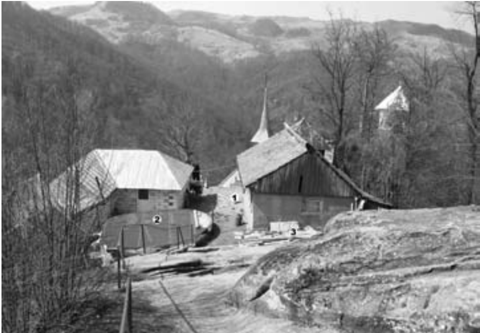
Fig. 4. Sectorul estic al cetății geto-dace de la Cetățeni. Vedere dinspre est. 1 - vestigiile turnului-locuință; 2 - cisterna mare, rotundă, acoperită și reutilizată de mănăstire; 3 - cisterna mică, rectangulară, transformată în groapă de var (foto D. Măndescu, aprilie 2007).

prin forma sa rectangulară cu laturile sensibil egale, cu pereții verticali și baza tăiată drept, cel de-al treilea rezervor de la Cetățeni se apropie de aspectul cisternei din cetatea de la Poienari, datată în sec. al XV-lea, aceasta din urmă având însă o construcție mult mai elaborată (Cantacuzino, Băzu 1970, 65-68).