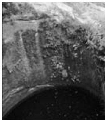
Fig. 3. Cisterna mare de la Cetățeni (după „Mănăstirea Cetățuia Negru Vodă – Album foto”).