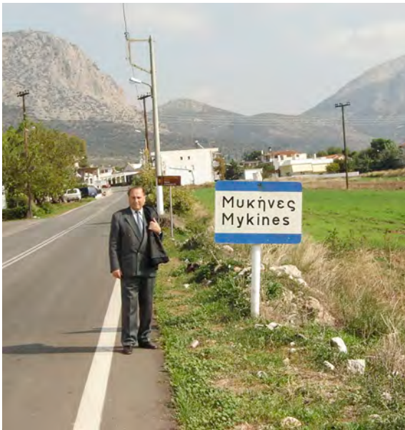
Micene, 2005. Împlinirea visului.