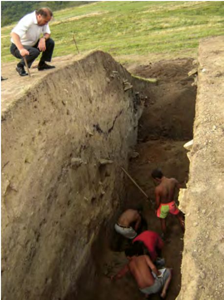
Saharna Mare, 2005. Cercetarea valului de apărare al fortificației getice.