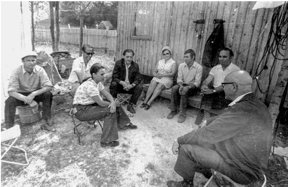
Hansca, 1975. Vizita conducerii Facultății de Istorie și a Institutului de Istorie al Academiei de Științe în tabăra arheologică.