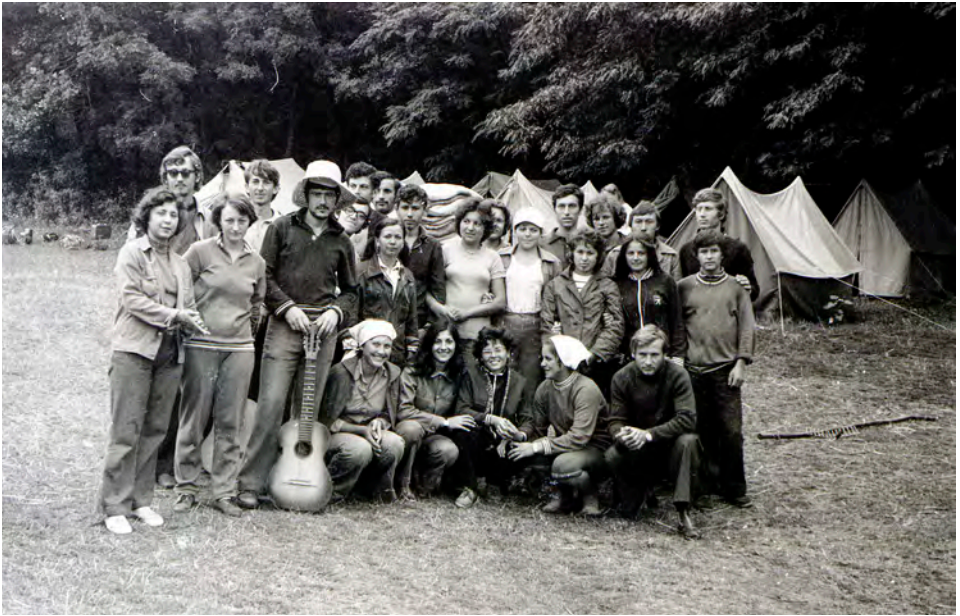
Hanska, 1976. Grup de studenți participanți la practica arheologică.