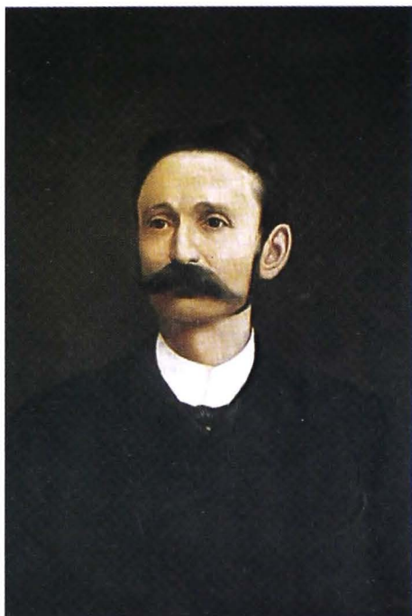
Istoricul Márki Sándor (cat. 17)