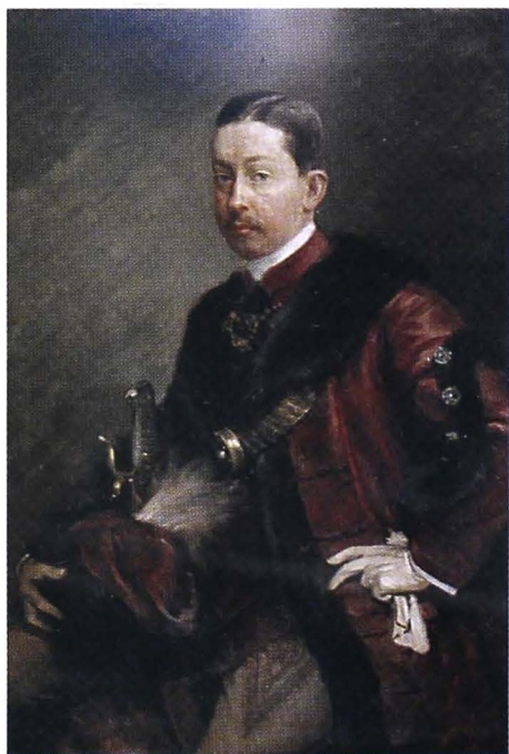
Antoniu II Mocsonyi de Foen (cat. 32)