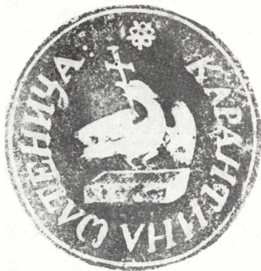
Fig. 6. Sigiliul carantinei Oltenița.