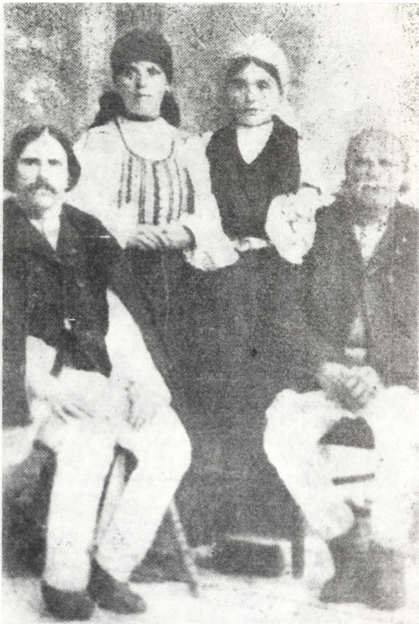
Fig. 8. Ciobani sălișteni participanți (bărbații) la transhumanța în Dobrogea. (După „Transilvania”, 1945).