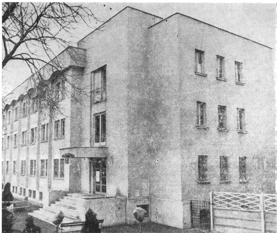
9 — Noul local al Arhivelor Statului din Craiova, str. Libertății nr. 34.

Se detașează de celelalte clădiri înconjurătoare, fiind o construcție solidă și dispunând de trei nivele, cu posibilitate de extindere în viitor.