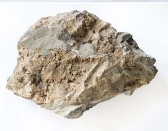
4385 Aur, Roșia Montană, AB