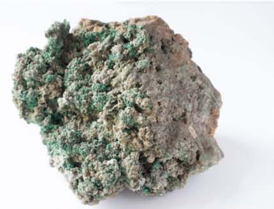
3955 Malahit, Dognecea, CS