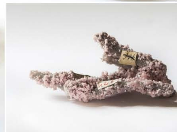
4261 Rodocrozit, Dognecea, CS