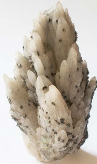
2396 Cuarț, Săcărâmb, HD