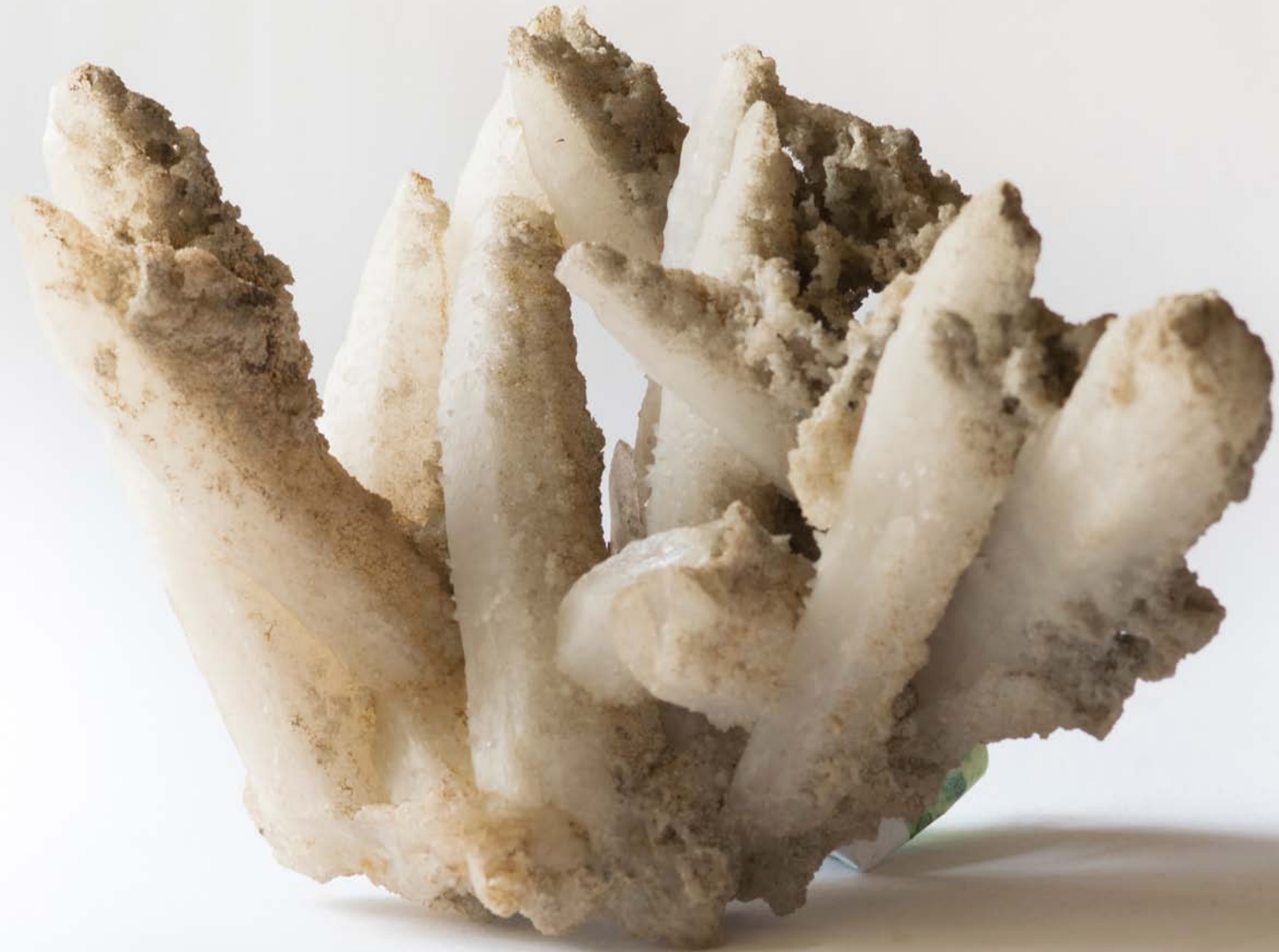
2505 Cuarț cu calcit, Băița, HD