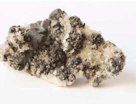
5623 Tetraedrit, Cavnic, MM