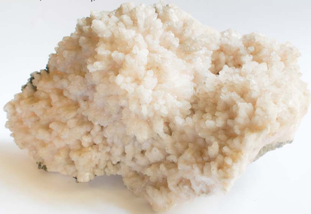
3256 Calcit roz, Baia de Arieș, AB