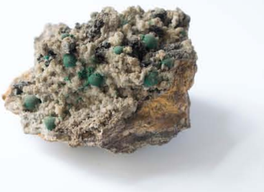
3954 Malahit, Dognecea, CS