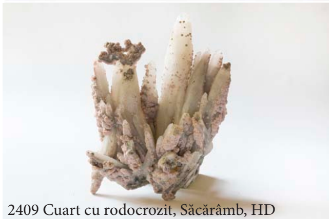
2409 Cuarț cu rodocrozit, Săcărâmb, HD