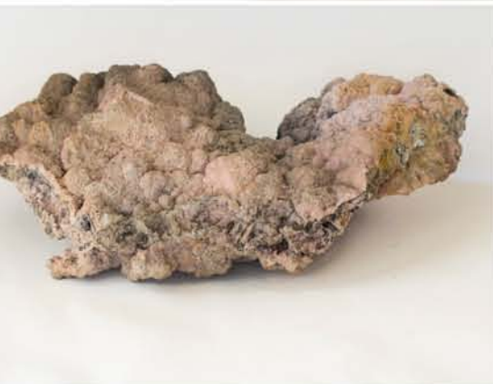
4263 Rodocrozit, Dognecea, CS