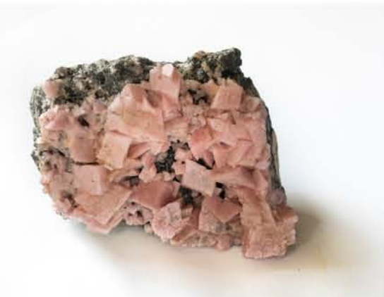
4226 Rodocrozit, Dognecea, CS