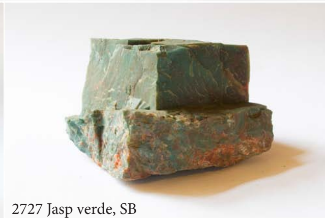
2727 Jasp verde, SB