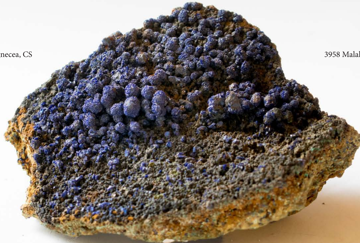
3958 Malahit, Dognecea, CS