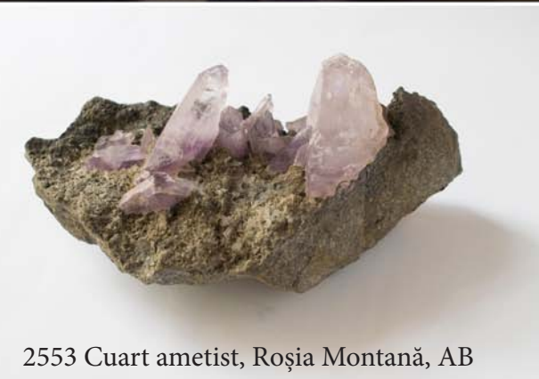
2553 Cuarț ametist, Roșia Montană, AB