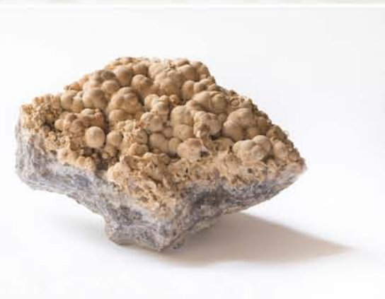
4299 Rodocrozit, Dognecea, CS