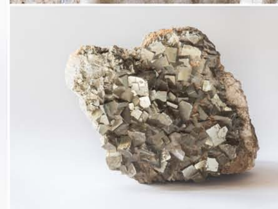
4961 Pirită, Dognecea, CS