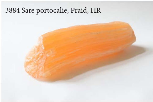
3884 Sare portocalie, Praid, HR