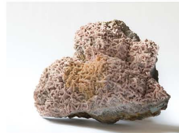
4275 Rodocrozit, Dognecea, CS