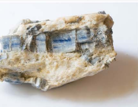
3074 Disten Sebeș, SB