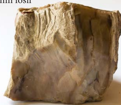
2792 Lemn fosil