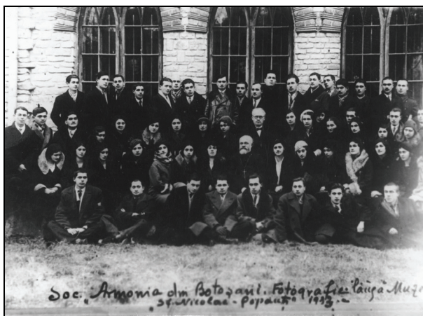
Societatea „Armonia” din Botoșani Fotografia este făcută lângă Muzeul „Sf. Nicolae” – Popăuți (1933)

B) O știre complet inedită (subl.a.) se referă la existența în Botoșani a unui Conservator particular de muzică. Sub titlul Dela Conservatorul de muzică gazeta scrie: „În toamna anului 1934, într-o ședință a comitetului Soc. muzicale „Armonia” s-a hotărât înființarea unui Conservator de Muzică. Lipsa unei astfel de școală s-a simțit de mult, căci sunt mulți tineri studiosi care așteaptă să fie îndrumați și pe această cale, de pe urma căreia își pot asigura o existență, sau se pot perfecționa. Drep-tul de funcționare de „ Conservator particular ” s-a recunoscut acum de către Onor. Minister al Artelor. Elevii absolvenți și pregătiți în acest conservator se vor putea prezenta la academiile de muzică din țară (București, Iași, Cluj) pentru a da echivalența.