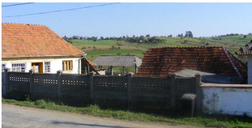
7. Imagine cu satul Vârciorog și locurile prin care erau aduși din satele Subpiatră și Hotar evreii refugiați