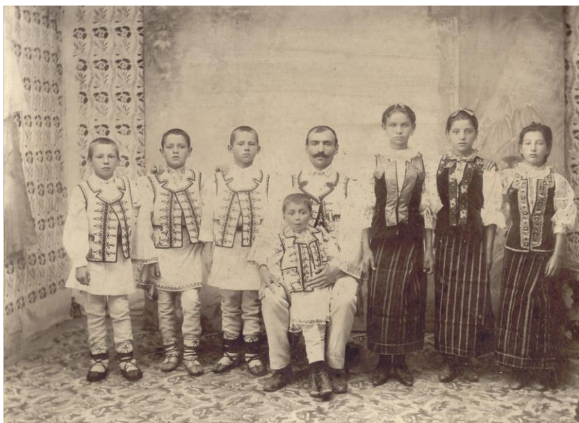
Fig. 3 1906 - Participanți din Oituz la expoziția jubiliară Organizată cu prilejul a 40 de ani de domnie ai regelui Carol I