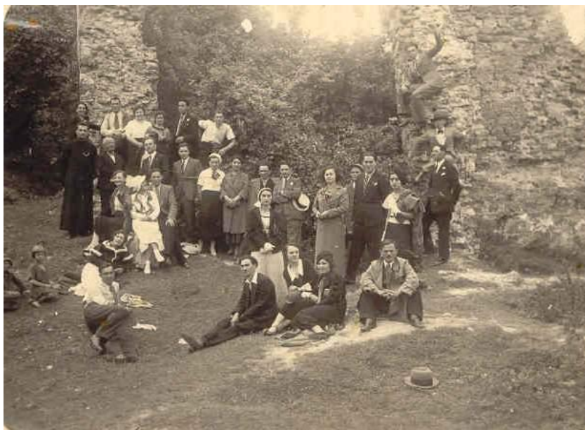
Fig. 10 Asociația Învățătorilor, subsecția Oituz, în Excursie pe Valea Bistriței (1935)