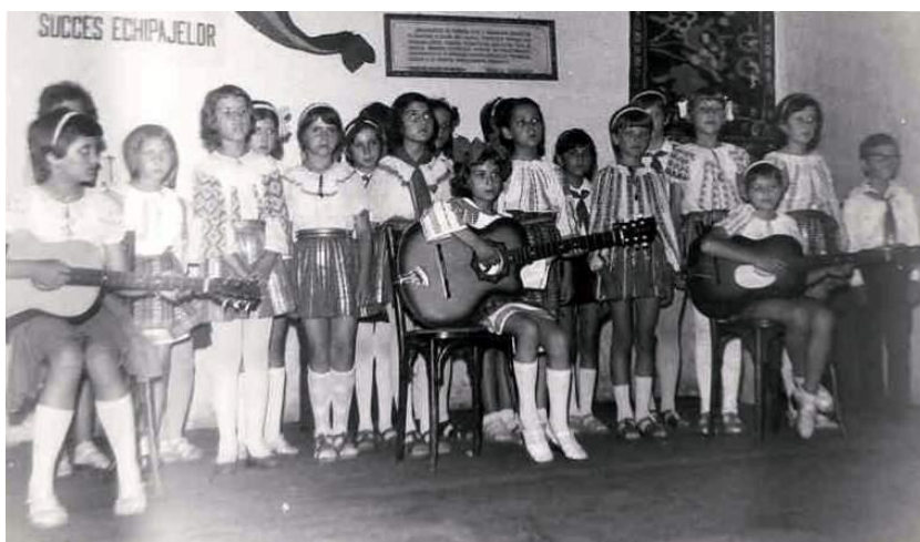
Fig. 39 Membrii corului Cîrîpel la activitățile „Memoria Oituzului” în anul 1982