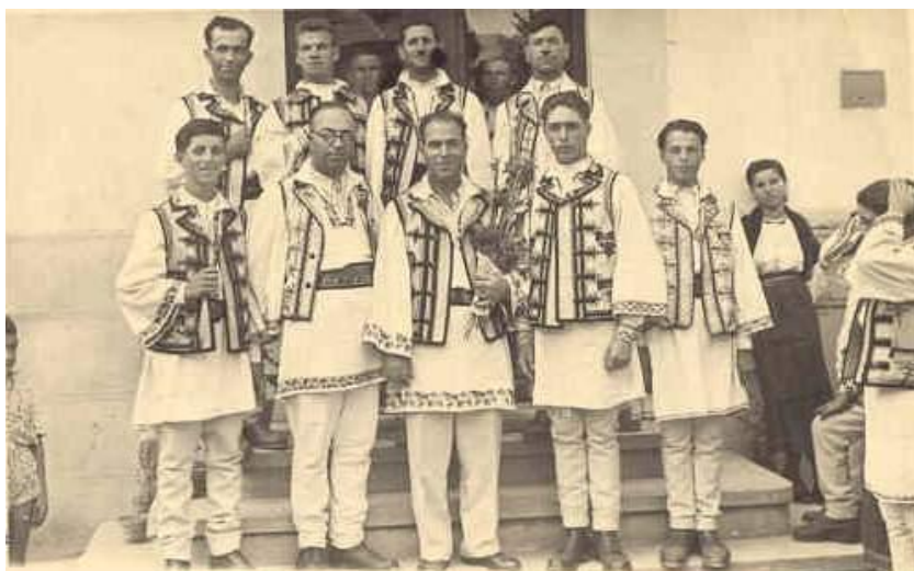
Fig. 18 Bașii din corul Căminului Cultural „Oituzul” după concursul de la București din 1951