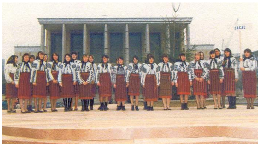
Fig. 41 Corul Căminului Cultural Oituz la prima ediție a festivalului național de colinde „Florile Dalbe” - Bacău 1996