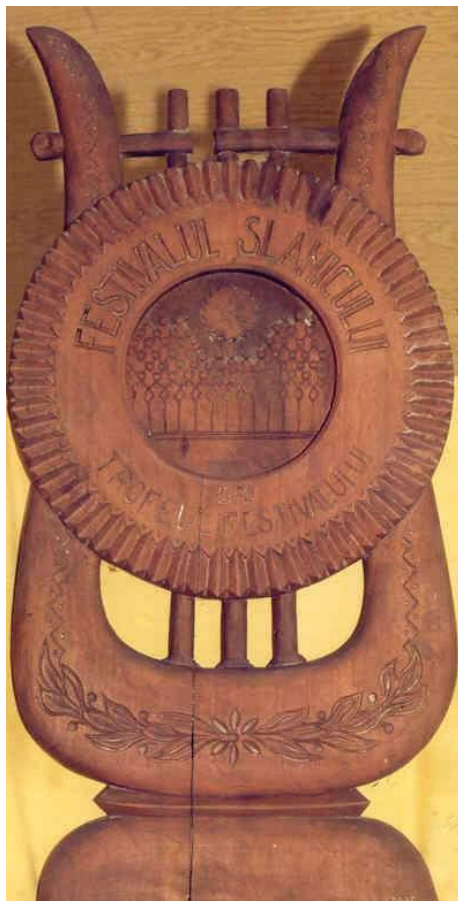
Fig. 29 Trofeul „Festivalul Slănicului” oferit corului din Oituz în anul 1970