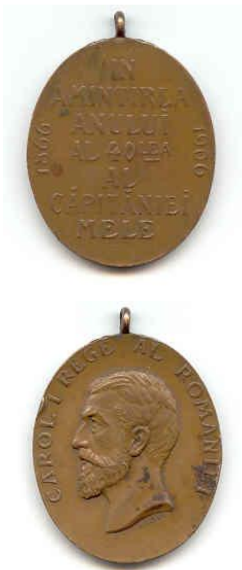
Fig. 4 Medalia înmănată participanților la expoziția Jubiliară din 15 august 1906