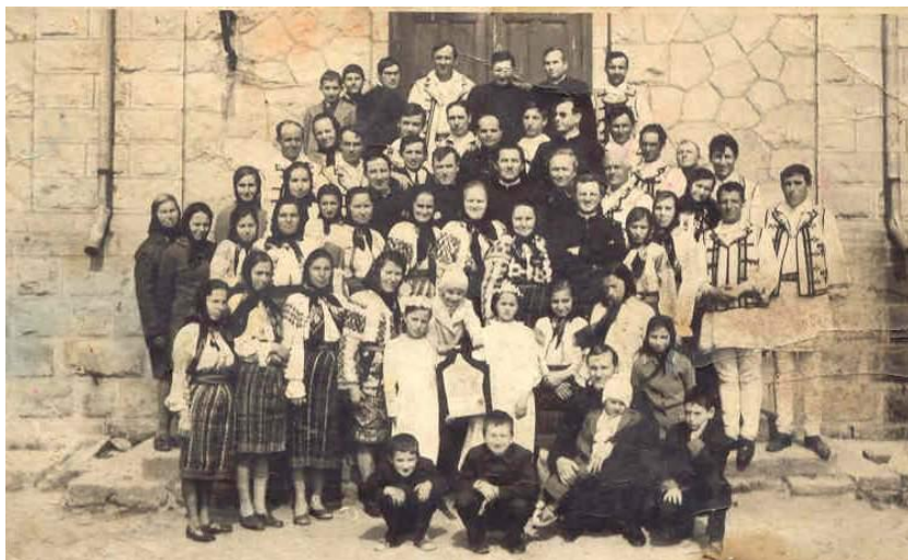
Fig. 14 Corul Bisericii Catolice la înmormântarea Preasfințitului episcop Petru Pleșca în anul 1976, la Oituz