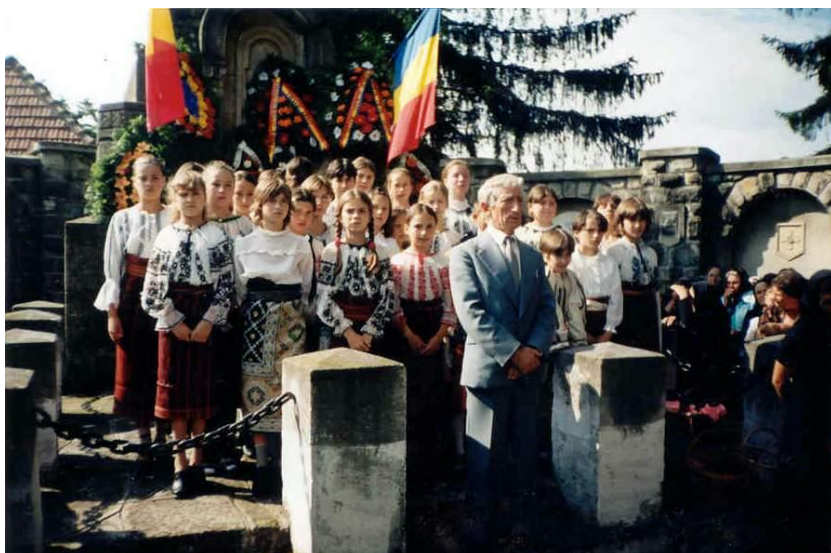
Fig. 46 Corul „Ciripel” sărbătorește ziua eroilor la Cimitirul și Monumentul Eroilor din Oituz, în anul 2002