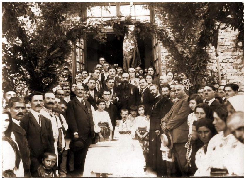
Fig. 6 1926 – Inaugurarea Ligii culturale din Oituz, în prezența profesorului Nicolae Iorga