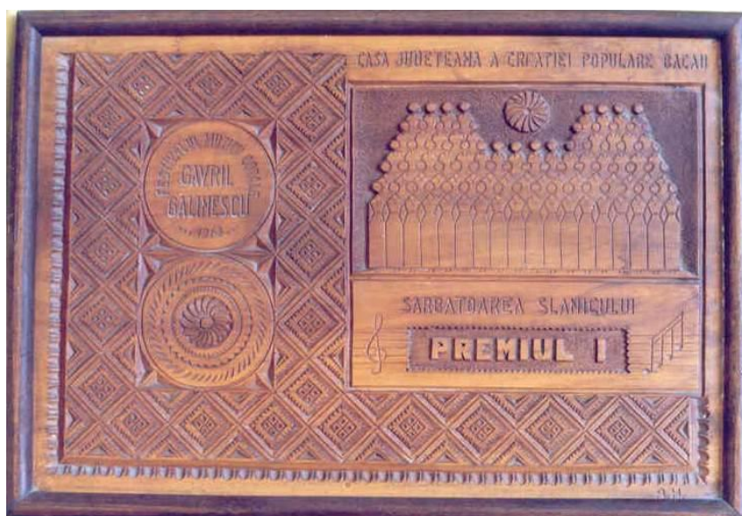
Fig. 26 Trofeul Festivalului muzicii corale „Gavril Galinescu”, oferit în anul 1968 corului din Oituz