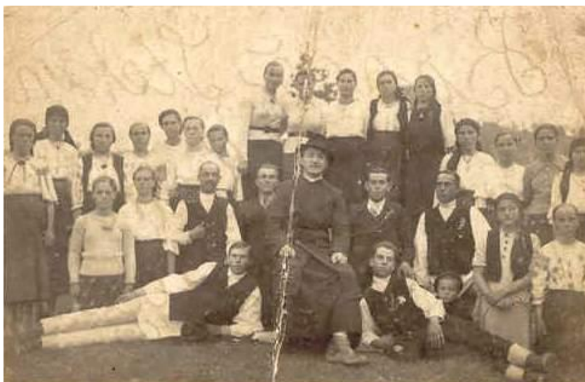
Fig 11 Corul Bisericii Catolice Oituz în anul 1937 cu preotul vicar de atunci