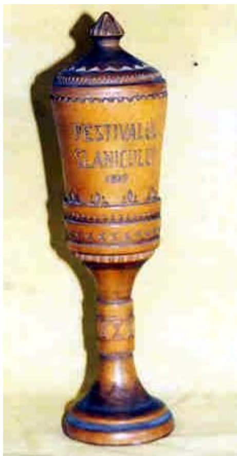
Fig. 27 Trofeul „Festivalul Slănicului” primit de corul din Oituz, în anul 1969