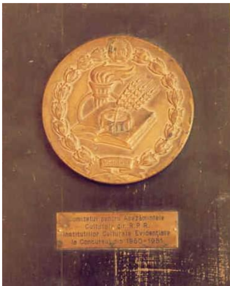
Fig. 19 Trofeul oferit corului din Oituz la concursul instituțiilor evidențiate la București - 1951