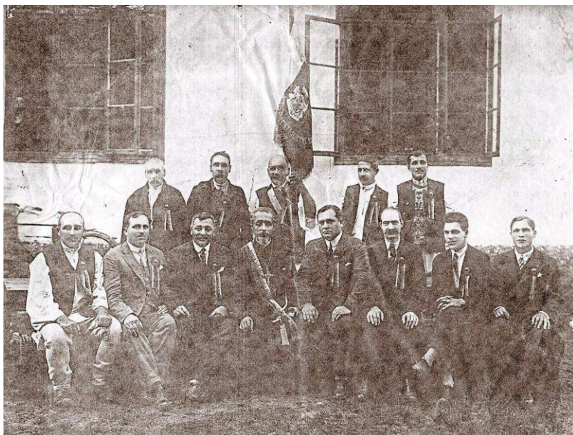
Fig. 7 Bași și tenori din corul popular, activiști fideli ai Ligii Culturale, secția Oituz