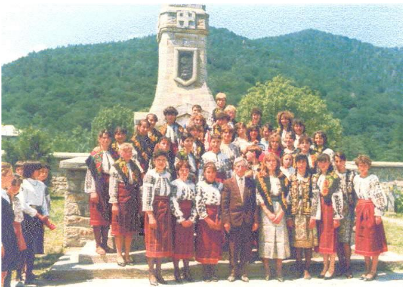
Fig. 40 Corul Căminului Cultural Oituz la comemorarea eroilor de la Cimitirul și Monumentul Eroilor din Poiana Sărată (1996)