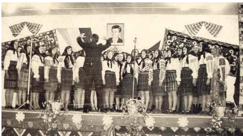
Fig. 34 Corul Căminului Cultural Oituz la faza intercomunală a concursului „Cântarea României”, Satul Nou, 1978”