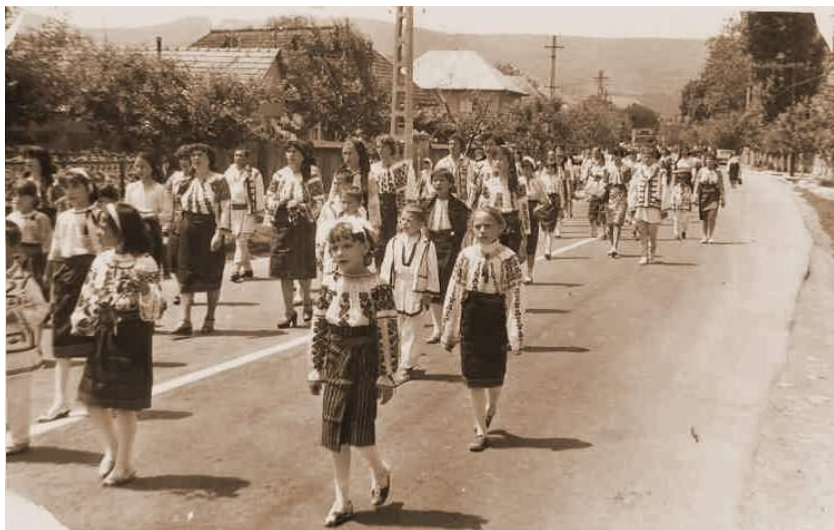
Fig. 33 Parada portului popular desfășurată în 1972, la întâlnirea veteranilor României Mari