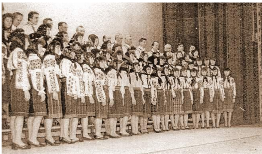
Fig. 35 Corul Căminului Cultural Oituz la un spectacol în anul 1987