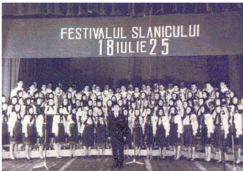
Fig. 28 Formația corală a Căminului Cultural Oituz la Festivalul Slănicului, în anul 1969