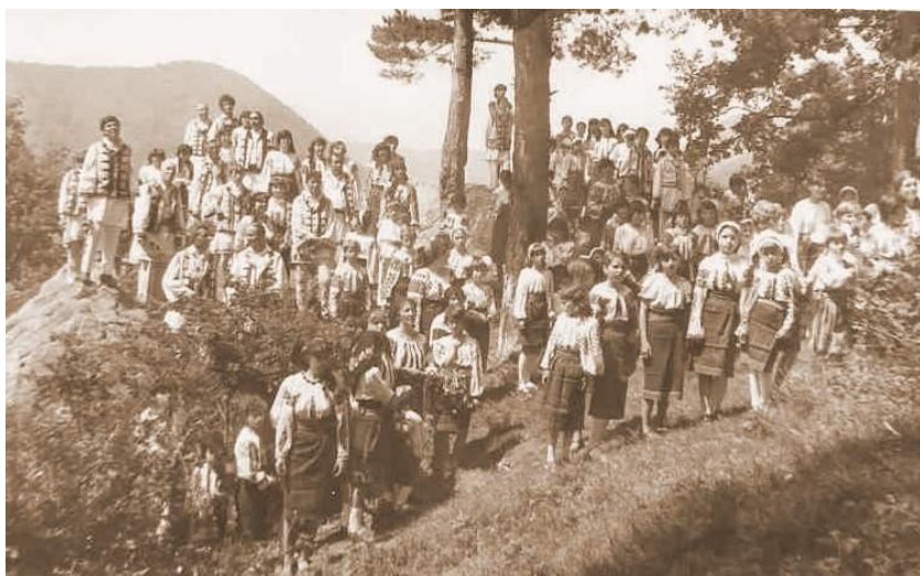
Fig. 37 Membrii formației corale a Căminului Cultural Oituz la activitatea „Memoria Oituzului”, desfășurată pe mamelonul Micloșca, la Monumentul Cavaleriei, în anul 1986