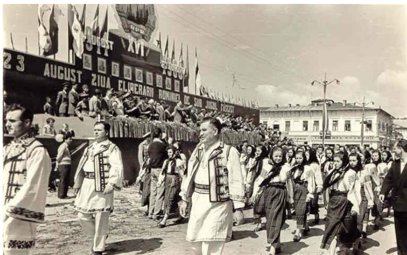
Fig. 20 Membrii formației corale Oituz la parada costumelor populare, desfășurată la Bacău, în anul 1960