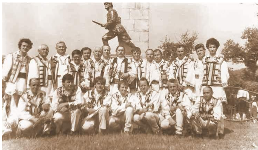
Fig. 36 Tenori și bași sărbătorind „Memoria Oituzului” în 1986 la Monumentul Cavaleriei