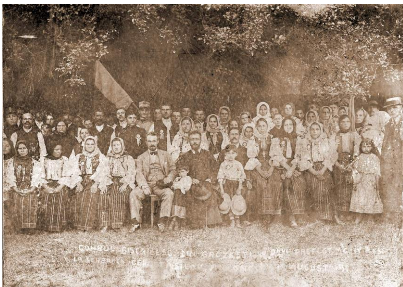
Fig. 5 Corul din Oituz la sărbătoarea cercetașilor din anul 1915, la Onești