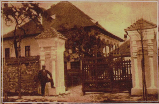
Casa lui Nicolae Iorga de la Vălenii de Munte