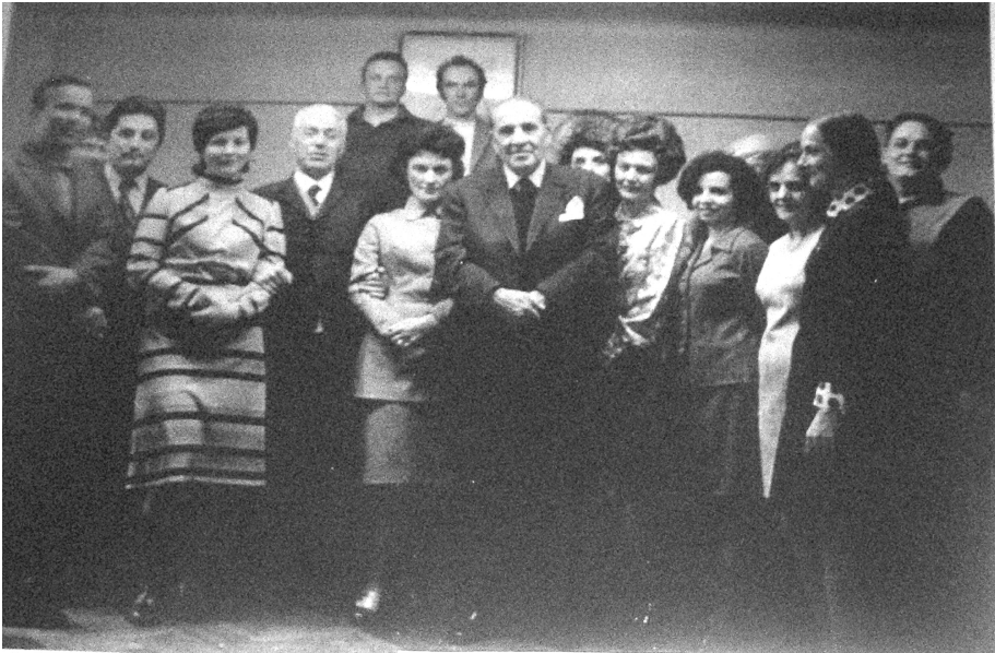
Constantin Daicoviciu în mijlocul colaboratorilor săi de la Muzeul de Istorie a Transilvaniei în anul 1960