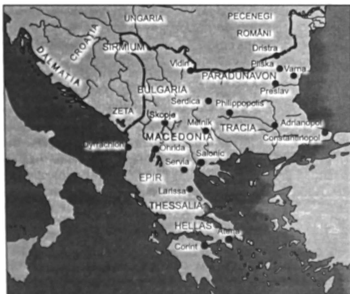
Partea europeană a Imperiului bizantin, în 1025

balcanică a lui Vasile al II-lea, condusă efectiv de generaliile Theodorokanos și Nikephor Xiphias. În scurt timp, puterea bizantină a fost restabilită între Dunăre și Balcani (nordul Dobrogei rămăsese sub dominație bizantină și după 986). În 1004, Vasile al II-lea a atacat și Macedonia, reușind ocuparea unor cetăți importante precum Servia și Vodenă. Astfel, Imperiul bizantin și-a asigurat o poziție strategică însemnată, apropiindu-se de centrul puterii bulgare. Luptele au continuat până la victoria decisivă bizantină din 20 iulie 1014, obținută în trecătoarea Kimbalongon, de pe valea râului Strymon. Samuel a murit după ce a aflat de dezastrul suferit de oastea sa (14 000 de prizonieri au fost orbiți și trimiși în această stare țărului bulgar). Următorii patru ani au reprezentat agonia statului