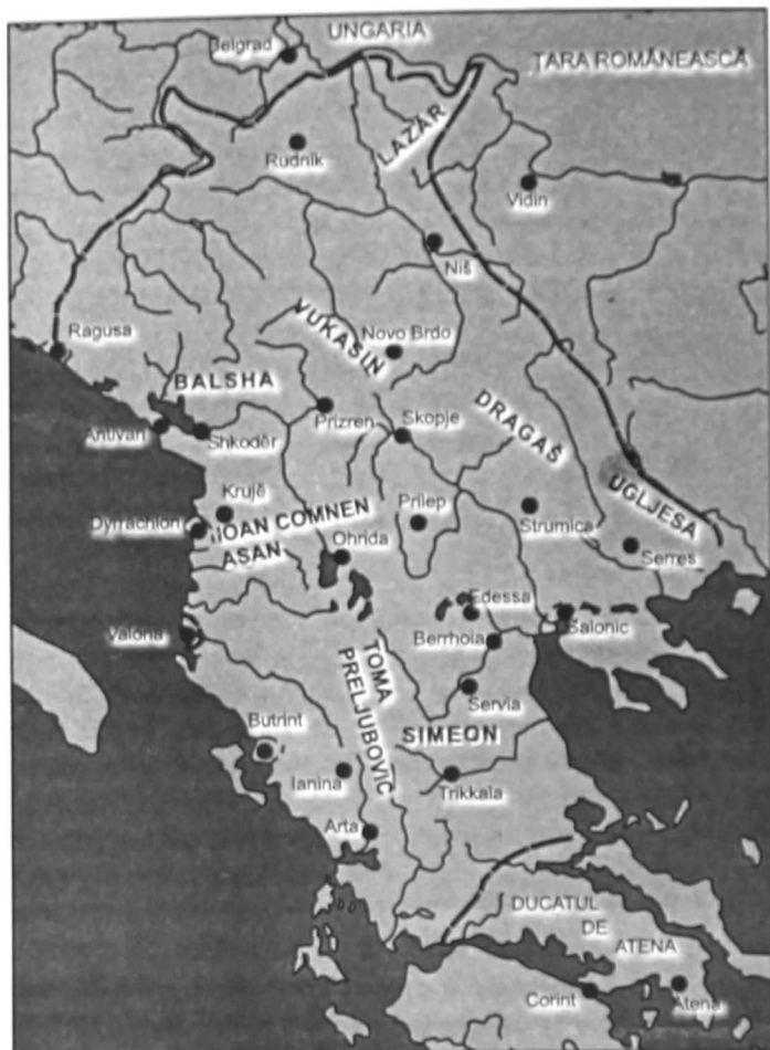
Statele succesoare ale Serbiei Mari

a fost condus de despotul Ioan Uglieșa între 1365 și 1371, după ce Elena, văduva lui Ștefan Dușan, i-a cedat acestuia puterea. Statul sârb de la Serres a fost foarte puternic influențat