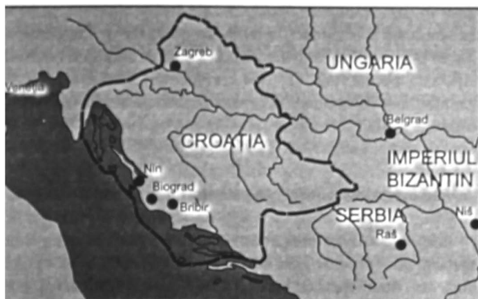
Croația în jurul anului 1070

a luat în stăpânire acest stat în 1102, detronându-l pe ultimul rege croat Petar Svačić (1093–1097). Coloman s-a încoronat ca rege al Croației, Slavoniei și Dalmației, iar Croația a devenit o parte a Ungariei. Totuși, s-au menținut însemnate forme de autonomie, care au permis supraviețuirea identității etnice și culturale croate. Conducerea efectivă aparținea banului Croației, care era un fel de vicerege 27 .