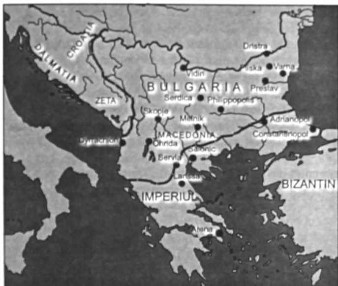
Bulgaria în timpul lui Simeon

A urmat o perioadă de pace, întreruptă însă de decizia noului împărat bizantin Alexandru (912–913) de a sista subsidiile pe care le primea Bulgaria în virtutea tratatului din 896. Simeon a pornit din nou război contra Imperiului bizantin, într-un context cu totul special. Alexandru a murit după un an de domnie și, fiindcă urmașul său Constantin al VII-lea era minor, s-a instituit o regență condusă de patriarhul Nicolae Misticul (912–925). Acesta îl considera nelegitim pe Constantin, fiindcă provenea dintr-o căsătorie a lui Leon al VI-lea pe care biserica o considera ilegală (fusesse a patra căsătorie, iar canoanele bisericești interziceau așa ceva). Simeon a profitat magistral de situația creată și, în vara anului 913, a înaintat rapid spre Constantinopol, dorind nici mai mult nici mai puțin decât să fie recunoscut împărat al Bizanțului. Pretenția sa se