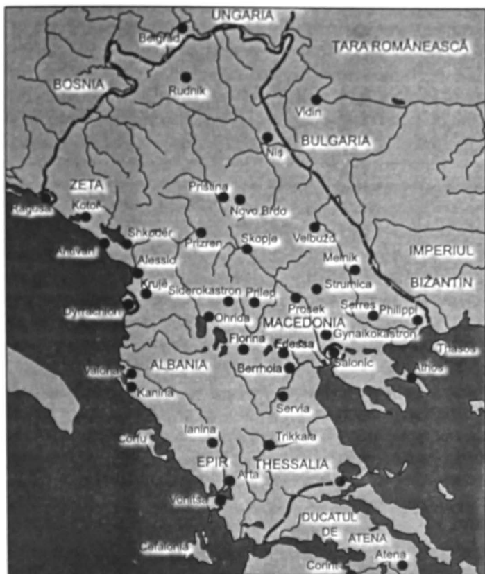
Serbia în timpul lui Ștefan Dušan

cauză, mitul Serbiei Mari a supraviețuit în ideologia națională sârbă și a legitimat renașterea națională din secolul al XIX-lea, politica Serbiei față de statele vecine, precum și hegemonia sârbă în cadrul federației iugoslave.