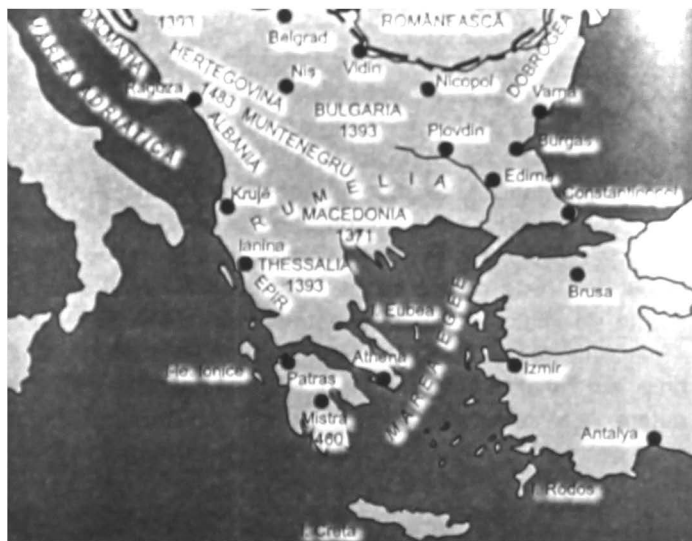
Partea europeană a Imperiului otoman în secolele XIV–XV

Vukčić. Teritoriul a primit numele de Herțegovina (de la herțeg = „duce”). Herțegovina a intrat și ea sub dominație otomană în 1482–1483 124 .