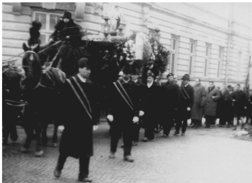
Spre cimitir, Cernăuți, 25 ian. 1939