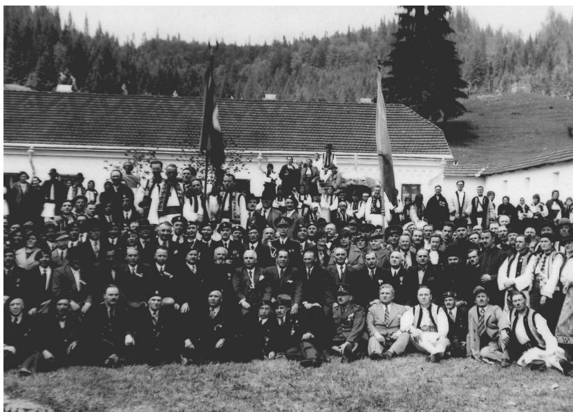
Putna la comemorarea a 430 de ani de la moartea lui Ștefan cel Mare, 1934

În 1934 participă la manifestările și marea aniversare a Mănăstirii Putna, iar în 1935 ia parte la aniversarea de 25 de ani de la bacalaureat, cu care mai țin cuvântări o serie de personalități bucovinene.