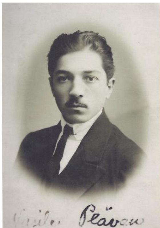
Vasile Plăvan, 1934