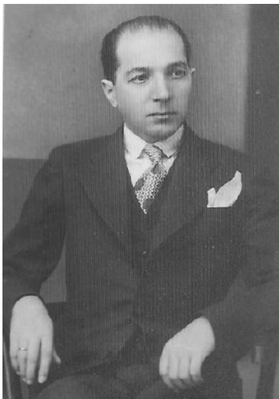
Vasile Plăvan, cu puțin înainte de moarte, 1938