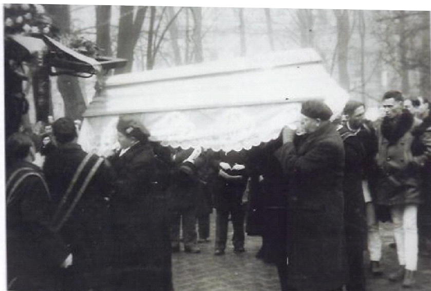
Înmormântarea lui Vasile Plăvan, Cernăuți, 1939