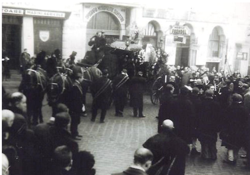
Cortetegiul motuar, Piața Unirii, 25 ian. 1939