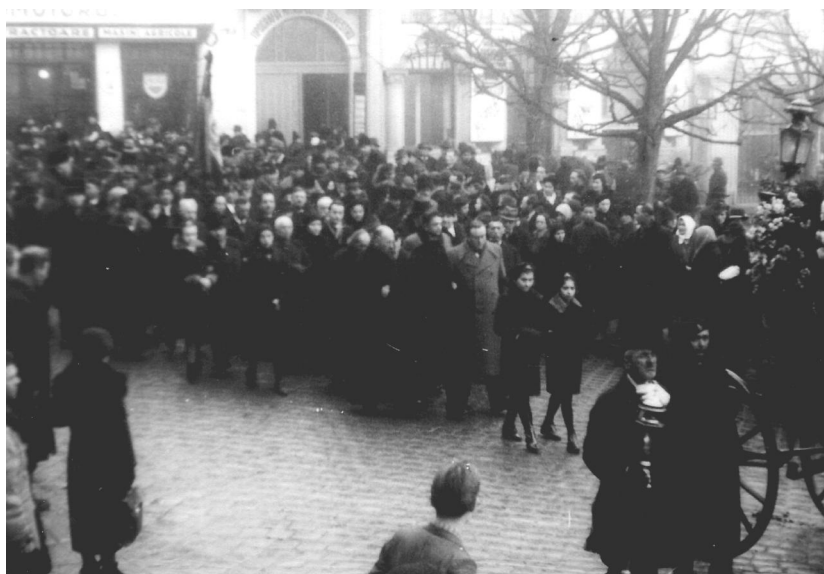
Cortegiul mortuar pornind din Piața Unirii, 25 ian. 1939