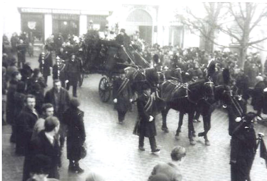
Înmormântarea lui Vasile Plăvan, Cernăuți, 25 ian., 1939