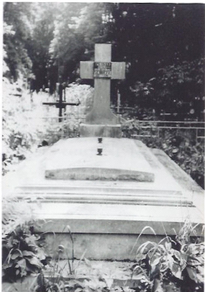
Mormântul lui Vasile Plăvan de la Cernăuți, 1992