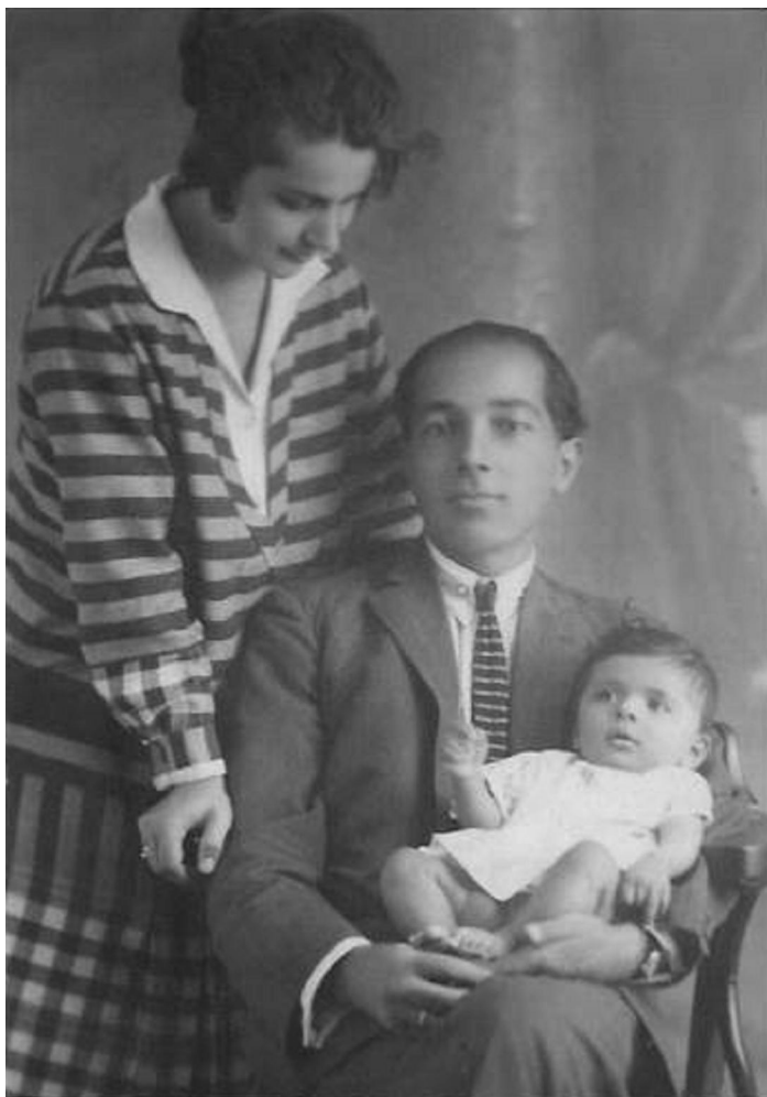
Fam. Plăvan în anul 1927