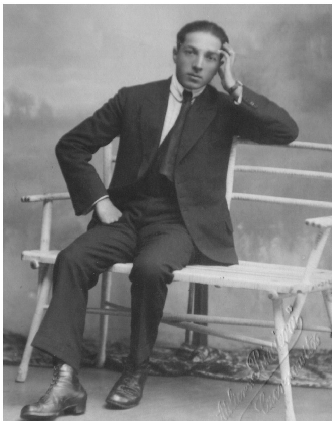
Vasile Plăvan în tinerețe