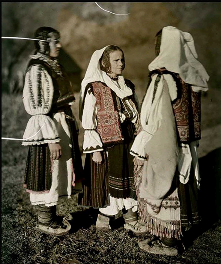
Imagini autocrom din colecția Galloway a Muzeului Etnografic al Transilvaniei (1931-1933)