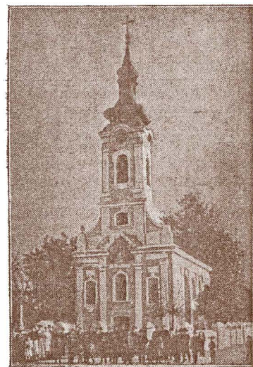
Frumoasa biserică din Nereu.

“Libărtatea” ziar săptămânal din Orăștia în adausul ei literar numit: “Foaia interesantă” Nro 28 dela 15/28 Iuliu 1910, are următorul comunicat cu fotografia bisericeii: