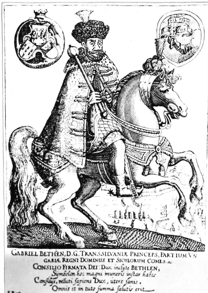
GABRIEL BETHLEN 1613 oct.23- +1629 nov.15