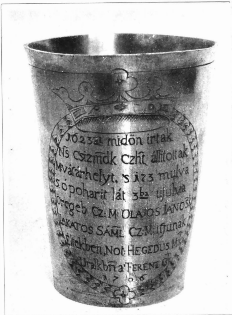
Paharul breslei croitorilor, 1623.