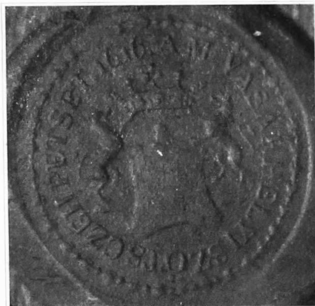
Sigiliul breslei cojocarilor, 1616.