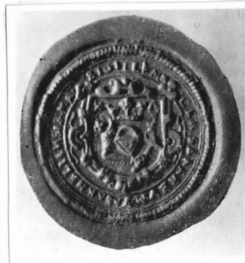
Sigiliul breslei lăcătușilor. Inceputul secolului al XVII-lea.