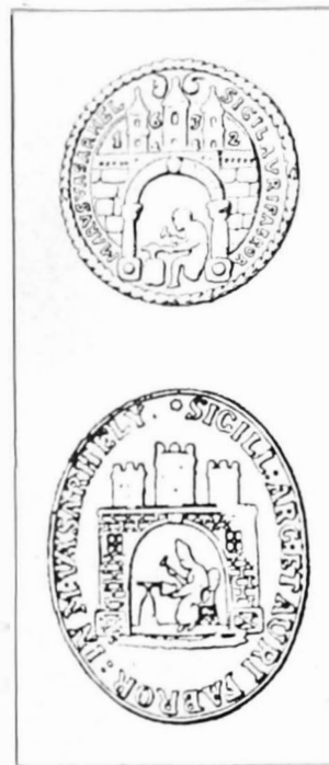
Sigiliul breslei aurarilor. 1632.