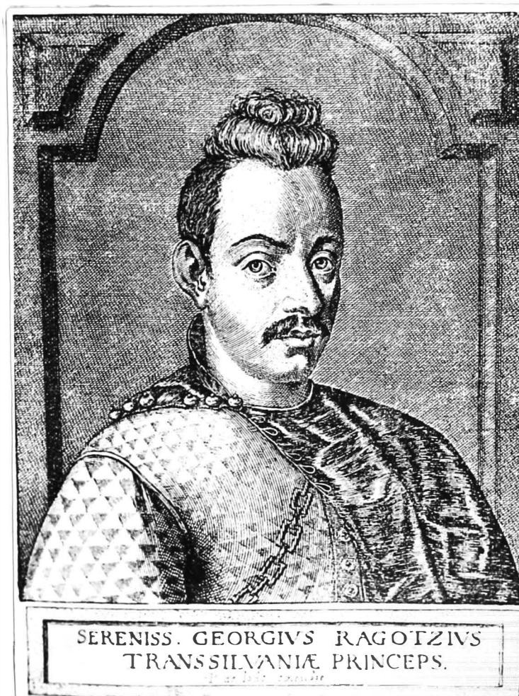
GHEORGHIE RAKOCZI I. 1630 dec.1- + 1648 octombrie 11